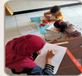
MELAKUKAN KEGIATAN MEWARNAI DAN BELAJAR BERHITUNG MENGGUNAKAN PENGURANGAN DAN PENAMBAHAN