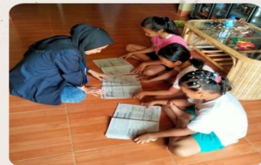
Melakukan kegiatan pendampingan belajar pada anak SD