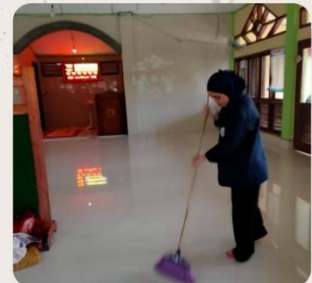
Melakukan bersih-bersih masjid didesa wirabangun