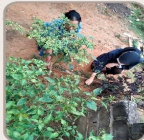
Melakukan kegiatan berkebun cabai di warga sekitar