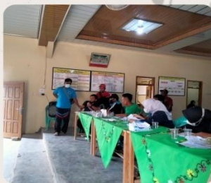
Telah dilaksanakan pembagian bantuan beras kepada masyarakat setempat di balaidesa wirabangun