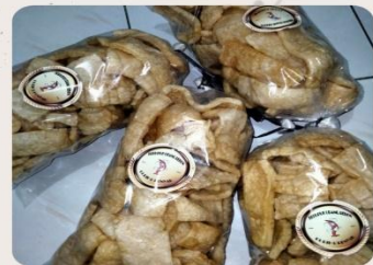
MELAKUKAN KEGIATAN PENEMPELAN LOGO PADA KERUPUK UDANG