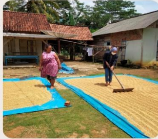
MELAKUKAN KEGIATAN MEMBANTU MENJEMUR PADI MILIK WARGA SEKITAR

Melakukan kegiatan mewarnai dan belajar berhitung menggunakan pengurangan dan penambahan, menjemur padi milik waga sekitar agar supaya meringankan pekerjaan petani padi tersebut, dan membantu berkebun cabai milik warga sekitar agar tetap menjaga kebersihan pada kebun tersebut.