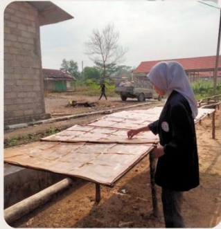
Melakukan penjemuran pada kerupuk dan menunggunya beberapa hari