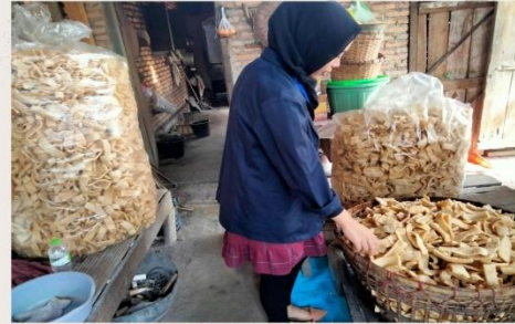
Melakukan penggorengan kerupuk setelah dijemur beberapa hari