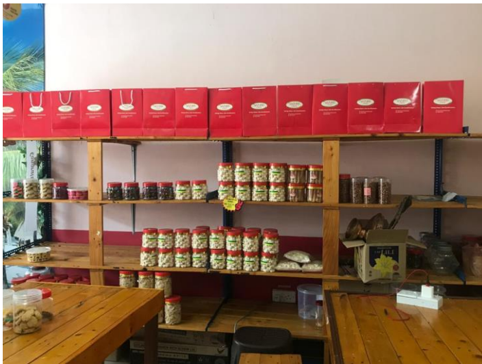
Picture 3: Rak-rak yang digunakan untuk menyimpan persediaan dan dipajang di bagian depan pertokoan.