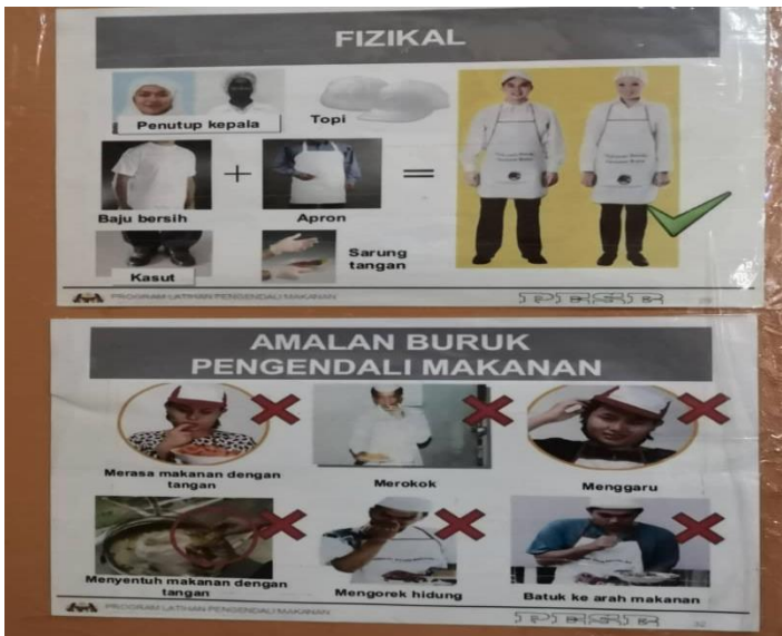
Picture 5: Pembatasan kode pakaian tempat kerja ditampilkan setinggi mata untuk referensi mudah.