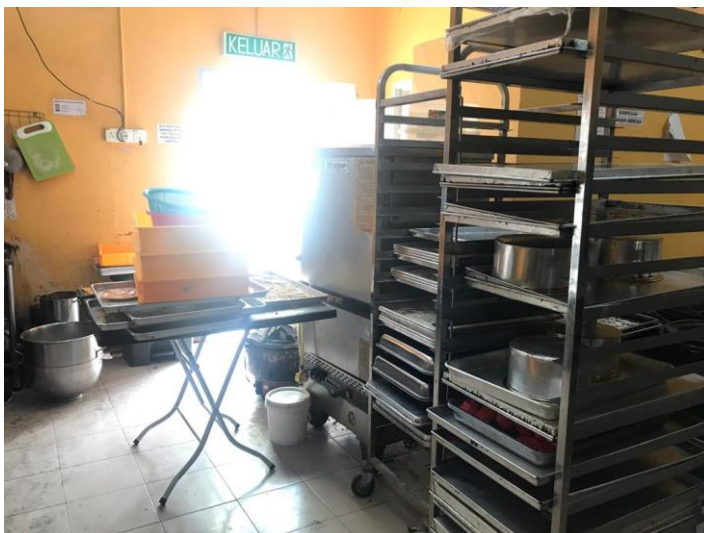
Picture 12: Tampilan lebih dekat dari rak nampan kue, alat lain-lain dan keluar melalui pintu belakang untuk pasokan bahan.