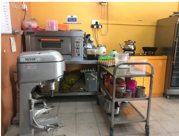
Picture 9: Fasilitas Operasi Area 4, 2 pengaduk adonan, oven kue berukuran sedang dan peralatan lain-lain.