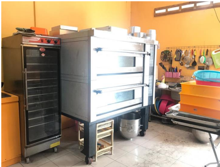
Picture 11: Tampilan lebih dekat dari oven kue yang terletak di Area 5, area wastafel.