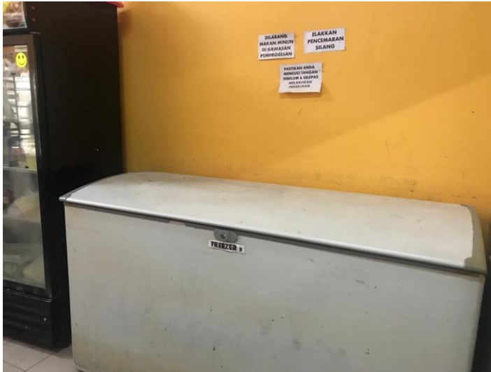
Picture 4: Freezer berlabel terletak di pintu masuk lantai operasi di belakang lot toko.