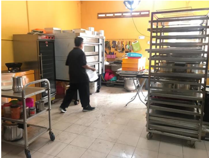
Picture 10: Fasilitas operasi Area 5, 2 rak nampan kue, 1 oven kue vertikal dan dua oven kue besar.