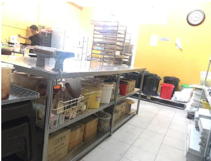
Picture 8: Fasilitas operasi Area 3, penyimpanan bahan dan alat, area pengemasan.