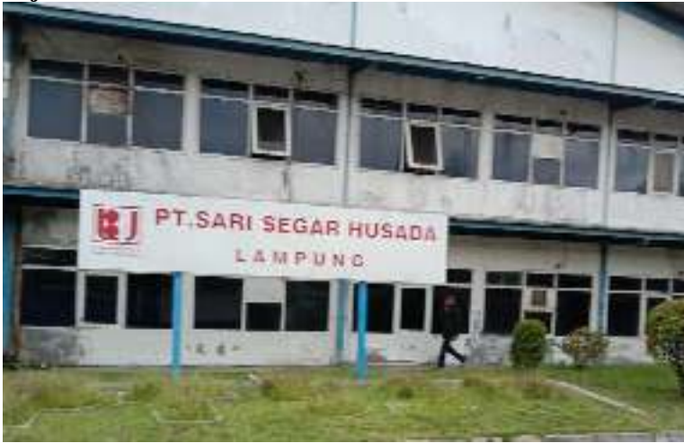
Gambar 1.1 PT.SARI SEGAR HUSADA

PT. Sari Segar Husada merupakan salah satu perusahaan yang bergerak Di bidang distribusi, nata decoco, santan kelapa dan makaron delcoco ( dc ),Ke berbagai distributor yang telah menjadi mitra kerjanya dalam Mendistribusikan hasil olahan atau produksi barangnya. PT. Sari Segar Husada (SSH), selalu mengutamakan hasil produksi yang sangat berkualitas, Untuk hasil produksi atau olahan yang sudah lulus uji kesehatan dan layak Konsumsi barulah akan di pasarkan untuk selanjutnya di jual ke berbagai Daerah bahkan luar negeri. Dengan banyaknya permintaan barang dari Distributor ini membuktikan bahwa hasil produksi yang dihasilkan cukup Baik sehingga permintaan dari distributor semakin meningkat. PT. Sari Segar Husada (SSH), lampung selatan berlokasi di Jl. Raya Bakauhuni KM. 16 Tarahan Lampung selatan. Perusahaan ini berdiri pada tahun 1897 dan Mulai oprasi dalam sekala besar ditahun 1991. Semenjak beroperasi Perusahaan ini berkembang sangat pesat sehingga hasil olahan atau Produksinya mampu menjual hingga keluar daerah dan luar negeri.