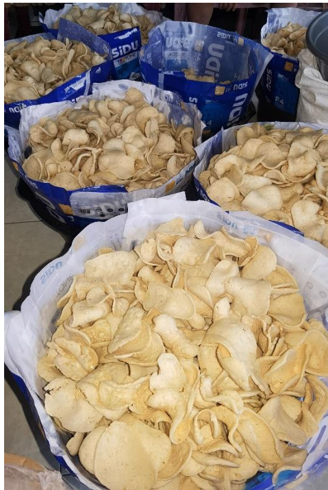
Kerupuk dalam proses pendinginan sehabis di goreng