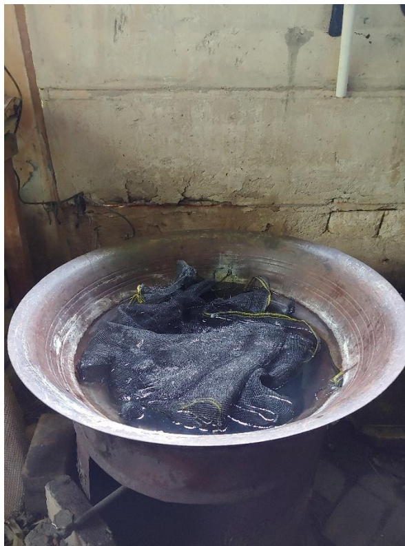
Tempat pengukusan Kemplang dan Kerupuk