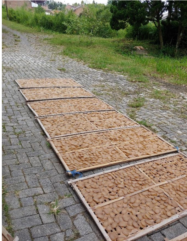
Penjemuran kerupuk & kemplang