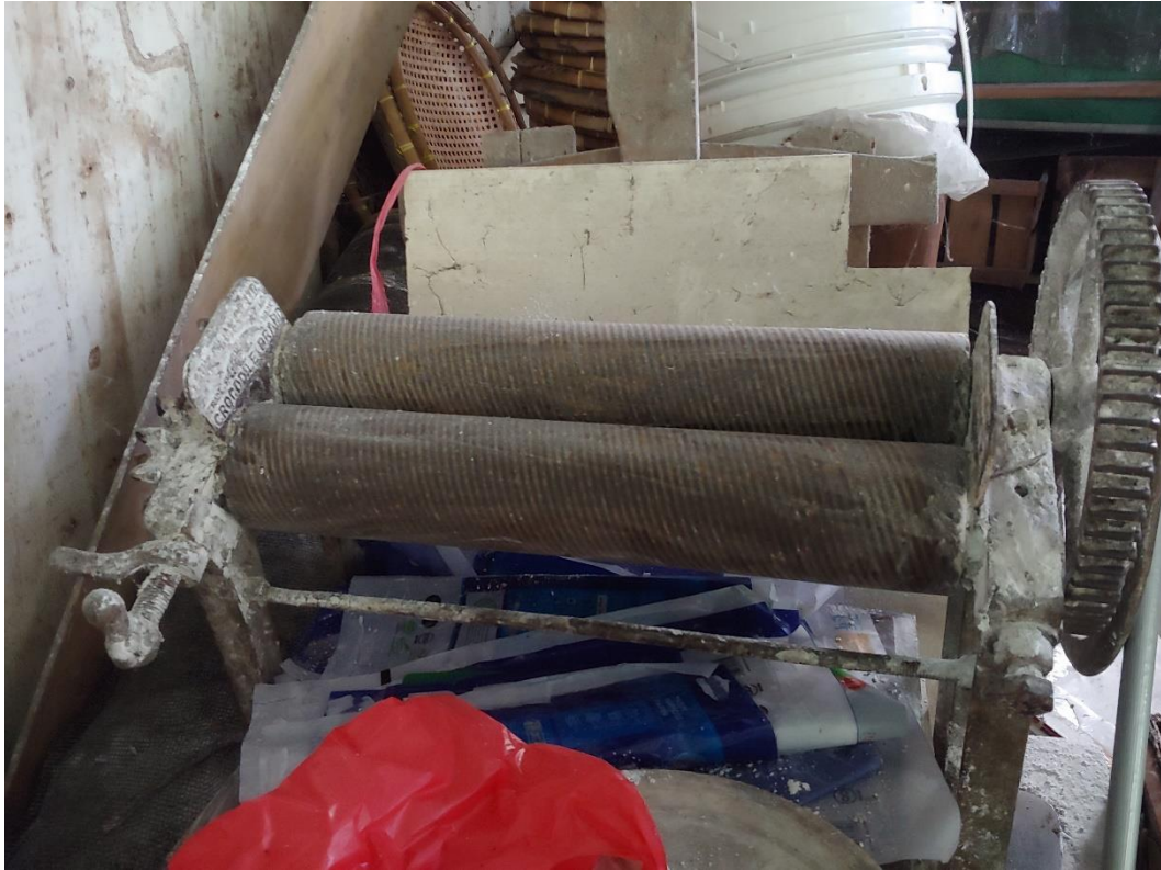
Alat Perata Adonan