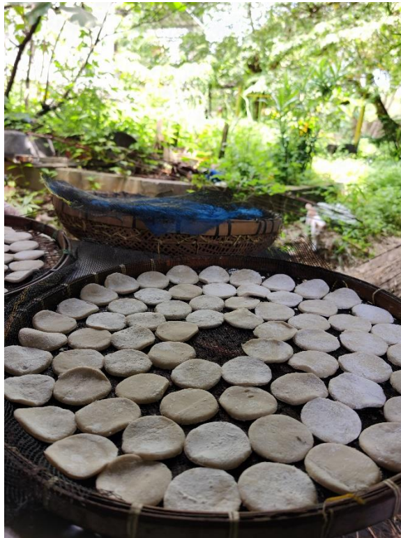
Kemplang Setengah jadi