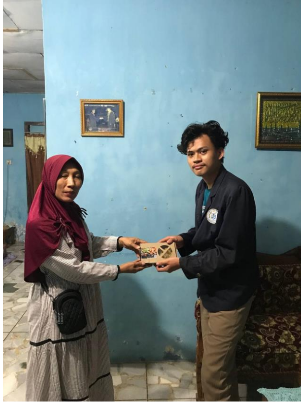
Gambar 2.4 Menunjukkan packaging baru kepada UMKM