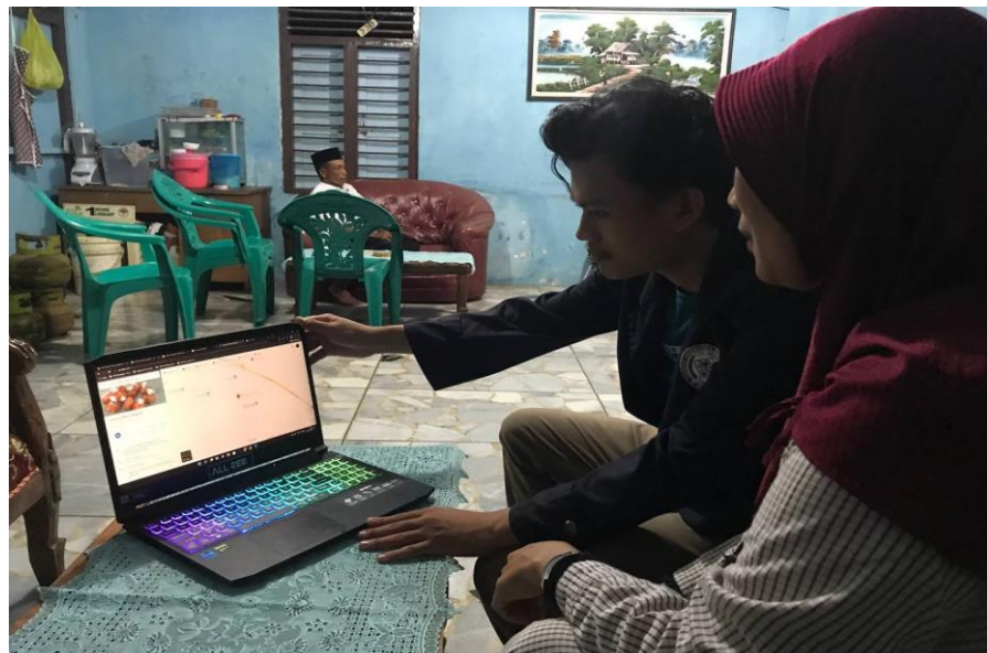
Gambar 2.2 Menunjukkan lokasi kepada pemilik UMKM

Apapun kegiatan lain yaitu menunjukkan hasil kerja bahwa telah terdaftarnya UMKM Jenang Wagirah pada google map dan dapat memberi tahu kepada konsumen yang ingin memesan secara langsung dapat dilihat pada gambar 2.2.