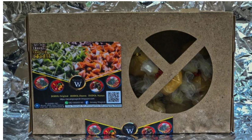
Gambar 2.3 Packaging baru untuk Jenang Wagira

Adapun packaging baru yang sudah siap digunakan untuk kedepannya yang mula nya 1000 gram kini bisa dibeli dengan lebih ekonomis dengan kemasan 250 gram menggunakan box dapat dilihat pada gambar 2.3 .