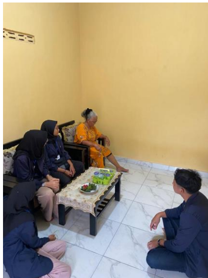
Gambar 2.3 Kunjungan Dan Mencari Informasi Tentang UMKM