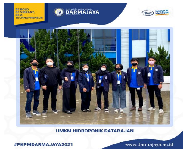
Gambar 2.1 Pelepasan Mahasiswa