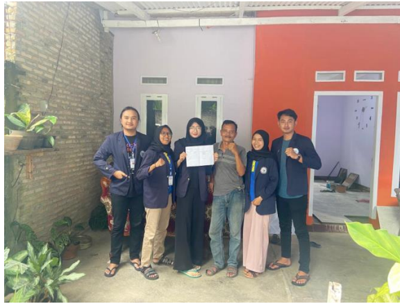
Gambar 2.2 Meminta Izin Kepada RT setempat