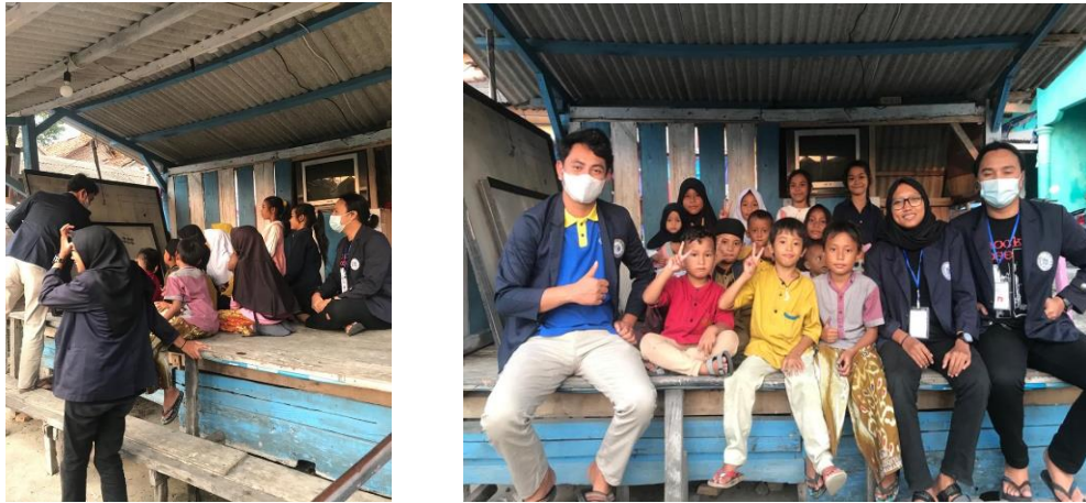
Gambar 2.5 Pendampingan Pembelajaran Dan Edukasi