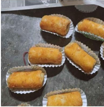
jajanan Pasar Sangat Lezat dan Bergizi