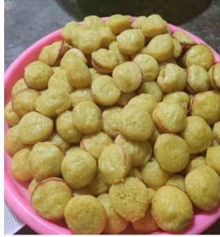
jajanan Pasar Sangat Lezat dan Bergizi