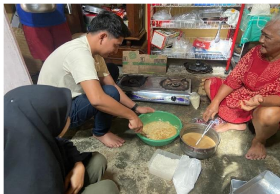
Gambar 2.4 Pembuatan kue Bika Ambon

7. Jenis-jenis kue yang produksi UMKM Emak JOHATI. Hal tersebut dapat dilihat pada gambar berikut