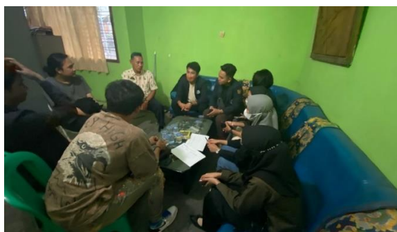
Gambar 2.1 Meminta Izin Kepada Kepala Desa Kalianda