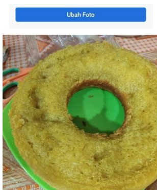
jajanan Pasar Sangat Lezat dan Bergizi Rp 1.500 Ditawarkan 2 menit lalu di Lampung Selatan