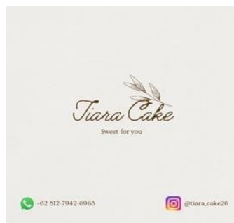
Gambar 5. Pembuatan Logo UMKM

5. Pembuatan Logo UMKM atau Pembuatan Desain Merk dengan menggunakan aplikasi Photoshop. pada produk tersebut dengan diberikan nama Merk pemilik usaha dan produk apa saja yang dijual pada Gambar 5.