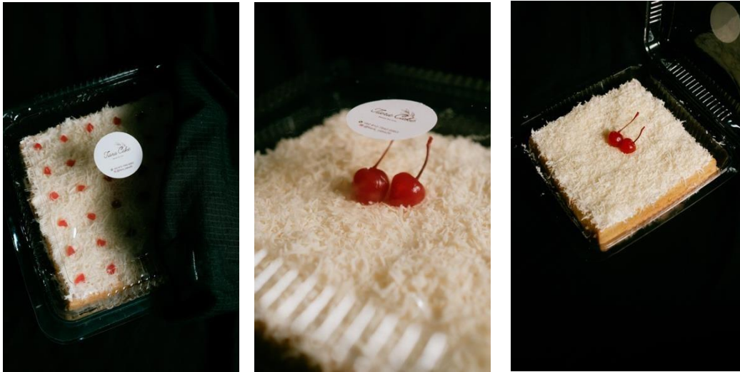
Gambar 4. Pengemasan Kue

4. Pengemasan Kue dilihat pada Gambar 4.