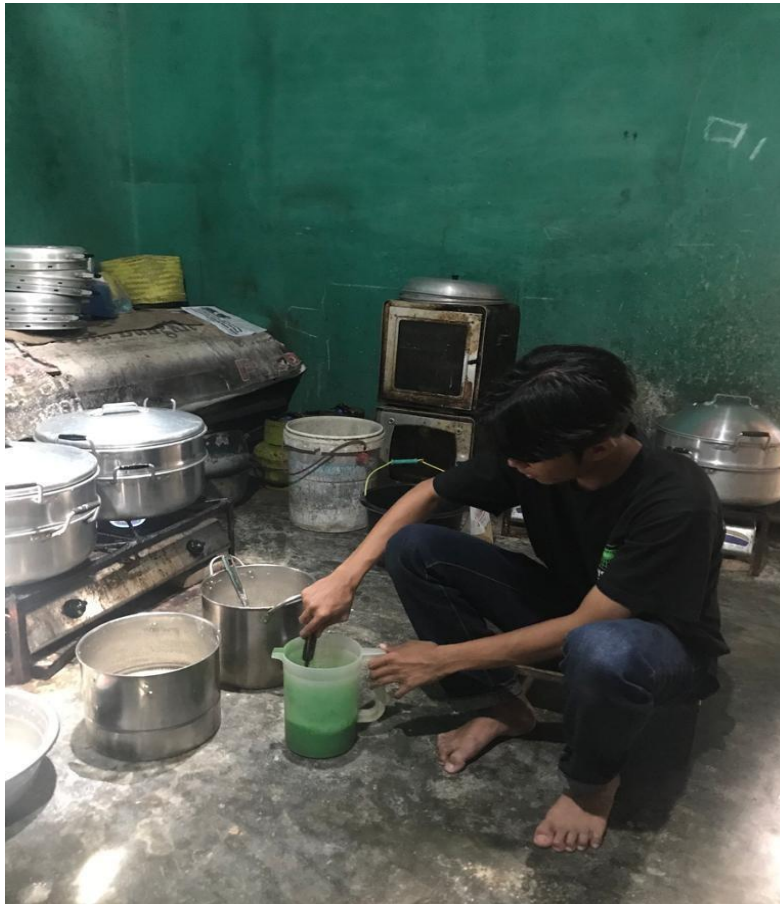
Gambar 1. Pembuatan Kue Lapis