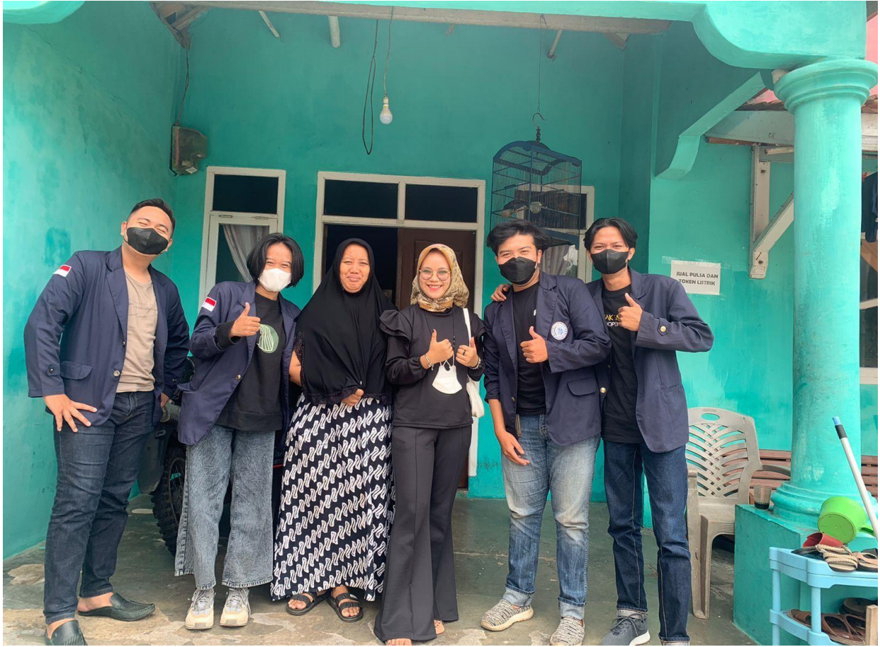
Gambar 3. Sesi Dokumentasi dengan Pihak UMKM Kue Basah dan Kering