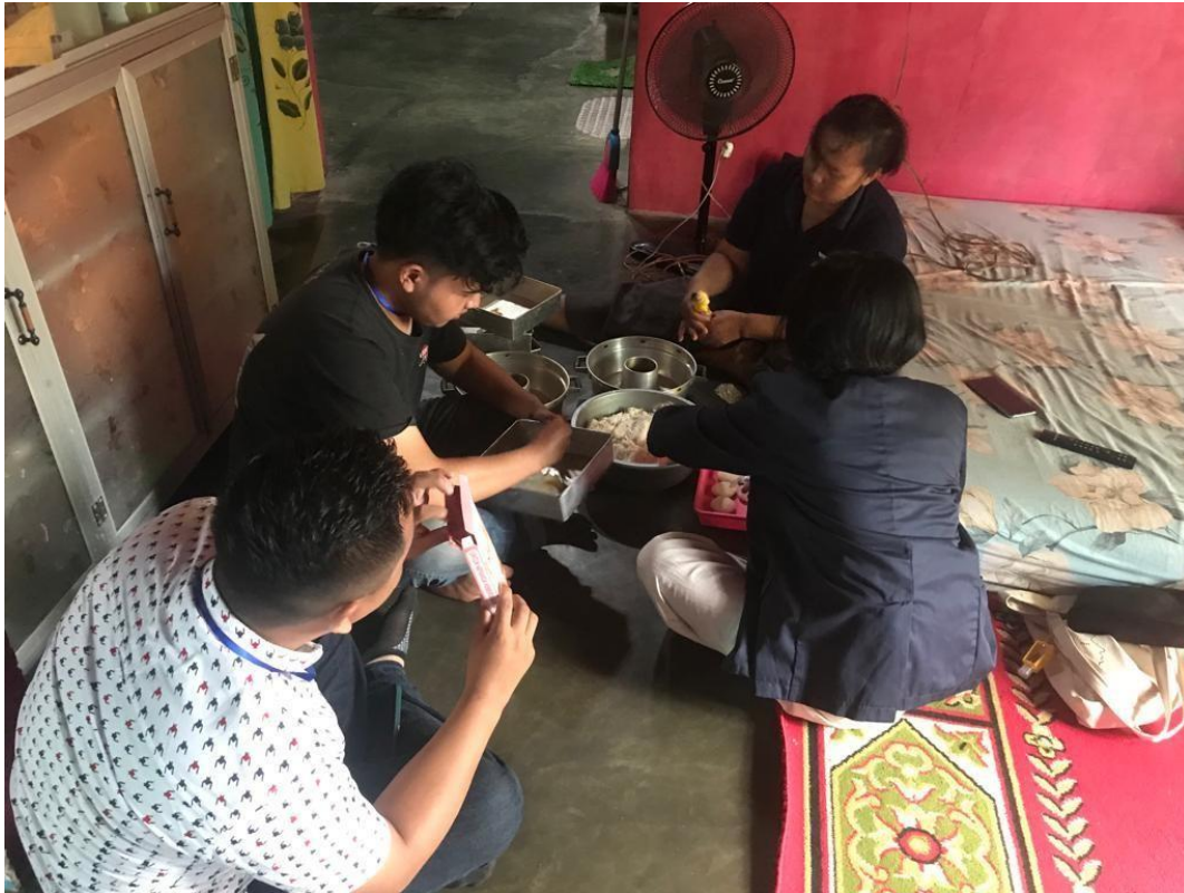
Gambar 2. Pembuatan Kue Wingko Yang Telah Di Upload Pada Sosial Media

2. Pembuatan Kue wingko yang telah di Upload pada Sosial Media Pihak Mahasiswa dilihat Pada Gambar 2.