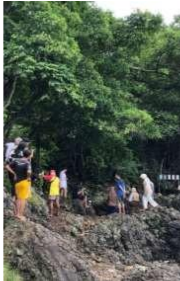
Gambar 2.3 Menjadi Tour Guide Pariwisata Desa Kelawi

Desa Kelawi memiliki berbagai macam wisata seperti pantai minang rua, green canyon, pematang sunrise, air terjun minang rua, goa kelelawar, dan batu alif. Sector pariwisata tersebut dapat meningkatkan perekonomian masyarakat di sekitar desa kelawi maka dari itu sangat penting untuk memperkenalkan wisata kepada pengunjung.