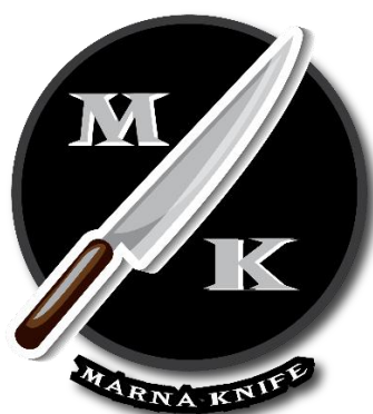
Gambar 2.6 Desain Logo marna knife

Pembuatan Desain Merk dengan menggunakan aplikasi Adobe Illustrator dan Adobe Photoshop. Pembuatan desain Merk pada produk tersebut dengan diberikan nama Merk pemilik usaha dan produk apa saja yang dijual. Desain Merk yang baik dapat mensinergikan dan mengintegrasikan dari beberapa elemen desain dan fungsi kemasan, sehingga dihasilkan kemasan yang memiliki tingkat efektifitas, efesiensi dan fungsi yang sesuai baik dalam produksi kemasan sampai kegunaan kemasan.