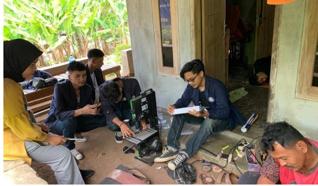
Gambar 2.4 Kegiatan Produksi Pemotongan Kayu