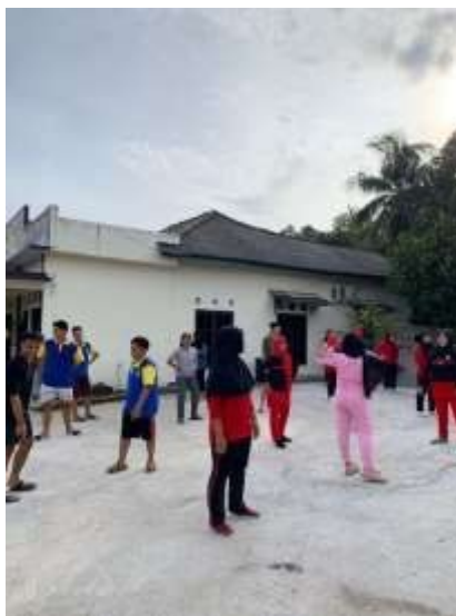
Gambar 2.1. Kegiatan Senam Bersama Masyarakat