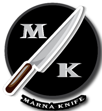
Gambar 2.6 Desain Logo marna knife

Pembuatan Desain Merk dengan menggunakan aplikasi Adobe Illustrator dan Adobe Photoshop. Pembuatan desain Merk pada produk tersebut dengan diberikan nama Merk pemilik usaha dan produk apa saja yang dijual. Desain Merk yang baik dapat menarik dan mengintegrasikan dari beberapa elemen desain dan fungsi kemasan, sehingga dihasilkan kemasan yang memiliki tingkat efektifitas, efisiensi dan fungsi yang sesuai baik dalam produksi kemasan sampai kegunaan kemasan.