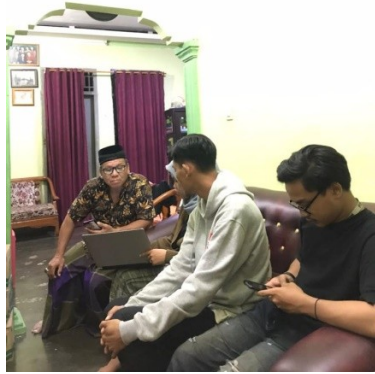
Gambar 2.9 Pengarahan Oleh Kades Untuk Membuat Proposal Bisnis