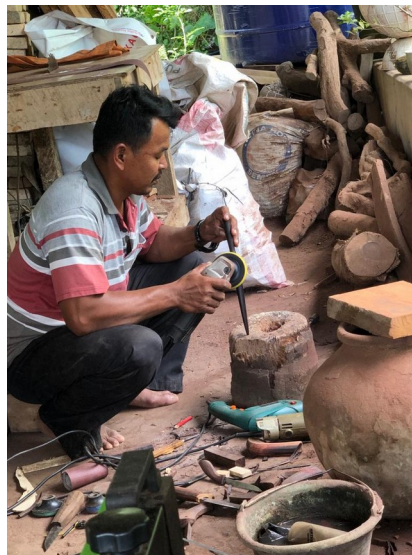
Gambar 2.5 Kegiatan Produksi Pembentukan Sangkur Tongkat Komando