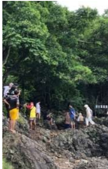
Gambar 2.3 Menjadi Tour Guide Pariwisata Desa Kelawi

Desa Kelawi memiliki berbagai macam wisata seperti pantai minang rua, greencanyon, pematang sunrise, air terjun minang rua, goa kelelawar, dan batu alif. Sektor pariwisata tersebut dapat meningkatkan perekonomian masyarakat di sekitar desa kelawi maka dari itu sangat penting untuk memperkenalkan wisata kepada pengunjung.