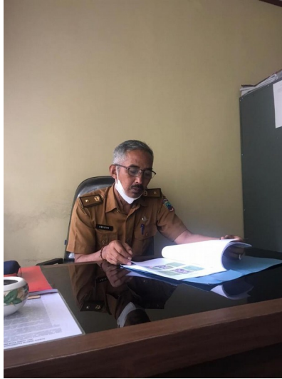
Gambar 2.10 Menyerahkan Proposal Dana Usaha ke Dinas Koperasi Dan UKM