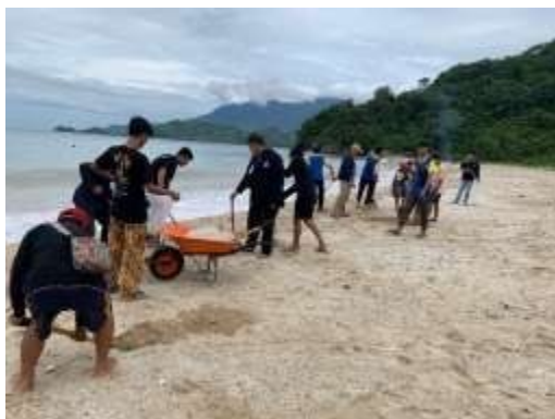
Gambar 2.2 Kegiatan Gotong Royong Di Pantai Minang Rua

Selain melakukan kegiatan senam rutin kami juga membantu masyarakat dengan melakukan kegiatan gotong royong membersihkan sampah di sekitar pantai Minang Rua untuk tetap menjaga kebersihan dan keindahan pariwisata agar pengunjung yang berwisata memiliki kesan yang baik terhadap pantai Minang Rua.