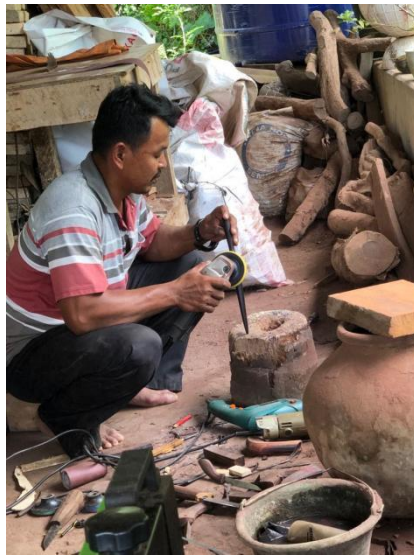
Gambar 2.5 Kegiatan Produksi Pembentukan Sangkur Tongkat Komando