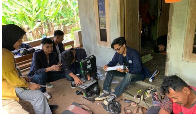
Gambar 2.4 Kegiatan Produksi Pemotongan Kayu