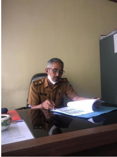
Gambar 2.10 Menyerahkan Proposal Dana Usaha ke Dinas Koprasi Dan UKM