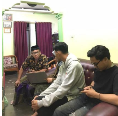
Gambar 2.9 Pengarahan Oleh Kades Untuk Membuat Proposal Bisnis