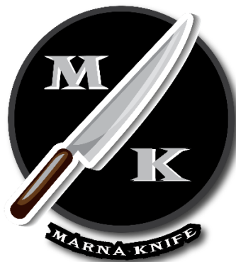
Gambar 2.6 Desain Logo marna knife

Pembuatan Desain Merk dengan menggunakan aplikasi Adobe Illustrator dan Adobe Photoshop. Pembuatan desain Merk pada produk tersebut dengan diberikan nama Merk pemilik usaha dan produk apa saja yang dijual. Desain Merk yang baik dapat mensinergikan dan mengintegrasikan dari beberapa elemen desain dan fungsi kemasan, sehingga dihasilkan kemasan yang memiliki tingkat efektifitas, efesiensi dan fungsi yang sesuai baik dalam produksi kemasan sampai kegunaan kemasan.