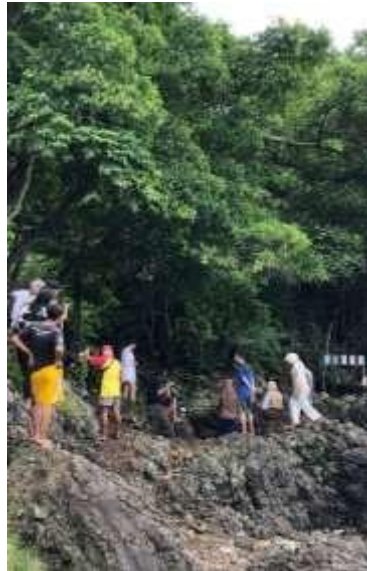
Gambar 2.3 Menjadi Tour Guide Pariwisata Desa Kelawi

Desa Kelawi memiliki berbagai macam wisata seperti pantai minang rua, green canyon, pematang sunrise, air terjun minang rua, goa kelelawar, dan batu alif. Sector pariwisata tersebut dapat meningkatkan perekonomian masyarakat di sekitar desa kelawi maka dari itu sangat penting untuk memperkenalkan wisata kepada pengunjung.