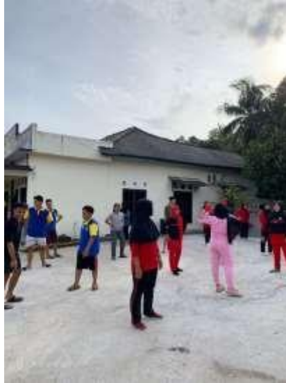
Gambar 2.1. Kegiatan Senam Bersama Masyarakat