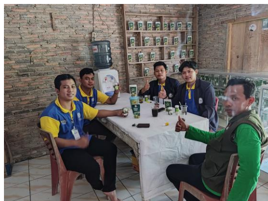
Gambar 2.3 Diskusi Strategi pemasaran bersama Pemilik UMKM

Berdiskusi bersama pemilik UMKM untuk menentukan strategi pemasaran yang bertujuan agar meningkatnya penjualan produk dimasa pandemi Covid-19 melalui pemasaran dengan menggunakan berbagai media sosial. Kegiatan ini dapat dilihat pada Gambar 2.3