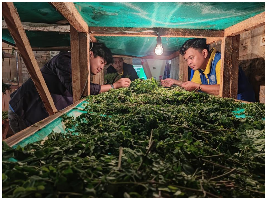
Gambar 2.7 Proses pengeringan daun kelor

Membantu proses pengolahan produk daun kelor mulai dari pemanenan daun kelor, pengeringan daun kelor, penggilingan daun kelor, pengemasan daun kelor, dan pemasaran produk olahan daun kelor. Kegiatan ini dapat dilihat pada Gambar 2.7 dan Gambar 2.8