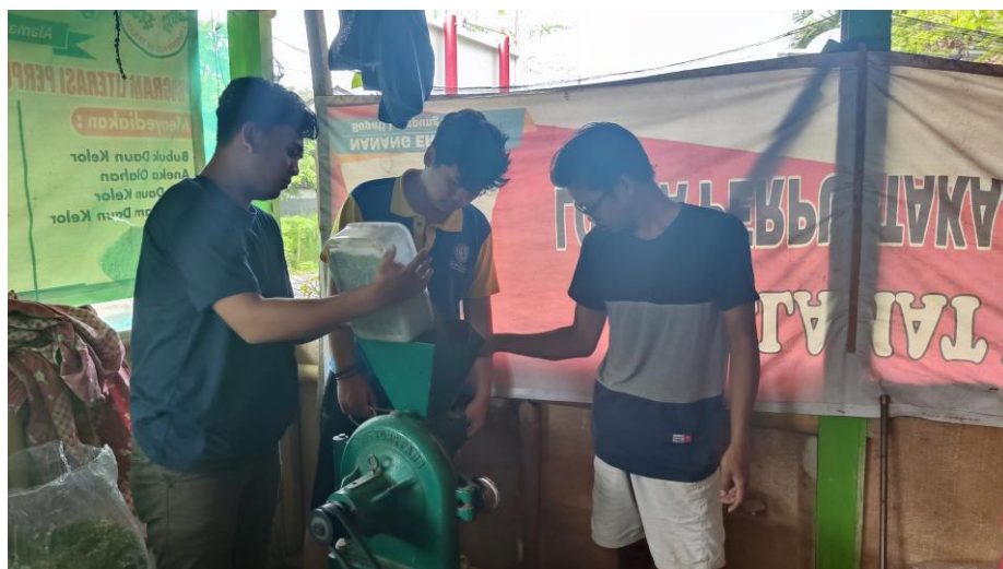
Gambar 2.8 Proses penggilingan daun kelor