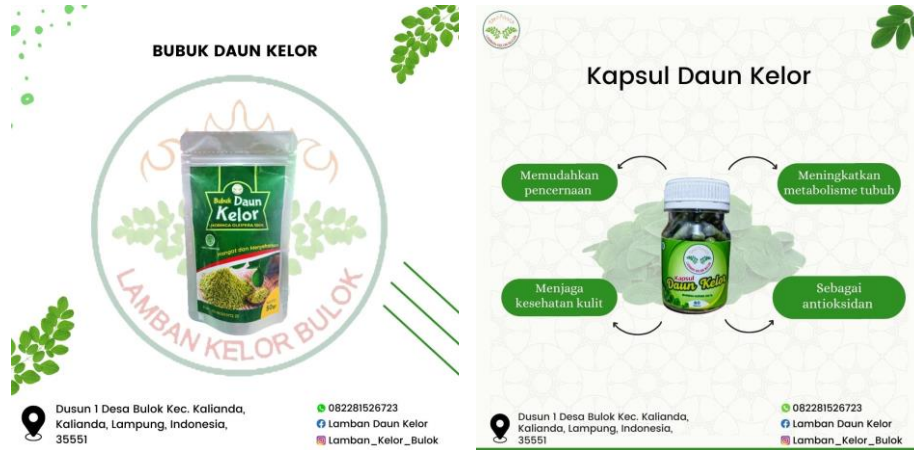
Gambar 2.6 Mendesain Produk Olahan Daun Kelor

Melakukan desain produk yang bertujuan menarik konsumen sehingga dapat meningkatkan penjualan dan memperluas pasar.