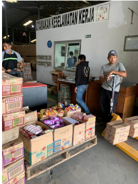
Gambar 4. Pengambilan barang digudang PT Lampung Distribusindo Raya