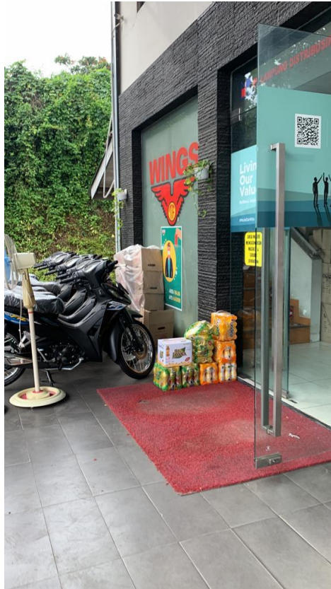
Gambar 2. Kunjungan kerja praktek (KP) di PT. Lampung Distribusindo raya