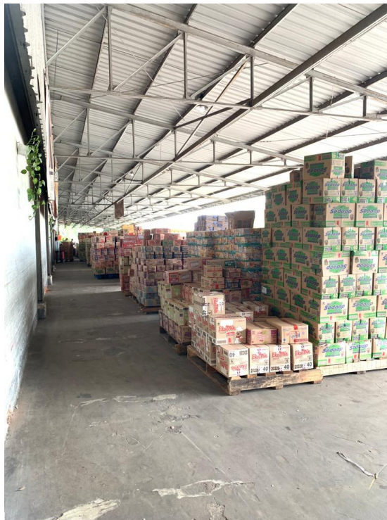
Gambar 3. Persiapan muatan barang