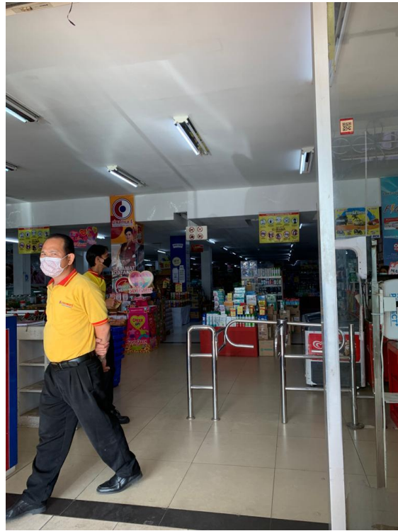
Gambar 6. Kunjungan lapangan ke toko Chamart wayhalim