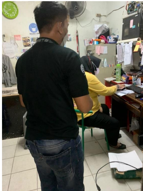
Gambar 7. Proses order