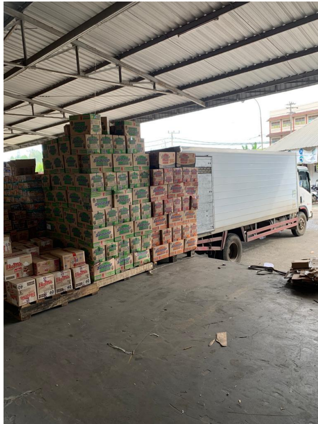
Gambar 3. Proses pengiriman barang