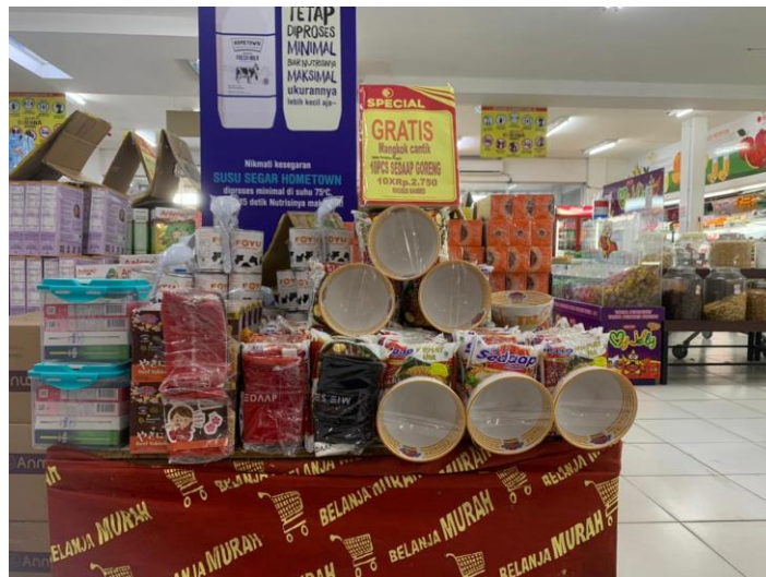
Gambar 5. Support hadiah untuk konsumen