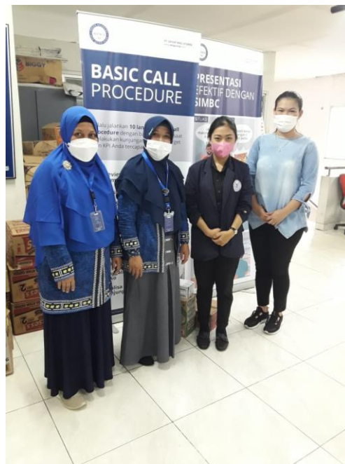
Gambar 1. Pelepasan kerja praktek (KP) di PT. Lampung Distribusindo raya

No. Dokumen : 4FM-SP20331 Revisi : 00 Tgl Berlaku : 04 September 2019