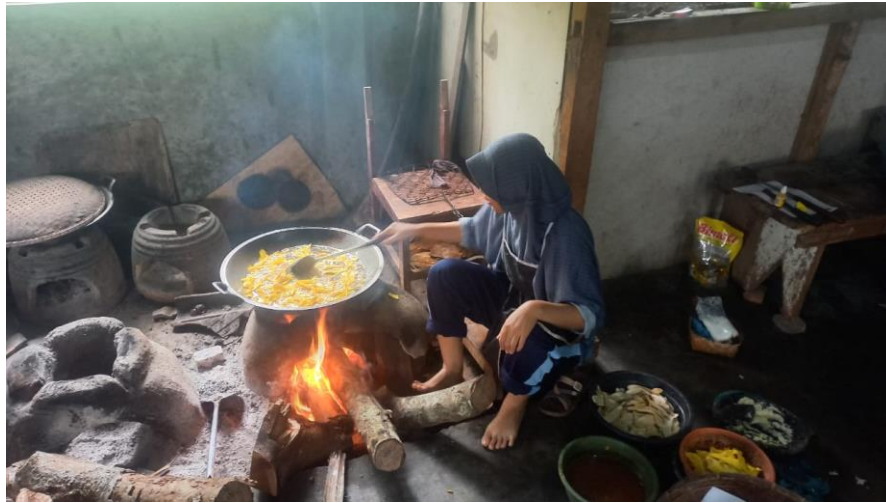
Gambar 7. Proses Pembuatan Keripik Pisang