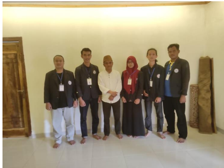
Gambar 2. Foto dengan Pak Kades Merambung