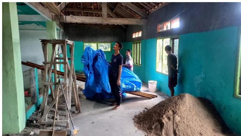
Gambar 11. Kegiatan Gotong Royong