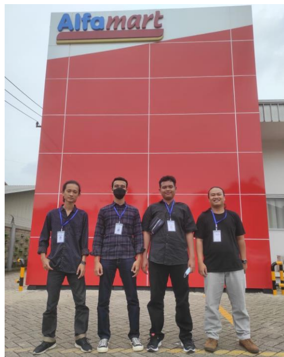
Gambar 4. Kunjungan ke Gudang Alfa