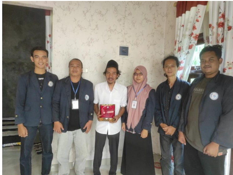
Gambar 12. Penyerahan kenang-kenangan