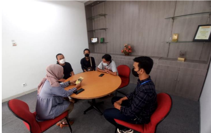
Gambar 5. Penawaran Produk Dano ke Gudang Alfa