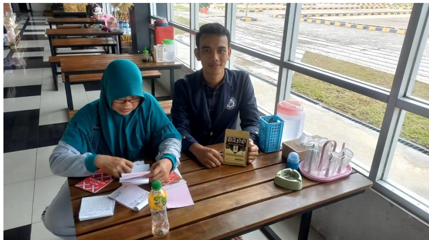
Gambar 6. Pemasaran Produk Dano ke Rest Area Kaliand