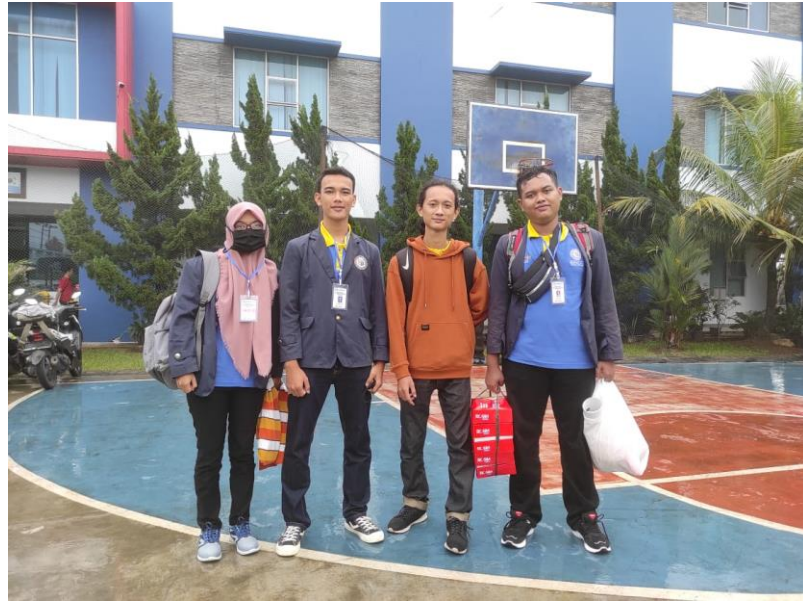
Gambar 1. Persiapan Keberangkatan ke tempat UMKM