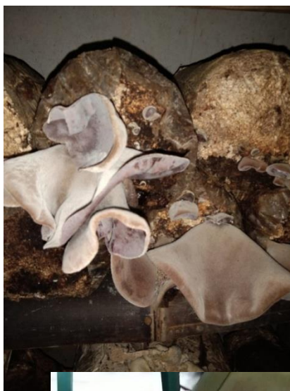
Gambar 8. Pembil... r Kuping