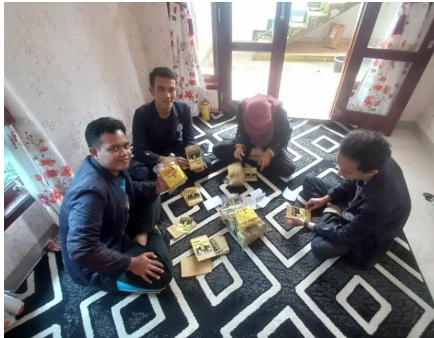
Gambar 9. Proses Pembuatan dan Packing Kopi