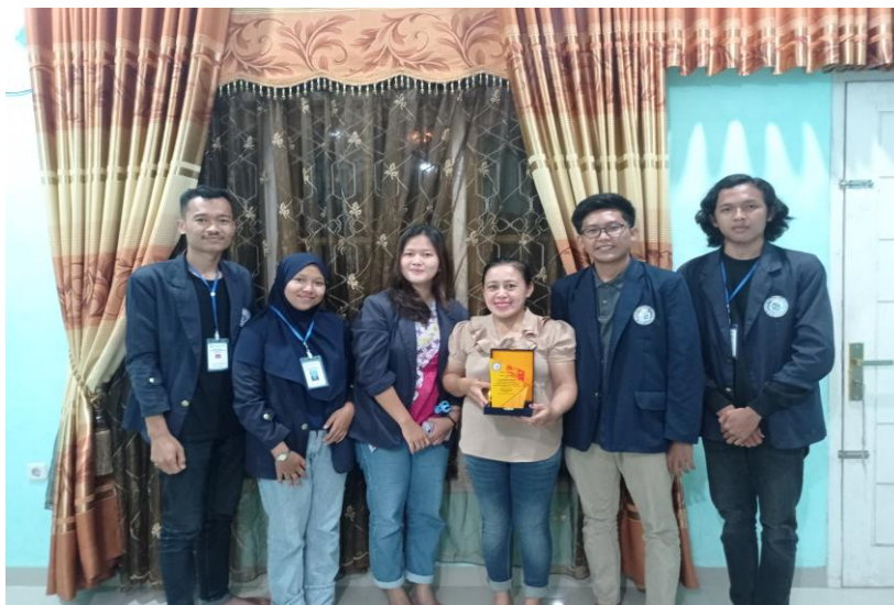
Gambar 7. Penyerahan kenang-kengan dan bermapitan kepada pemilik UMKM