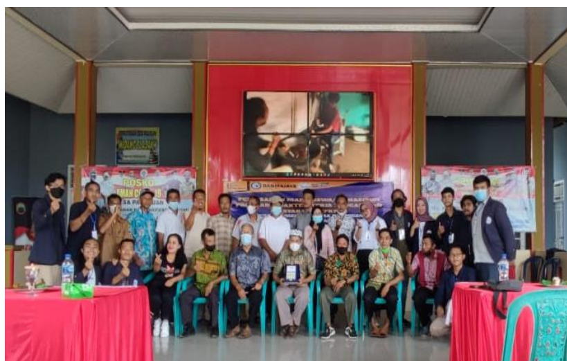
Gambar 8. Penyerahan kenang-kengan dan bermapitan kepada kepala desa Pasuruan