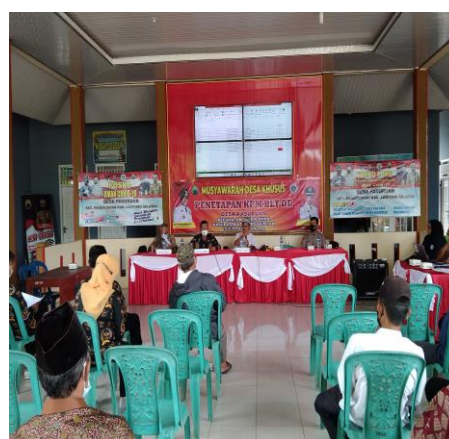
Gambar 6. Membantu acara di balai desa Pasuruan “Penetapan BLT DD”