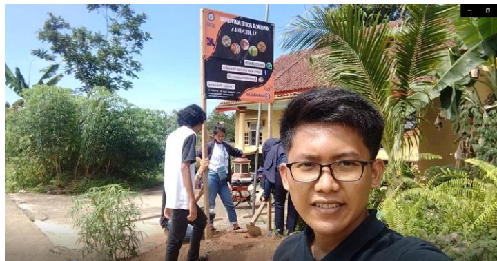
Gambar 3. Pemasangan banner untukUMKM