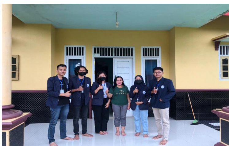
Gambar 5. Perkenalan whatsapp bisnis, facebook, dan website kepada pemilik UMKM