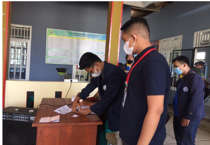
Gambar 2. Membantu kegiatan BANSOS di kantor kepala desa Pasuruan