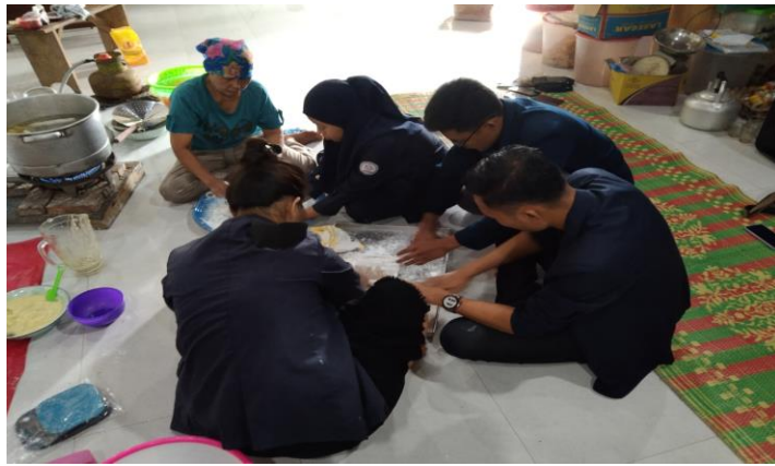
Gambar 1. Membantu UMKM dalam pembuatan empek-empek