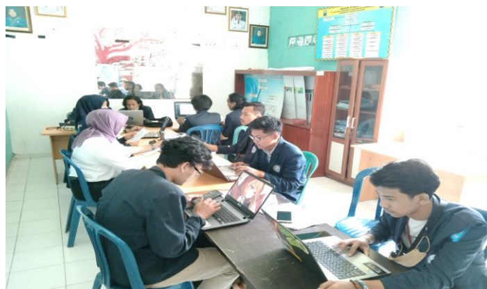
Gambar 4. Inputing data warga desa Pasuruan yang sudah vaksin