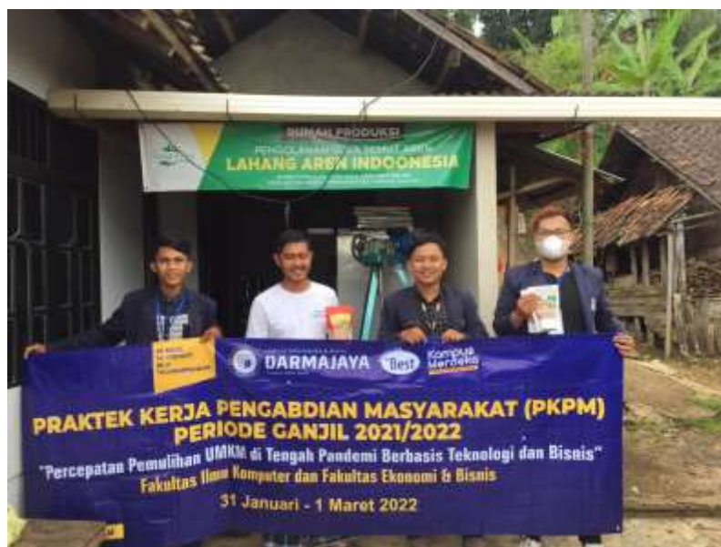
Pemasangan Baner PKPM di lokasi UMKM