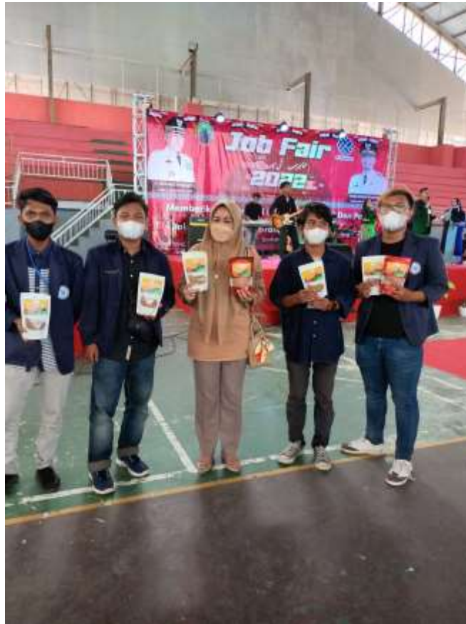
Bazar UMKM pada Job Fair Lampung Selatan 2022