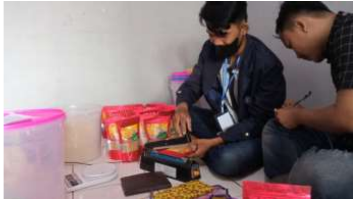
Pengemasan Produk Gula Semut