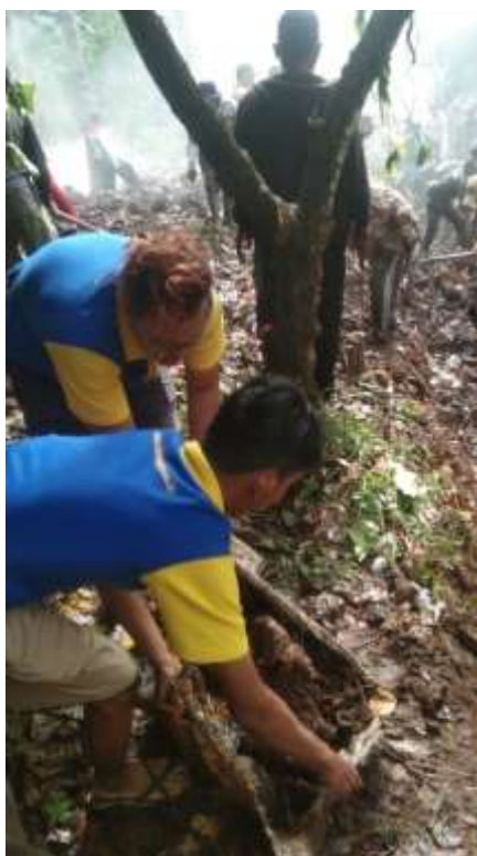
Gotong Royong bersama Warga desa Way Kalam Kecamatan Penengahan