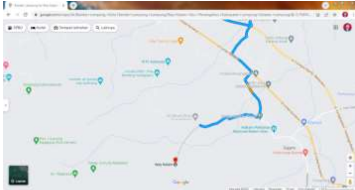
Letak desa way kalam melalui rute google maps