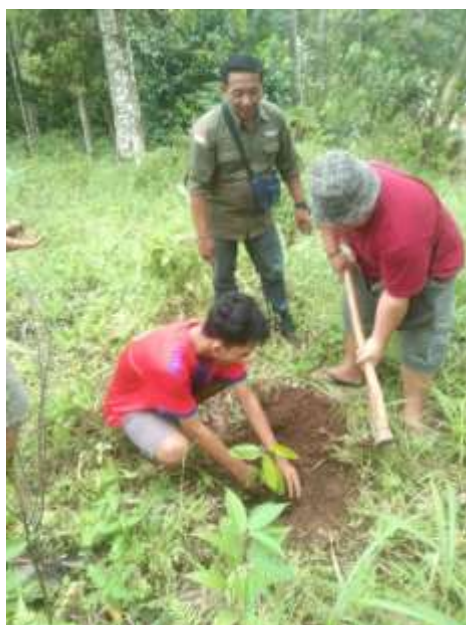
Penanaman bibit pohon bersama dinas Perhutanan Lampung Selatan dan Warga desa Way Kalam Kecamatan Penengahan