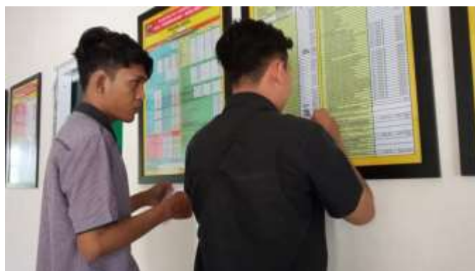
Mengisi Data Penduduk dan Data geografis desa di Balai Desa Way Kalam