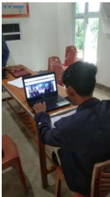
Melengkapi data Warga desa Way Kalam kecamatan Penengahan