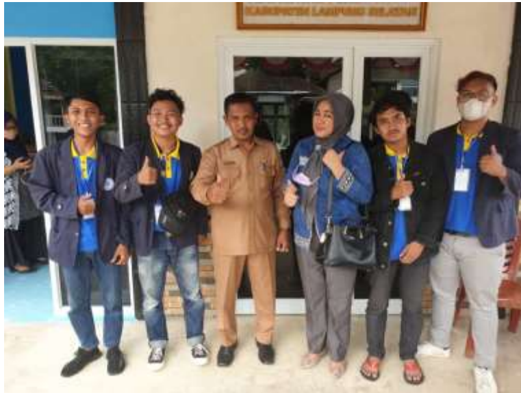
Pengantaran mahasiswa PKPM oleh Dosen Pembimbing Lapangan