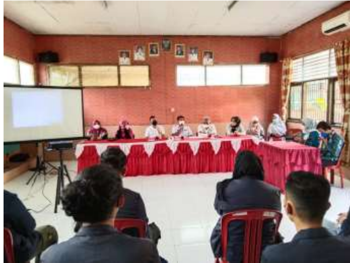
Pelepasan Mahasiswa PKPM di kecamatan Penengahan