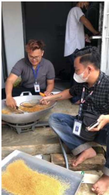
Proses Produksi Gula Semut