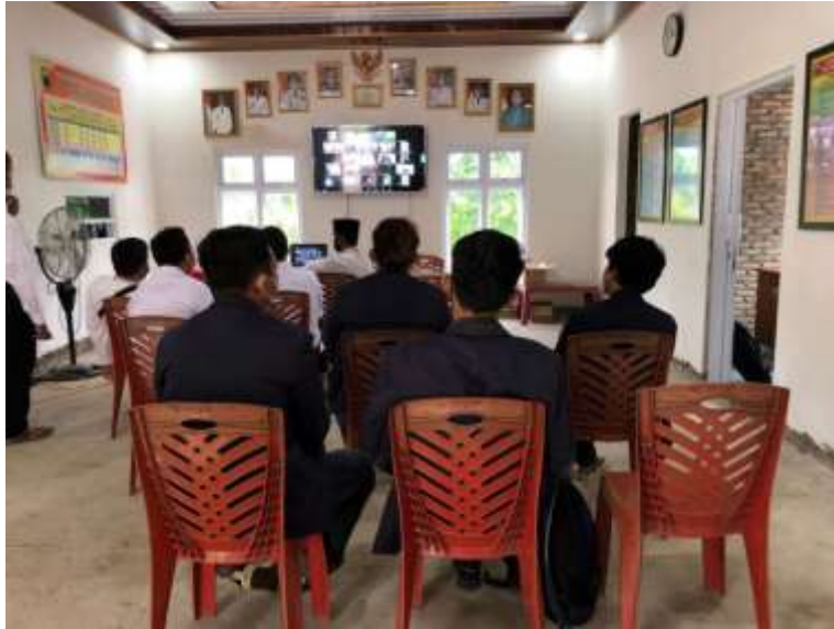
Pengenalan profil desa Way Kalam Kecamatan Penengahan