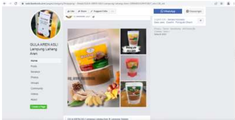
Gambar 2.1 Pembuatan Website, Marketplace, dan Sosial Media sebagai media promosi produk Gula Semut.