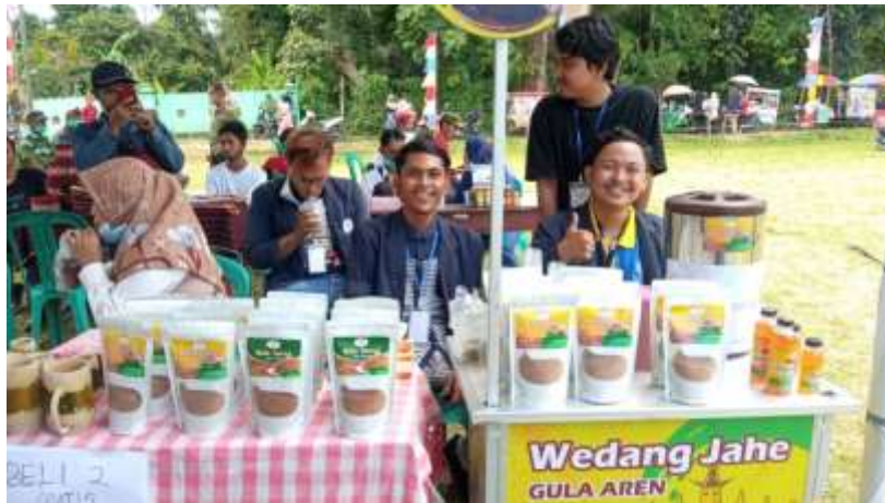
Gambar 2.2 Promosi dan Pemasaran Produk Gula Semut dan Wedang Jahe Gula Aren