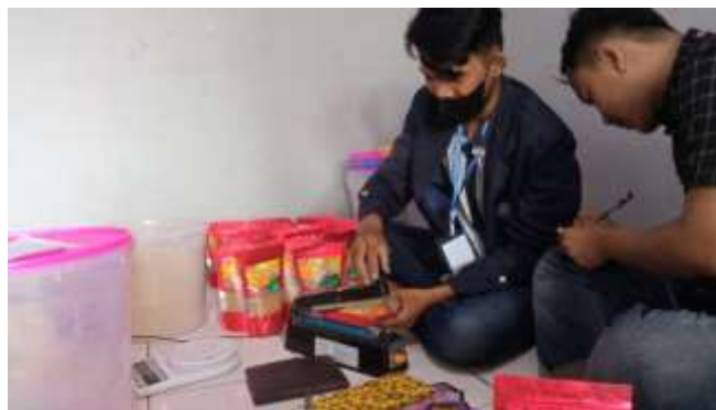
Gambar 2.3 Proses Produksi Gula Semut Dan Wedanng Jahe Gula Aren