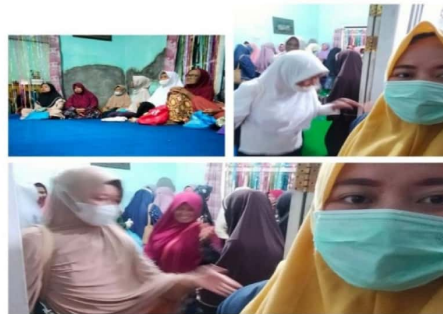
Gambar 2.9 Pengajian Rutin Kelompok Wanita di Desa Kelaten