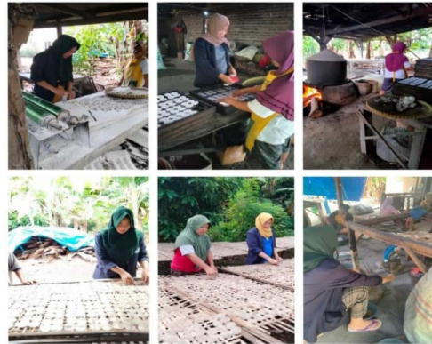
Gambar 2.1 Perkenalan UMKM RIDHO kemplang diDesa Kelaten

UMKM ini termasuk yang berjalan dalam masa pandemi. Kegiatan yang saya lakukan adalah mengunjungi UMKM bapak sulistyono pada kesempatan ini saya memberikan pengenalan teknologi dengan memberi pembekalan tentang aplikasi buku kas yang mengacu pada bidang keuangan hal ini saya lakukan agar dapat membantu sistem pencatatan keuangan semakin baik dan dapat memperlancar usaha yang dijalani oleh beliau.