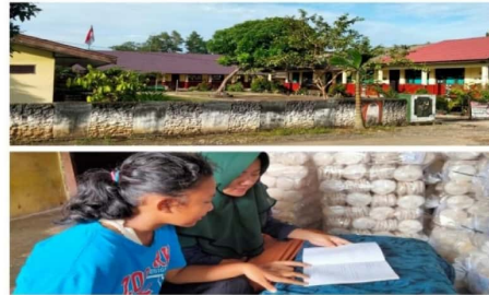
Gambar 2.4 Pembelajaran Daring di Desa Kelaten

Dalam kegiatan ini saya membantu salah satu siswi dalam pengerjaan tugas sekolah secara daring dikarenakan adanya surat edaran tanggal 08 febuari - 22 febuari 2022 sekolah dilaksanakan secara daring.