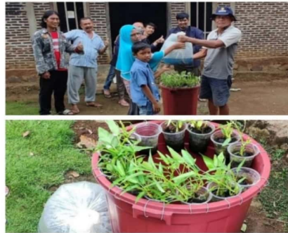
Gambar 2.6 Hibah Kelompok Perikanan Larang Wayah di Desa Kelaten .

Kegiatan yang saya lakukan yaitu mengikuti pemberian simbolis hibah kelompok perikanan larang wayah sebagai bentuk kepedulian penambahan gizi makanan untuk masarakat kurang mampu khususnya anak yatim.