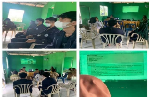
Gambar 2.5 Rapat Penerimaan BLT diDesa Kelaten

Kegiatan yang saya lakukan adalah mengikuti acara tersebut, sekaligus melakukan musyawarah tentang prokja-prokja yang kami dapat dari kampus.