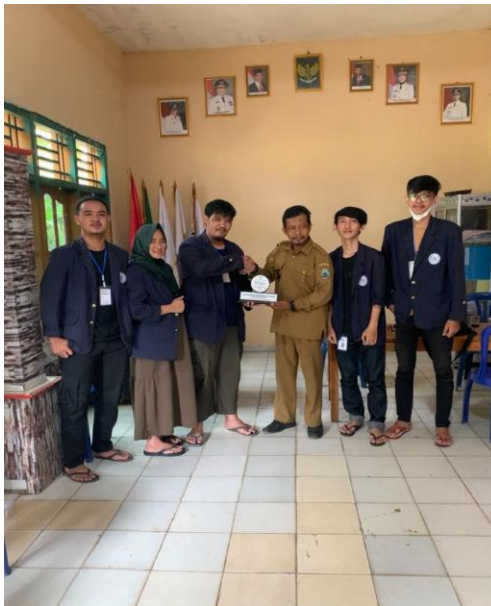
Gambar 2. 11 Perpisahan kepada kepala Desa Klaten

Penyerahan plakat kepada bapak kepala Desa Klaten sebagai tanda terima kasih karena telah menerima mahasiswa PKPM (Praktek Kerja Pengabdian Masyarakat) IIB Darmajaya.