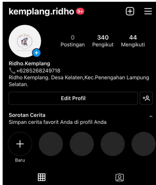
Gambar 2. 13 akun sosial media Ridho Kemplang