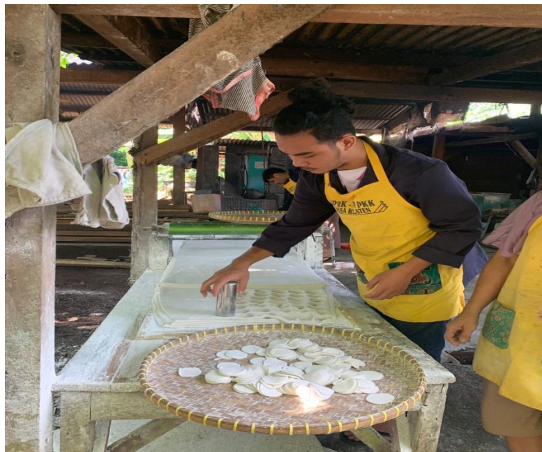
Gambar 2. 5 Proses Mencetak Adonan Kemplang

Adonan yang sudah jadi akan langsung di cetak,setiap cetakan terdiri dari beberapa lapisan agar lebih cepat dan menghasilkan banyak cetakan.