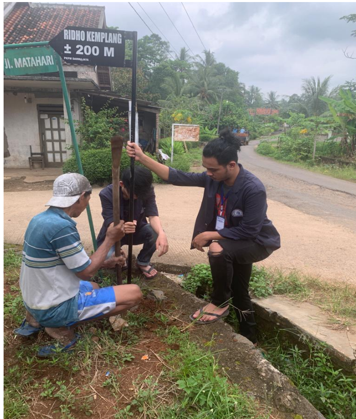
Gambar 2. 8 Memasang Papan Jalan Ridho Kemplang