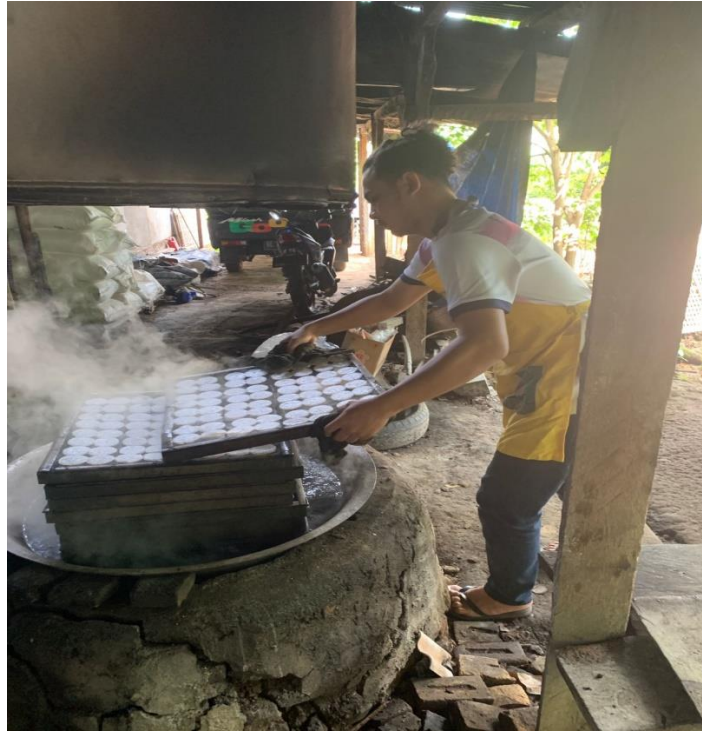
Gambar 2. 6 Proses Mengukus Bangkik