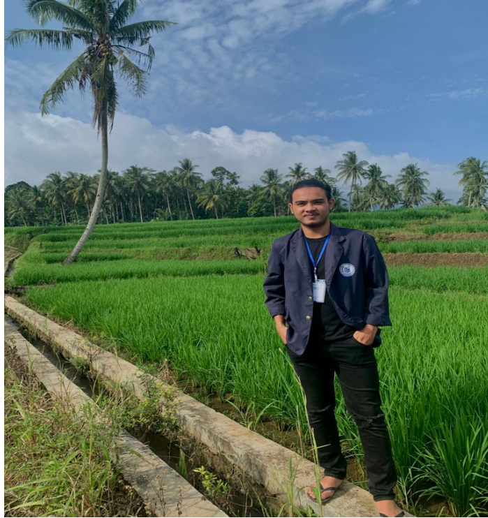
Gambar 2. 9 Membantu Petani di Sawah