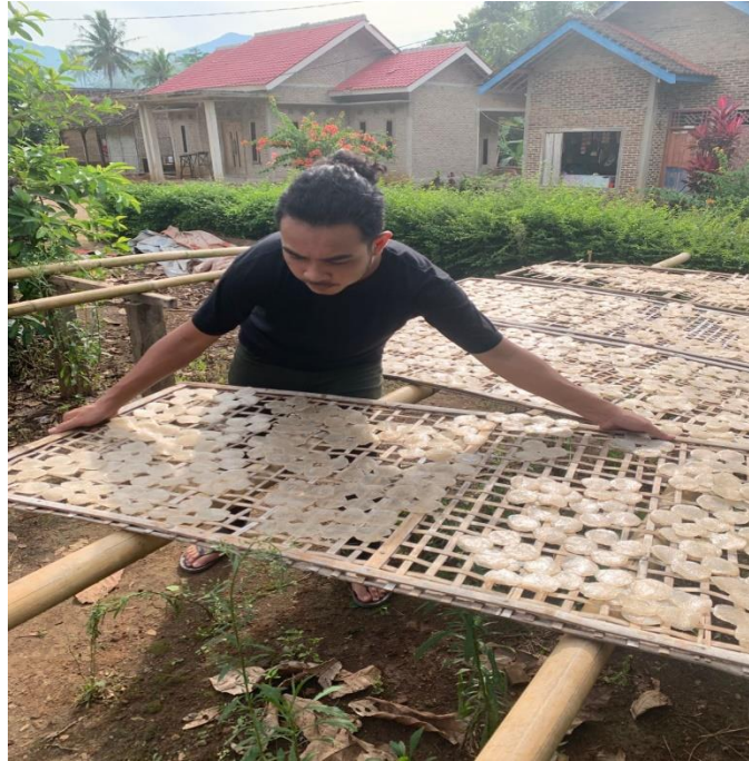
Gambar 2. 7 Proses Penjemuran Bangkik