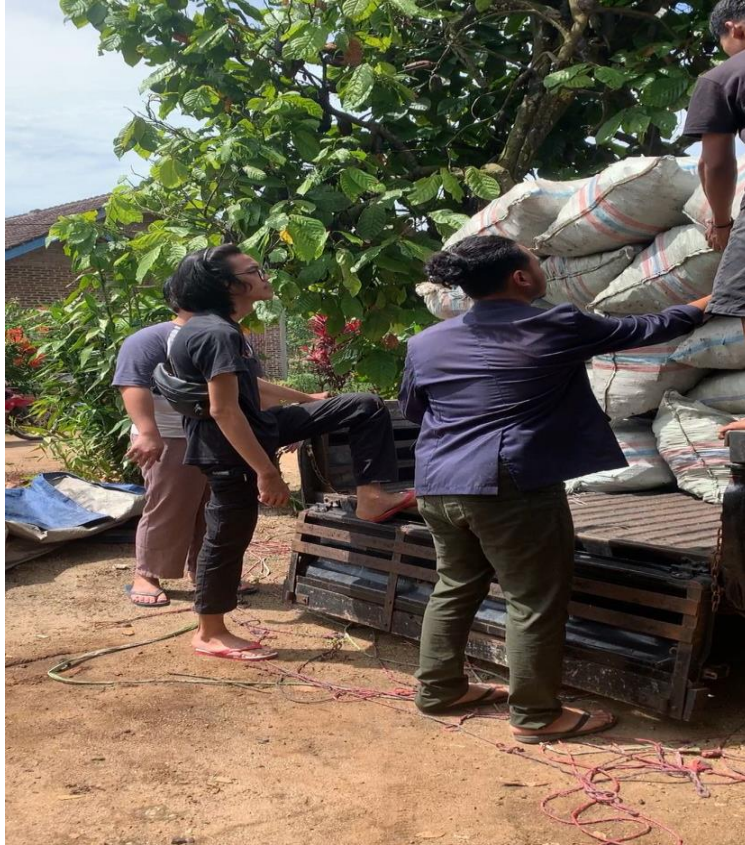
Gambar 2. 2 Mengangkut Arang Dari Kendaraan