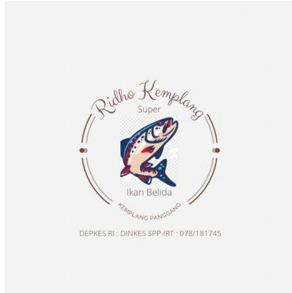
Gambar 2. 10 Pembuatan Inovasi Logo