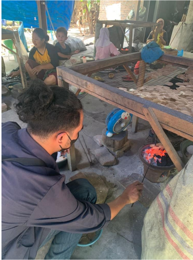
Gambar 2. 3 Proses Memanggang Kemplang