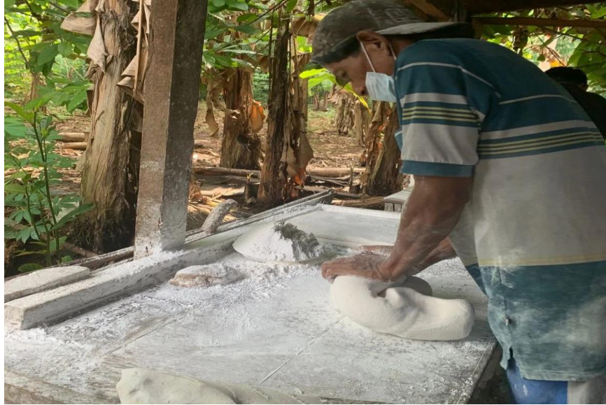
Gambar 2. 4 Membuat Adonan untuk dicetak