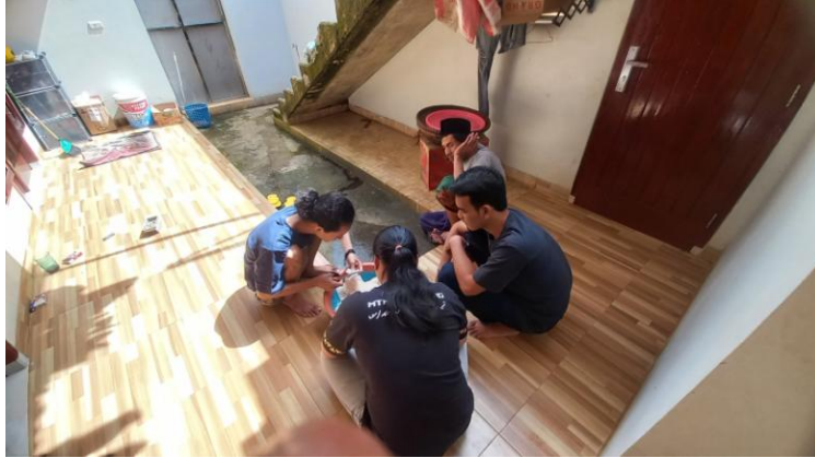
Gambar 4. Berdiskusi dengan Pemilik UMKM

Berdiskusi bagaimana strategi pemilik UMKM agar bisa mempercepat pemulihan penjualan kopi Dano. Kegiatan ini dilakukan pada Rabu, 9 Februari 2022 dapat dilihat pada Gambar 4.