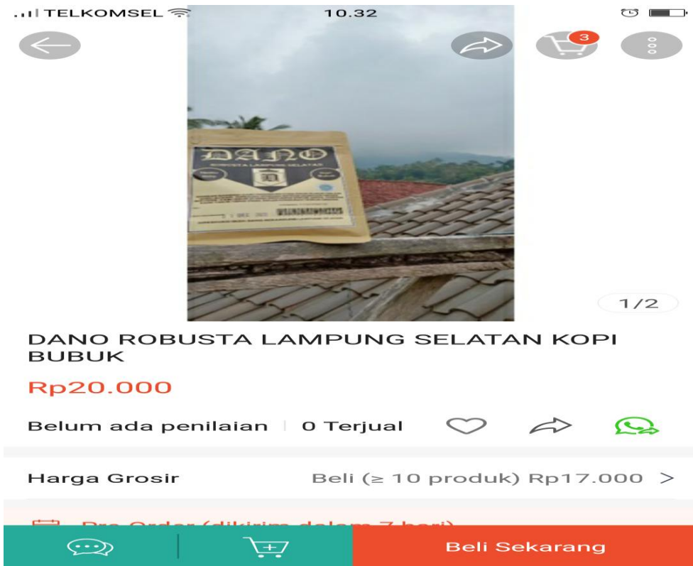
Gambar 6. Membantu mempromosikan kopi melalui media social