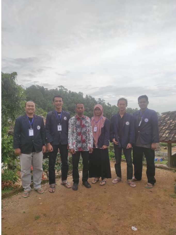
Gambar 2. Foto dengan Kepala Dusun Merambung