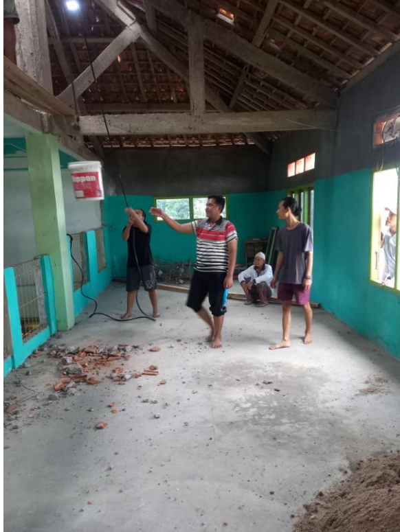
Gambar 7. Membantu Renovasi Masjid