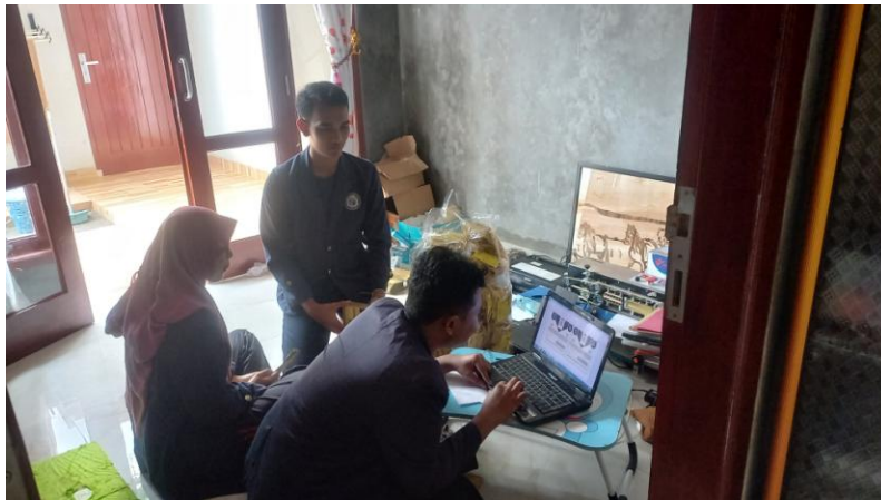
Gambar 5. Membantu mempromosikan Kopi melalui Media Sosial

Membantu mempromosikan Kopi Dano dari berbagai sosial media guna meningkatkan jaringan pemasaran yang lebih luas dan sosialisasi penggunaan aplikasi Facebook. Kegiatan ini dilaksanakan pada Rabu, 2 Februari 2022 dapat dilihat pada Gambar 5.