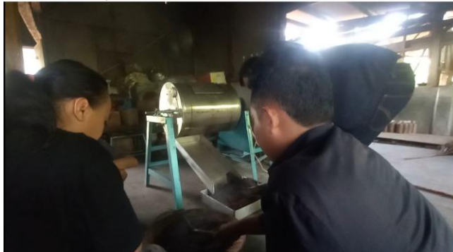
Gambar 6. Membantu Proses Peroastingan Kopi

Membantu proses roasting Kopi dari tahapan memanaskan mesin roasting sampai dengan suhu 180^{\circ}\text{C} , setelah itu baru dimasukkan kopi ke dalam mesin roasting dan suhu mesin roasting akan turun dari 90^{\circ}\text{C} sampai 50^{\circ}\text{C} , dan menunggu sampai suhu sekita 180^{\circ}\text{C} - 190^{\circ}\text{C} baru di reasting hingga 2 jam. Setelah reasting selesai baru digiling menjadi bubuk. Dan baru dikemas atau di packing kegiatan dilaksanakan 9 Februari – 10 Februari 2022 dapat dilihat pada Gambar 6.