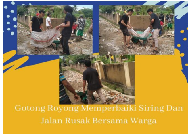
Gambar 2.4 Kebersihan Lingkungan

Lingkungan hidup sebagai kesatuan ruang dengan semua benda, daya, keadaan makhluk hidup, termasuk manusia dan perilakunya, mempengaruhi alam itu.