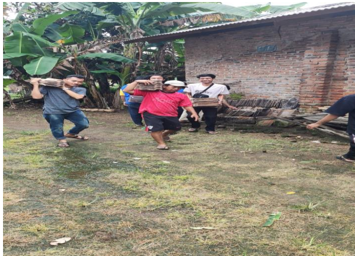
Gambar 2.11 Membantu Rumah Masyarakat yang terkena bencana alam