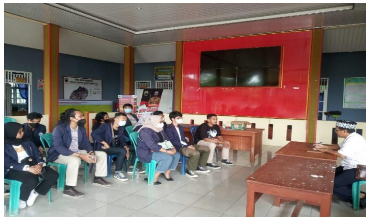
Gambar 2.7 Kunjungan Desa Pasuruan

Berikut gambar dokumentasi yang diambil selama melakukan Praktek Kerja Pengabdian Masyarakat :