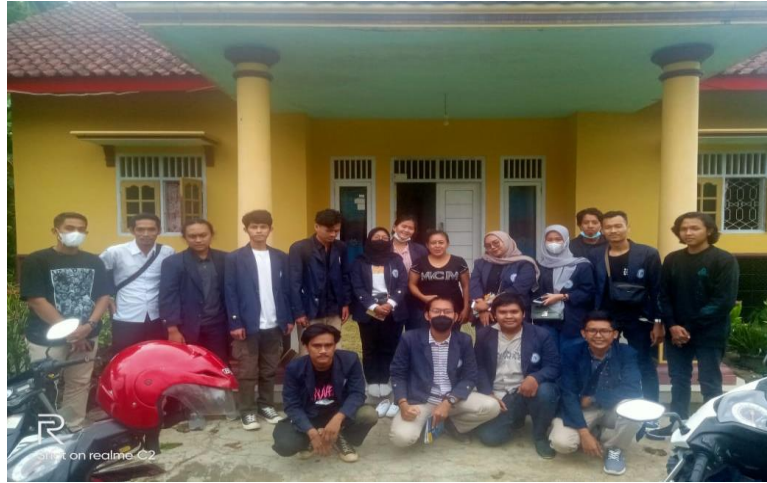
Gambar 2.8 Meminta Izin ke Pemilik UMKM