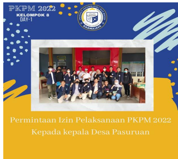
Gambar 2.1 Meminta Izin Pelaksanaan PKPM kepada Kepala Desa

Kunjungan kepada Kepala Desa Pasuruan kecamatan Penengahan Kabupaten Lampung Selatan, meminta izin untuk melaksanakan PKPM di Desa Pasuruan Tanggal 1 Februari 2022 dalam kegiatan membantu UMKM Kue Kering Alrendra dalam memproduksi dan penjualan.