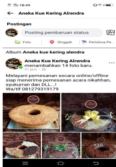
Gambar 2.2 Promosi lewat Marketplace Facebook

Saya menggunakan aplikasi Facebook untuk promosi penjualan di market place produk Aneka Kue Kering Alrendra. Facebook adalah jejaring sosial yang digemari dan menjamur di kalangan masyarakat Indonesia. Fitur ini dihadirkan untuk membantu para pebisnis dalam mempromosikan atau memasarkan produk dan layanan mereka di sosial media Facebook. Dengan adanya Facebook para pengiklan diberikan kebebasan untuk mengelola iklan yang dibuatnya sendiri. Para pengiklan juga dapat memilih format iklan baik itu foto maupun video, tinggal kita sesuaikan saja dengan kebutuhan.