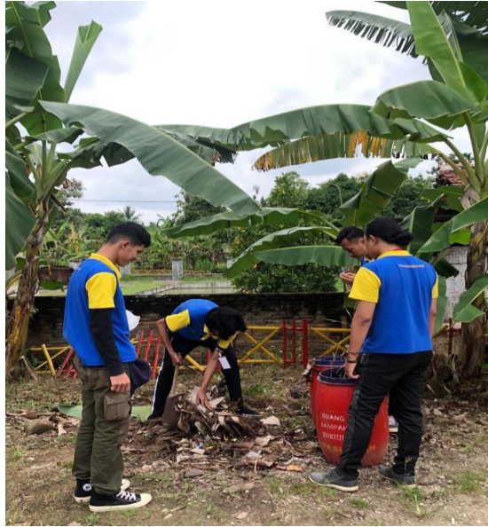
Gambar 2.12 Gotong Royong