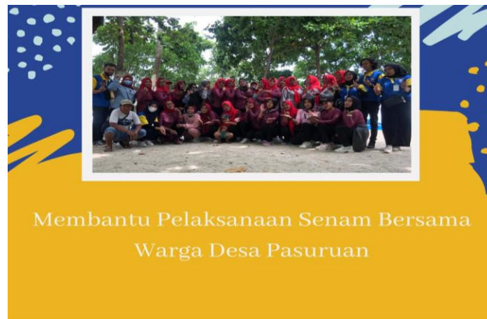
Gambar 2.5 Senam Bersama