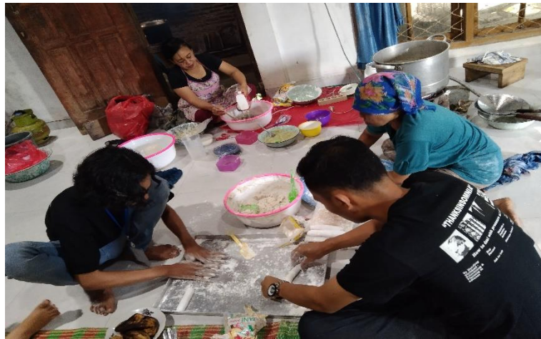
Gambar 2.9 Proses Pembuatan Kue Kering