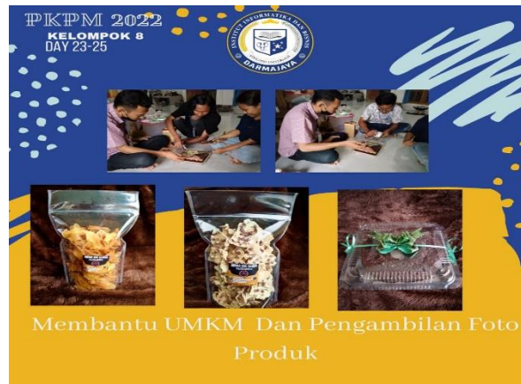
Gambar 2.3 Foto Produk

Dalam mempromosikan menggunakan foto produk Aneka Kue Kering dengan foto produk menarik maka para konsumen lebih melirik produk makanan yang kita sedang promosikan. Di karenakan kemanasan yang rapih dan yang menarik daya jual semakin meningkat.