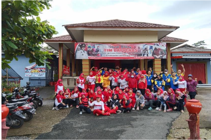
Gambar 2.10 Senam Bersama Masyarakat Desa Pasuruan