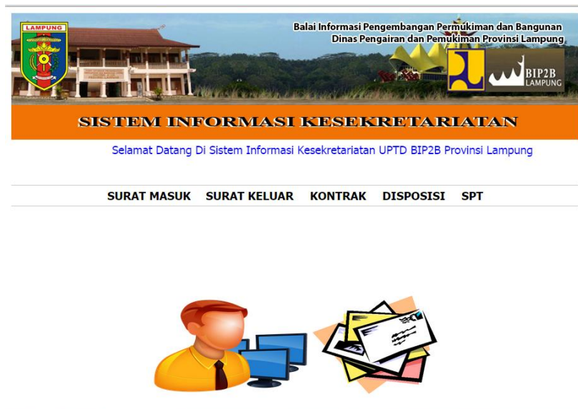
Gambar 4.1 Tampilan Halaman Menu Utama