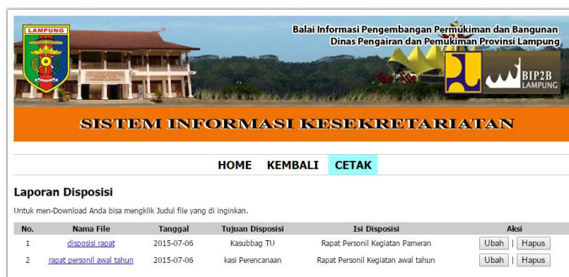
Gambar 4.13 Tampilan Halaman Sub Menu Lihat Dokumen Disposisi

Halaman ini merupakan halaman yang berfungsi untuk melihat data disposisi yang telah tersimpan dalam sistem dan berfungsi juga sebagai halaman manipulasi data. Tampilan halaman lihat dokumen disposisi ini dapat dilihat pada gambar 4.13 berikut ini: