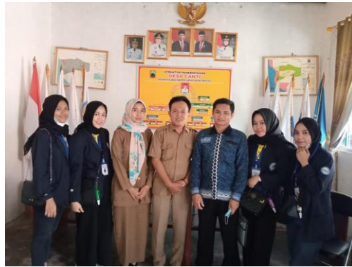
Gambar 1.1 Serah terima kepada Pihak Desa Canti

Selama PKPM agar berlangsung berjalan dengan baik atas dukungan RT pemda wayhui saya mengunjungi Balai desa Canti yang terletak di jl.Pesisir desa canti RT.02 Dusun 1 Desa canti Kecamatan Rajabasa dan menyerahkan surat izin pelaksanaan PKPM dan meminta arahan dan dukungan.