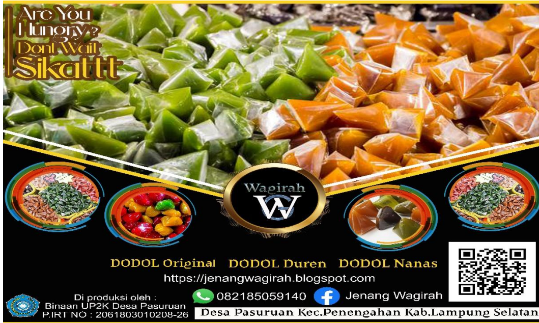
Gambar 2.3 Hasil desain pamflet

Desain pamflet yang akan dijadikan ciri khas packaging dalam produk Jenang Wagirah, agar dapat menarik lebih banyak pelanggan dari pemasaran sebelumnya, bisa dilihat pada gambar 2.3