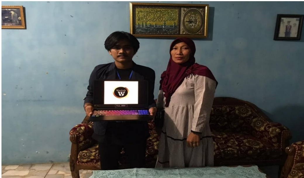
Gambar 2.2 Penyerahan desain logo kepada pemilik UMKM

Logo akan membantu konsumen mengingat produk UMKM Jenang Wagirah lebih mudah, bisa dilihat pada gambar 2.1