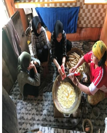
Pengorengan & Pengirisan