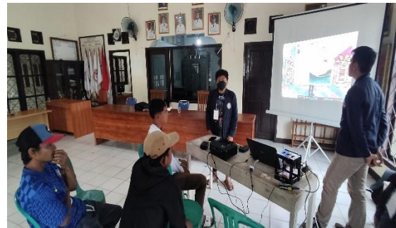
Gambar 2.3 Materi Bisnis Digital