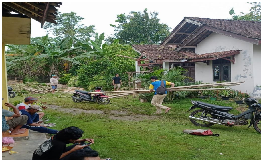
Gambar 2.12 Kegiatan gotong royong.