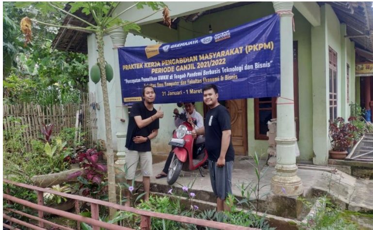
Gambar 2.10 Pemasangan Benner PKPM.