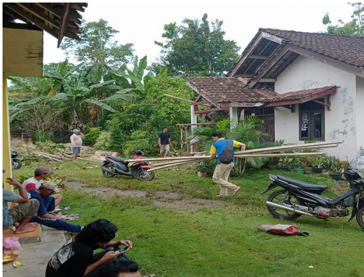
Gambar 2.3 Gotong royong

Gotong royong ini di lakukan Pada tanggal 10,13,26 Februari 2022 bersama masyarakat desa pasuruan untuk membantu membersihkan area balai desa,memperbaiki jalan yang sudah rusak dan membantu memperbaiki rumah warga yang tertimpa pohon akibat cuaca hujan dan angin kencang. Dengan adanya kegiatan ini dapat menimbulkan rasa saling tolong menolong dan kebersamaan masyarakat desa pasuruan.