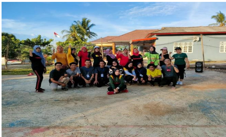
Gambar 2.4 Senam Bersama Masyarakat Desa Pasuruan

Senam bersama yang dilakukan pada tanggal 11-12 Februari 2022 bersama ibu-ibu desa Pasuruan yang bertujuan untuk menjaga kesehatan jasmani