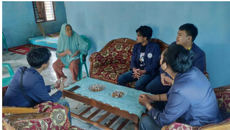
Gambar 2.1 Kunjungan UMKM Jenang Wagirah

Kunjungan yang dilakukan ke UMKM adalah bertujuan untuk mengetahui bagaimana usaha Jenang Wagirah sekaligus mempelajari Teknik cara pembuatan dodol yang benar dan membantu kegiatan yang ada disana seperti Membuat dodol dan jenang . tak hanya itu kita juga berdiskusi dengan pemilik usaha apa saja yang menjadi hambatan dalam menjalankan usaha tersebut. Dari hasil diskusi ini kita dapat menemukan inovasi inovasi baru yang dapat menunjang UMKM agar lebih banyak di gemari masyarakat sekitar ataupun luar daerah , hasil inovasi yang kita rancang yaitu dari segi pemasaran memanfaatkan jejaring media social dan blogspot sebagai sarana media pemasaranan, dan juga dari segi pengemasan kita buat menjadi lebih menarik dari yang sebelumnya