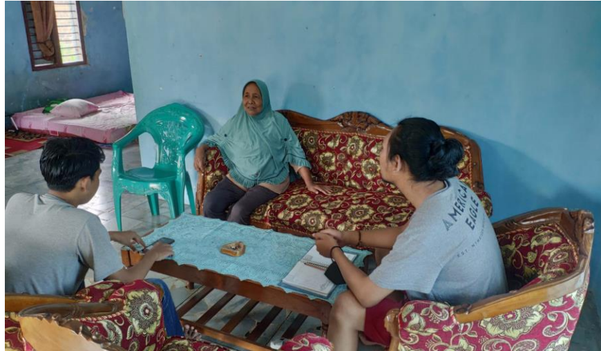
Gambar 2.15 interview pemilik UMKM jenang wagirah.