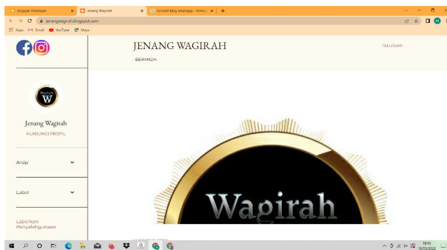
Gambar 2.6 tampilan Blogspot Jenang Wagirah

Berikut tampilan Blogspot UMKM Jenang Wagirah yang ada di desa pasuruan