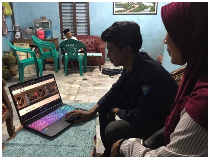
Gambar 2.2 Menjelaskan Isi tampilan Blogspot

Proses pembuatan Blogspot di lakukan pada tanggal 14 februari dengan mengisi deskripsi produk ,foto produk ,facebook , Instagram, google maps dan juga nomor whatsapp sebagai media pemesanan, pembuatan blogspot di lakukan untuk mempermudah UMKM mendapatkan calon konsumen dan juga konsumen dapat mengetahui apa saja bahan bahan yang di gunakan serta proses pembuatan jenang tersebut Kemudian setelah proses pembuatan blogspot tersebut selesai pada tanggal 28 februari kita serahkan kepada pemilik UMKM dan siap untuk di gunakan