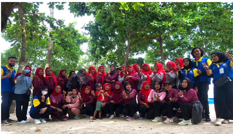
Gambar 2.14 Senam bersama ibu-ibu desa pasuruan.