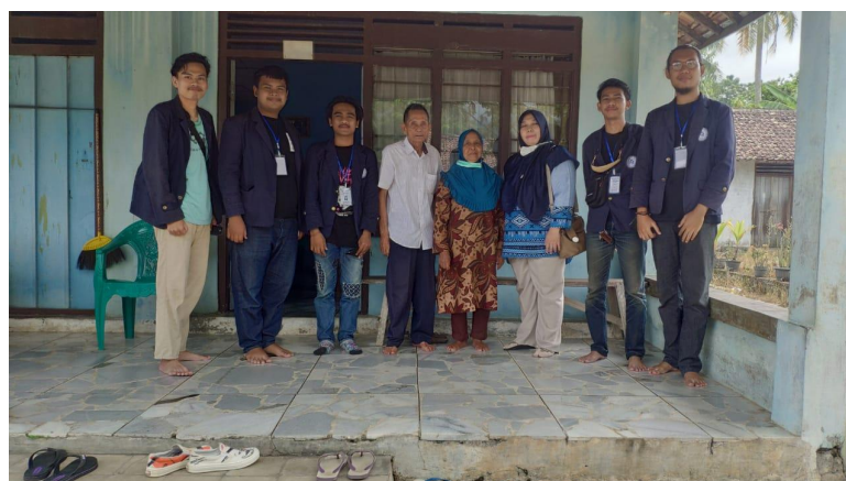
Gambar 2.9 Kunjungan ke UMKM Jenang Wagirah