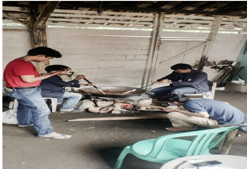
Gambar 2.11 pembuatan Jenang .