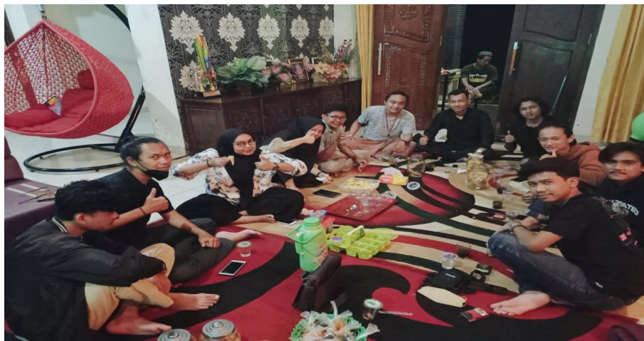
Gambar 2.13 Silaturahmi ke rumah kepala desa pasuruan.