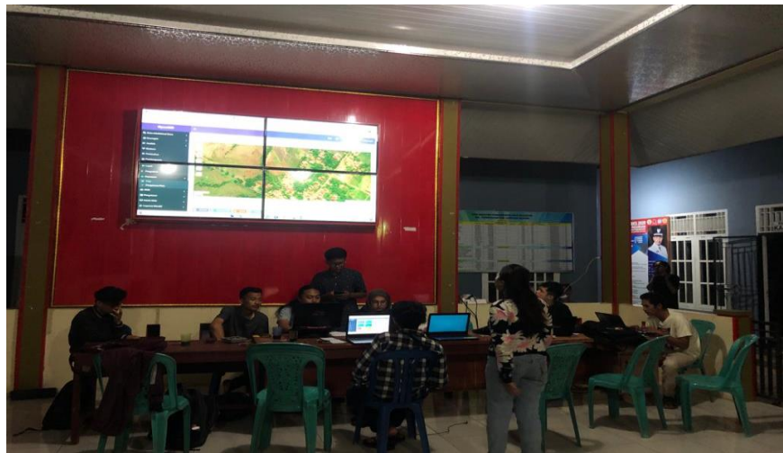
Gambar 2.16 Proses penginputan data hasil pendataan rumah UMKM ke dalam web desa