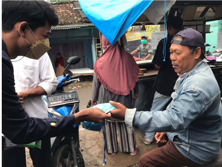
Gambar 2.5 Bagi Bagi masker

Bagi bagi masker ini bertujuan untuk mengurangi penyebaran covid 19 yang ada di desa pasuruan, Pembagian masker ini Bersama dengan aparaturnya desa pasuruan dan kecamatan penengahan