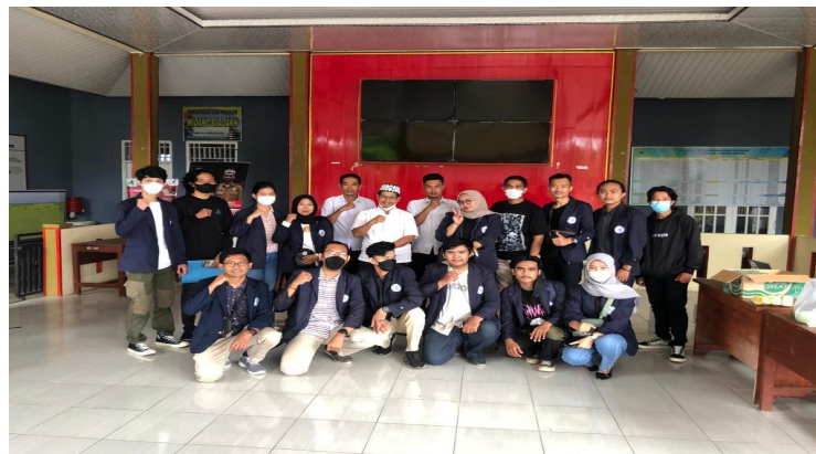
Gambar 2.8 Kunjungan Desa Pasuruan.

Berikut gambar dokumentasi yang diambil selama melakukan Praktek Kerja Pengabdian Masyarakat di Desa Pasuruan :