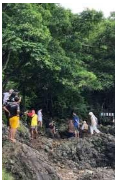
Gambar 2.3 Menjadi Tour Guide Pariwisata Desa Kelawi

Desa Kelawi memiliki berbagai macam wisata seperti pantai minang rua, green canyon, pematang sunrise, air terjun minang rua, goa kelelawar, dan batu alif. Sector pariwisata tersebut dapat meningkatkan perekonomian masyarakat di sekitar desa kelawi maka dari itu sangat penting untuk memperkenalkan wisata kepada pengunjung.