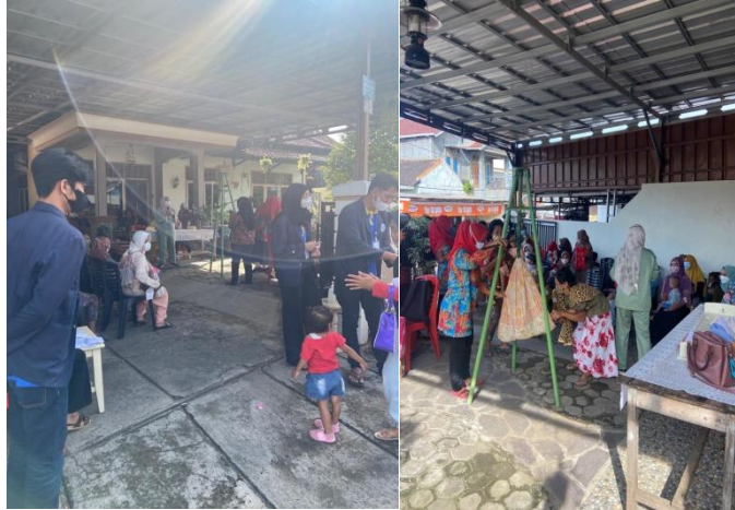
Gambar 4 Pelaksanaan posyandu