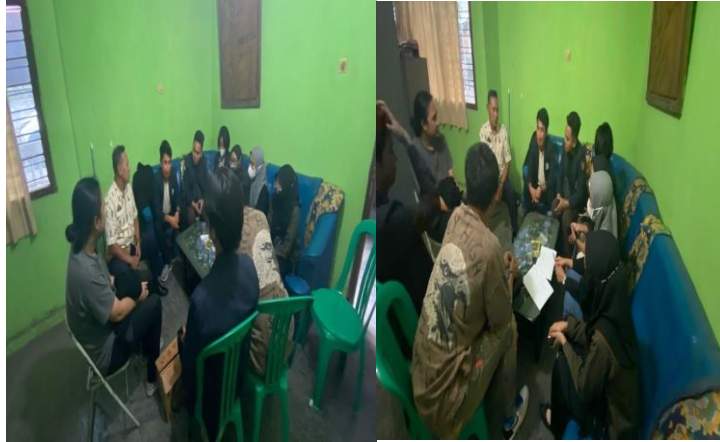
Gambar 1 Perizinan kepada RT/RW/Kelurahan