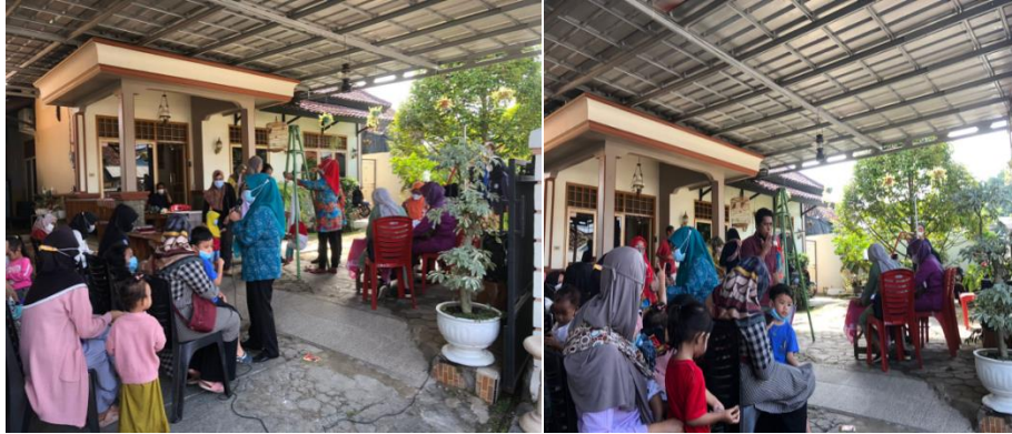
Gambar 2 Memberikan edukasi kepada masyarakat mengenai Covid-19