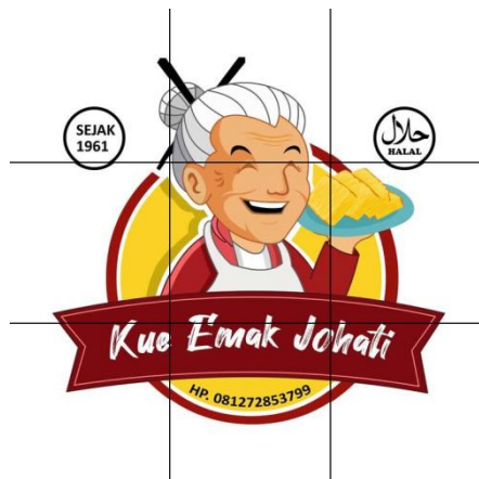
Gambar 13 Pembuatan logo UMKM