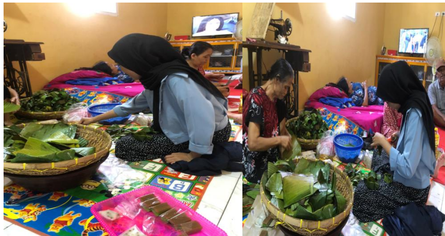
Gambar 7 pembuatan takir