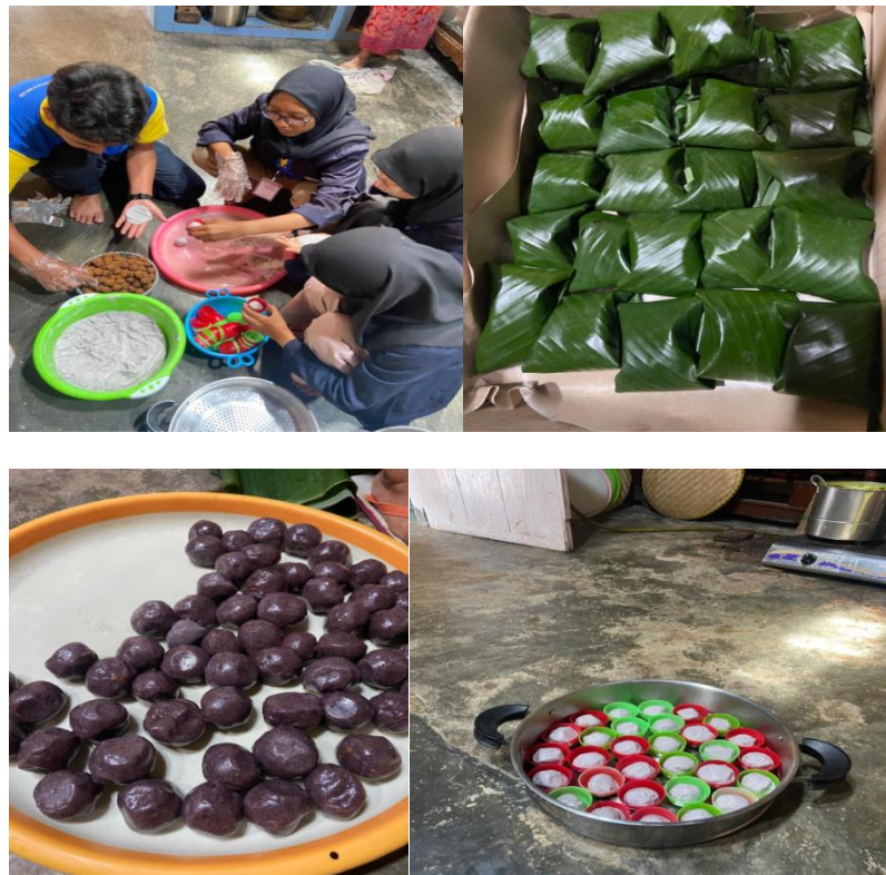
Gambar 9 Pembuatan kue Bugis

Kue berbahan dasar ketan dengan isian unti kelapa manis ini adalah jajanan pasar yang mudah ditemukan. Meski mirip dengan kue mendut di Jawa, kue ini dipercaya berasal dari Sulawesi selatan atau daerah di mana suku Bugis berasal, sesuai dengan namanya.