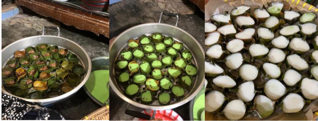
Gambar 8 Proses pembuatan kue jojorong