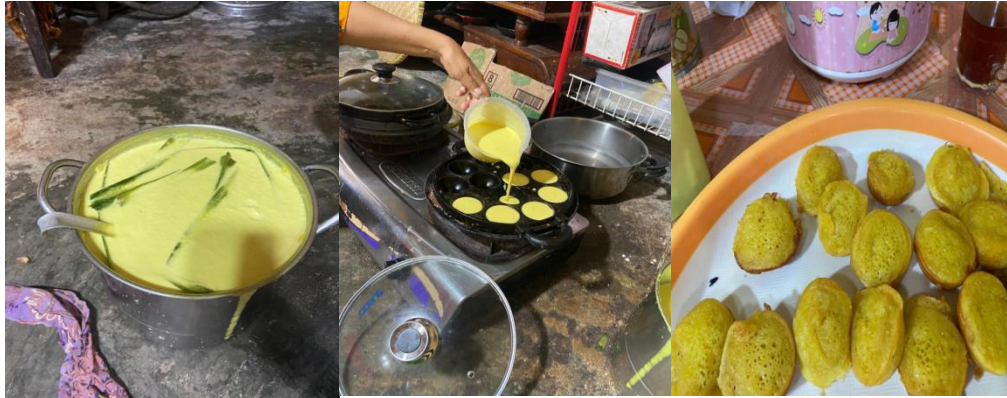
Gambar 10 Pembuatan Bika Ambon

Jajanan tradisional khas Medan dengan tekstur berserat, berwarna kuning dan aroma daun jeruk yang khas. Dimasak dengan cara dikukus