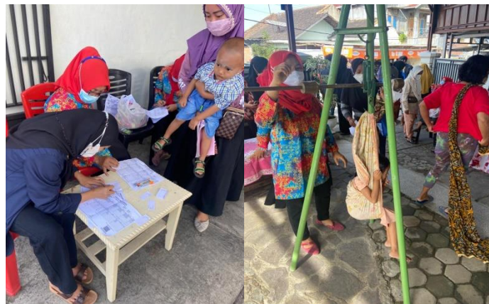
Gambar 3 Pendataan anak-anak yang belum terdaftar dalam posyandu

Program kemasyarakatan yang di adakan di desa Sukajaya adalah salah satunya Posyandu, Posyandu (Pos Pelayanan Terpadu) merupakan upaya pemerintah untuk memudahkan masyarakat dalam memperoleh pelayanan kesehatan ibu dan anak. Tujuan utama posyandu adalah pencegah peningkatan angka kematian ibu dan bayi saat kehamilan, persalinan atau telah melalui pemberdayaan masyarakat