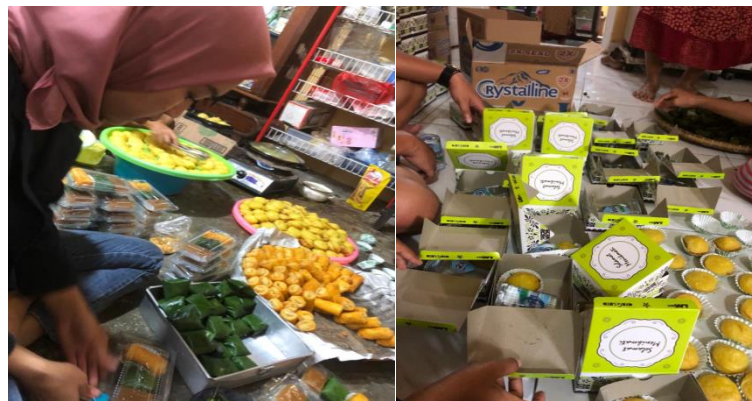
Gambar 11 pengemasan kue