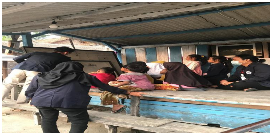
Gambar 6 mengajarkan anak-anak mengaji