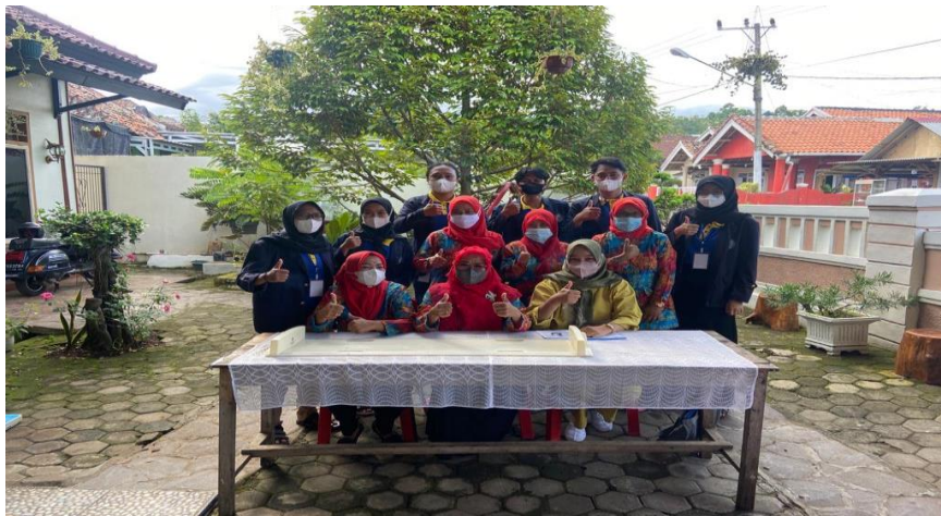
Gambar 5 foto bersama pengurus posyandu