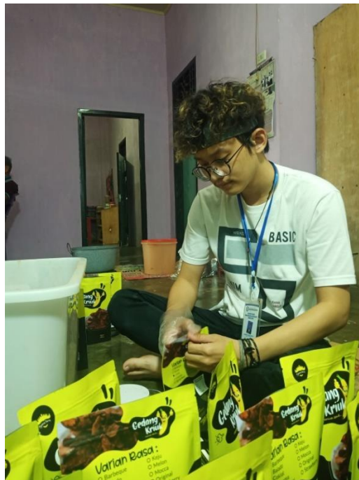
Gambar 7 : Proses Pengemasan