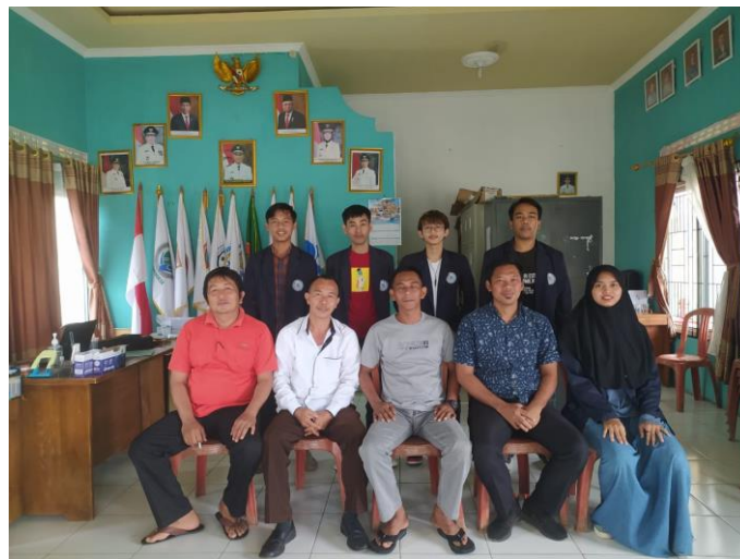
Gambar 4 : Kunjungan ke Desa Kekiling

Berikut gambar dokumentasi yang diambil selama melakukan Praktek Kerja Pengabdian Masyarakat :