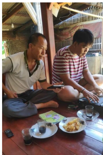
Gambar 10 : Pengembangan Smartvillage