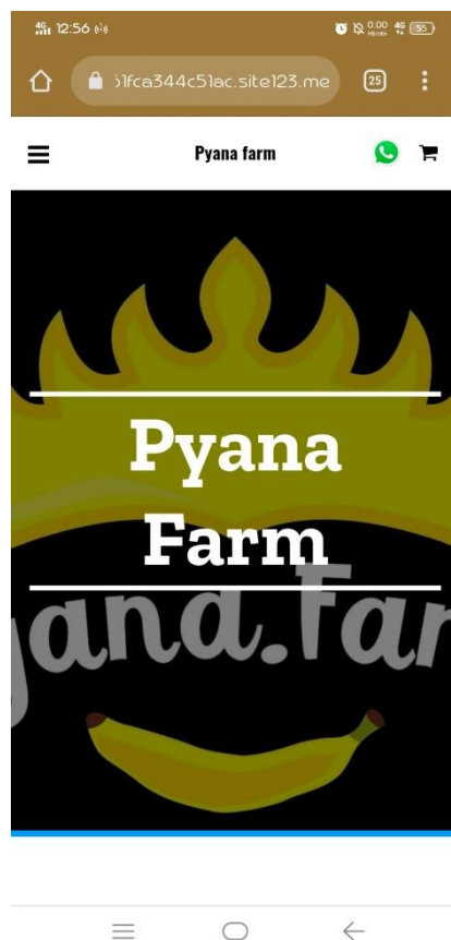
Gambar 2 : Tampilan awal web pada android