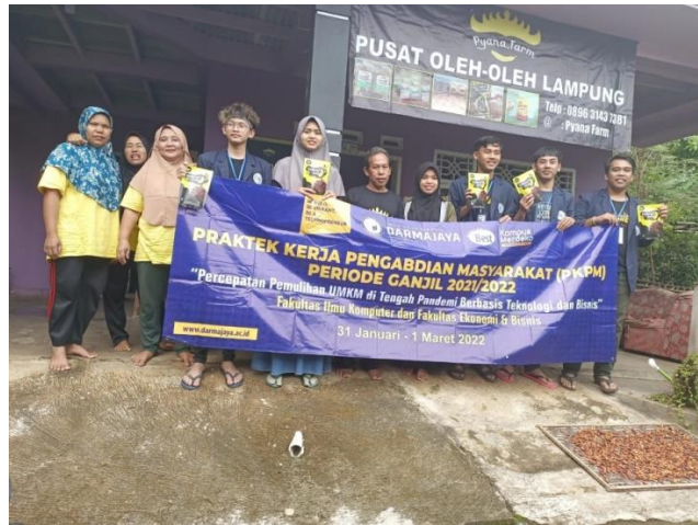
Gambar 5 : Proses Pemasangan Banner