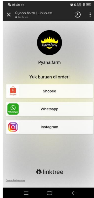
Gambar 3 : Tampilan Hasil Link Tree