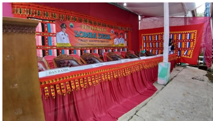
Gambar 9 : Lomba Desa