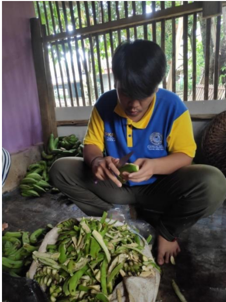
Gambar 8 : Pengorengan,Pengirisan,Pengupasan