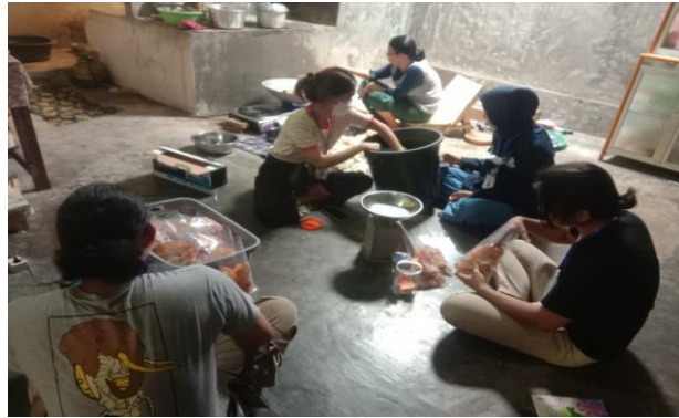
Gambar 28 pisang yang sudah di potong menggunakan alat pengiris