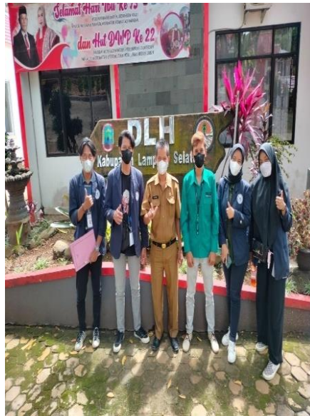
Gambar 33 foto bersama mahasiswa stie muhammadiyah