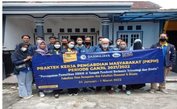
Gambar 25 kunjungan ke kantor kelurahan