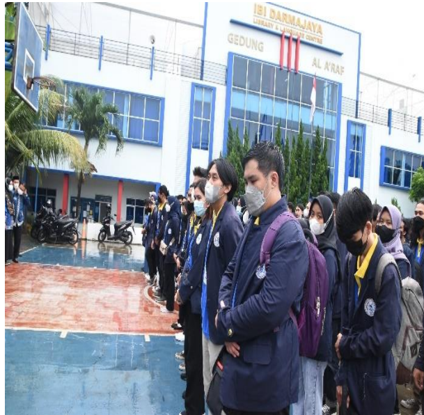
Gambar 23 pelepasan para peserta PKPM di kantor bupati lampung selatan