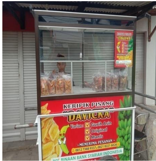
Gambar 31 kunjungan Kepala koperasi way urang