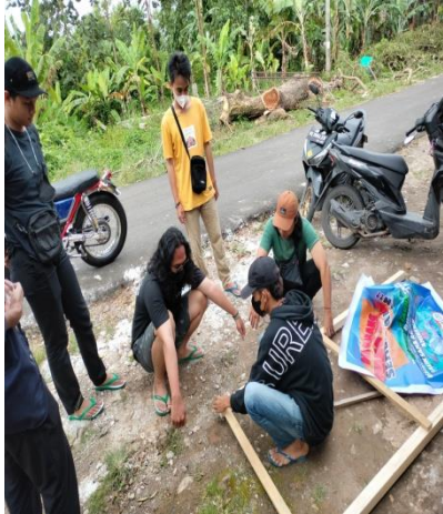
Gambar 14 pemasangan banner dilarang buang sampah