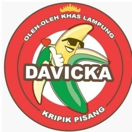
Gambar 6 Logo Produk Keripik Pisang Davicka

Logo Produk ini didesain menggunakan Aplikasi Photoshop. Dengan pembuatan label (stiker) tersebut diharapkan dapat meningkatkan penjualan dari Usaha Mandiri Keripik Pisang Davicka itu sendiri. logo ini akan digunakan untuk meningkatkan penjualan dan nantinya akan diletakkan dibagian depan kemasan.