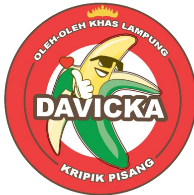
Gambar 3 tampilan Desain Kemasan baru UMKM keripik Pisang Davicka