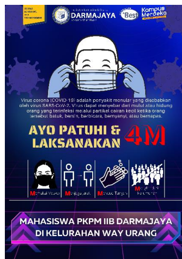
Gambar 5 desain poster pentingnya menggunakan masker

masker merupakan penghalang sederhana yang bisa membantu mencegah percikan pernapasan yang berisi virus dari orang lain masuk ke dalam tubuh kamu. Studi menunjukkan bahwa manfaat penggunaan masker yang benar, yaitu yang dikenakan menutupi hidung dan mulut bisa mengurangi semburan percikan. maka dari itu kami membuat poster pentingnya menggunakan masker agar masyarakat lebih peduli bahaya covid 19.