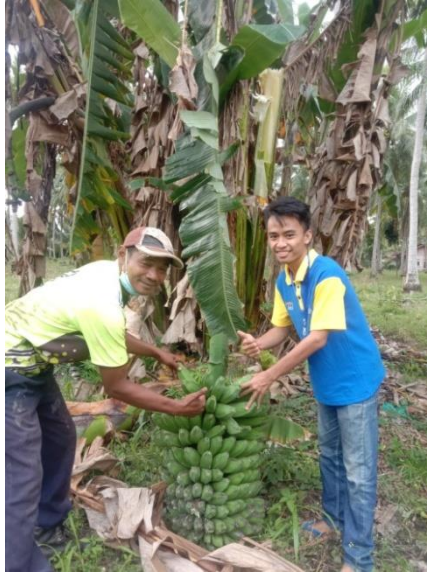
Gambar 7 Proses Pengambilan Bahan Baku