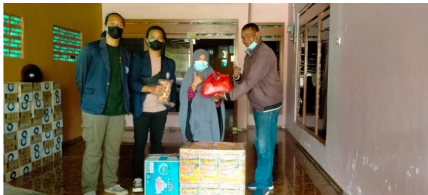
Gambar 12 pengantaran paket delivery keripik pisang kepada konsumen

Pemasaran Keripik Pisang Davicka dilakukan dengan beberapa cara yaitu melalui delivery ,rumah bapak iswadi selaku pemilik keripik pisang dan melalui outlet.