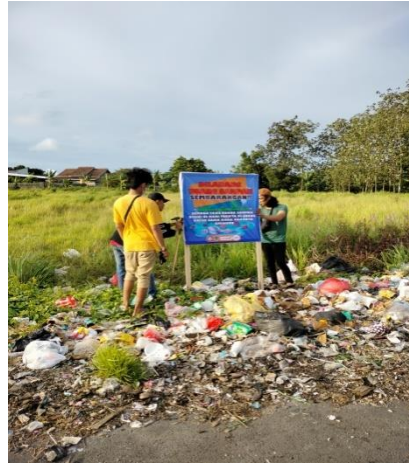
Gambar 15 proses pembersihan sampah di lingkungan perumahan hartono