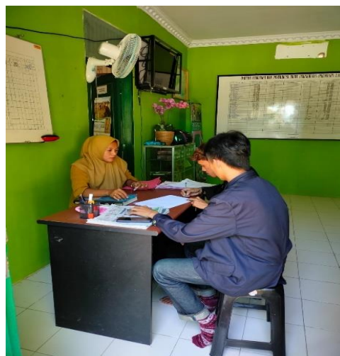
Gambar 16 proses izin pengambilan bibit pohon

Menanam pohon merupakan bentuk kepedulian dan kecintaan manusia terhadap bumi. Dengan pohon dan hutan yang baik, maka akan memberikan kesejahteraan yang baik pula untuk manusia. Oleh karena itu kami bersama dinas lingkungan hidup, STIE kalianda dan Media Wartapala Melakukan kegiatan Penanaman bibit pohon di sekitar way urang dan kantor dinas.