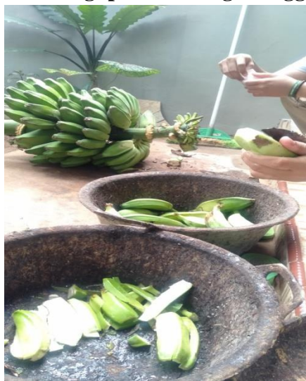
Gambar 8 Proses Pengupasan Pisang Menggunakan Pisau

Pembuatan Keripik Pisang masih menggunakan cara sederhana, mulai dari mengupas pisang dengan menggunakan pisau dapur dan memakai alat pemotong pisang tradisional.