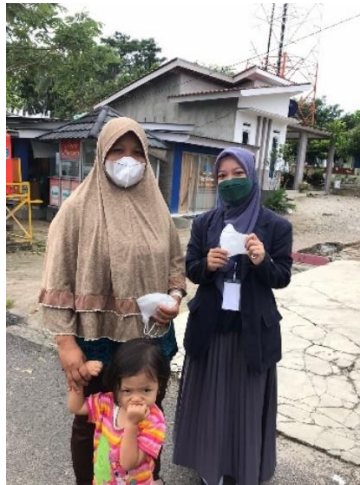
Gambar 2.3.5 Dokumentasi pembagian masker

Kegiatan membagikan masker kepada masyarakat sekitar merupakan salah satu perhatian yang saya berikan, karena masih banyak warga yang tidak menggunakan masker saat beraktivitas. Kita tidak pernah tahu, dimana virus corona itu berada. Dengan dibagikan masker diharapkan masyarakat selalu ingat dan waspada terkait covid-19 serta himbauan selalu menjaga kesehatan tubuh.