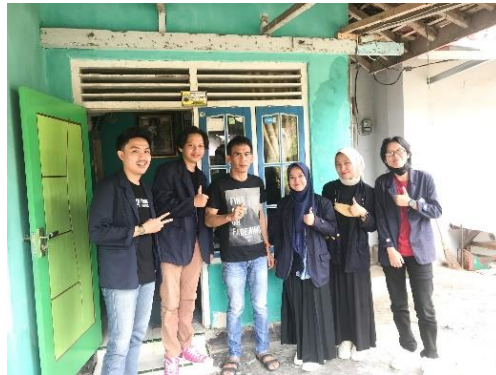
Gambar 2.3.1 Foto dengan Kepala Desa

Permohonan surat izin yang disampaikan kepada perangkat Desa Banding, yang bertujuan untuk melaksanakan kegiatan PKPM yang di mulai dari tanggal 31 Januari – 02 Maret 2022.