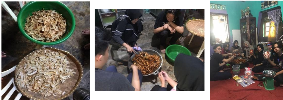
Gambar 2.3.3 Proses produksi keripik singkong

Proses produksi adalah cara, metode, serta teknik untuk menciptakan, mengolah, atau memberi nilai tambah bagi suatu barang atau jasa dengan menggunakan sumber-sumber daya (tenaga kerja, bahan-bahan, dana) yang ada. Dalam kegiatan ini proses produksi Keripik yang masih dilakukan secara tradisional yaitu mulai dari pembersihan, pemotongan dan penjemuran singkong dan penggorengan serta memberi bumbu hingga pengemasan produk yang dibantu oleh 2 tenaga kerja.