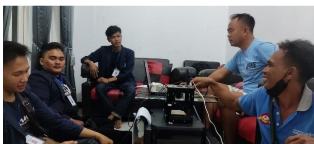
Gambar 2.2 pengenalan website

Dalam Kegiatan ini saya memberikan arahan tentang cara kerja dan juga cara pengelolaan website kepada pemilik UMKM Souvenir Minang Rua.