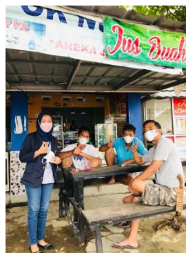
Gambar 2.3.3 Dokumentasi pembagian masker

Kegiatan membagikan masker kepada masyarakat sekitar merupakan salah satu perhatian yang saya berikan, karena masih banyak yang saya lihat warga yang tidak menggunakan masker saat mereka beraktivitas. Padahal kita tidak akan pernah tahu, dimana virus corona itu berada. Dengan dibagikan masker diharapkan masyarakat selalu ingat dan waspada terkait covid-19 serta himbauan selalu menjaga kesehatan tubuh.