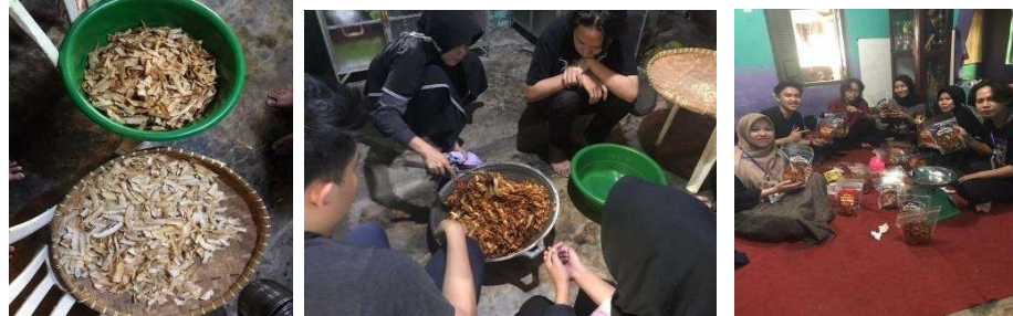
Gambar 2.3.1 Proses produksi kripik singkong

singkong dan penggorengan serta memberi bumbu hingga pengemasan produk yang dibantu oleh 2 tenaga kerja.