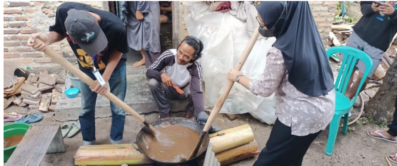
gambar 2.3.5 pembuatan dodol dengan manual

dari kayu bakar sembari diaduk selama 1-2 jam hingga adonan menjadi kalis dan tidak lengket.