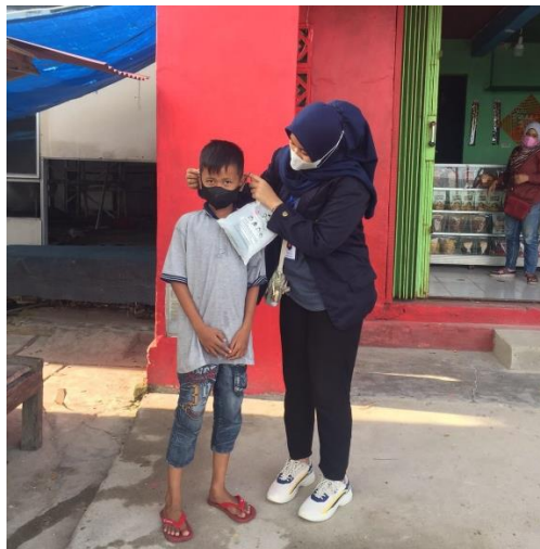
2.3.9 sosialisasi dalam pemakaian masker

Berbagi merupakan langkah nyata dalam sebuah kegiatan, berbagi itu tidak melulu dengan materi pasalnya berbagi ilmu adalah hal yang sangat penting untuk kelangsungan norma dimasyarakat. Dengan bersosialisasi sekaligus mengedukasi mahasiswa dapat berbagi yang mana amalnya merupakan amalan jariyah yaitu ilmu yang bermanfaat. Selain itu, kegiatan ini bertujuan untuk masyarakat terutama anak-anak di Desa Banding dapat mengetahui seberapa bahaya dan mematikan nya wabah virus corona ini.