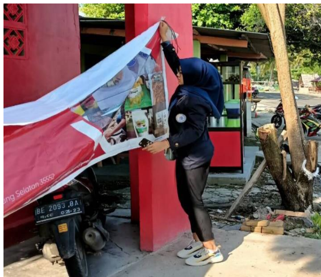
Gambar 2.3.4 Persiapan Bazar

Kegiatan ini merupakan suatu bentuk dedikasi kami kepada masyarakat yang bertujuan untuk membantu dan berpartisipasi pada persiapan acara peresmian dan bazar yang dilaksanakan pada tanggal 11 Februari 2022