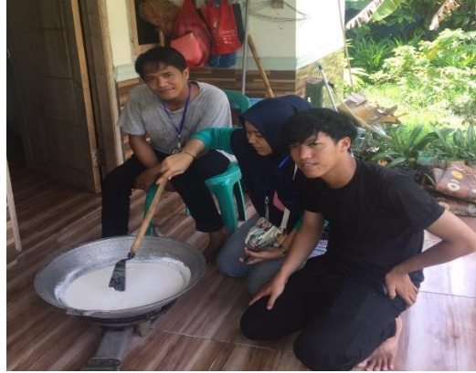
Gambar 2.3.1 Melakukan Produksi Minyak Kelapa