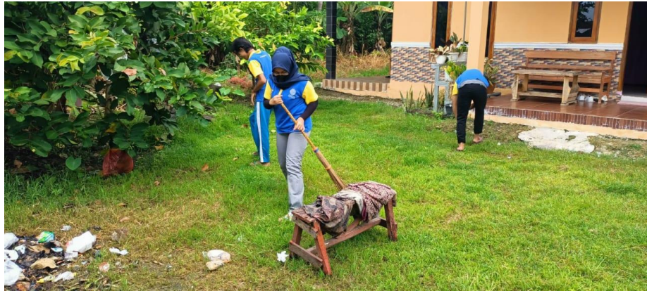
Gambar 2.3.2 Cleaning Day