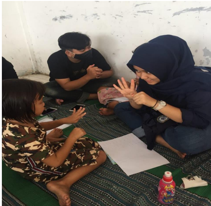
2.3.10 proses pembelajaran

menulis, berhitung hingga pembahasan pekerjaan rumah (PR) yang diberikan oleh guru sekolah.