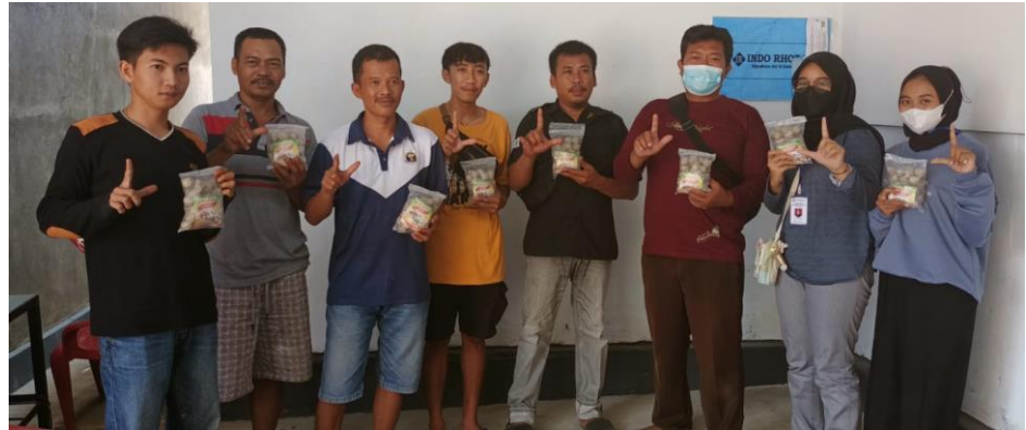
Gambar 2.3.6. kunjungan CV Alben