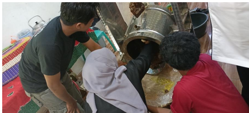
Gambar 2.3.3 proses pembuatan dodol dengan mesin

Setelah pembuatan minyak, kegiatan yang selanjutnya adalah pembuatan dodol. Bahan-bahan yang dibutuhkan dalam pembuatan dodol meliputi, tepung beras ketan, daun waru, gula putih,, dan gula merah. Selanjutnya bahan bahan tersebut dimasukkan kedalam mesin, kemudian mesin otomatis mengaduk selama 2-3 jam.