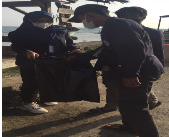
2.3.11 penanggulangan sampah