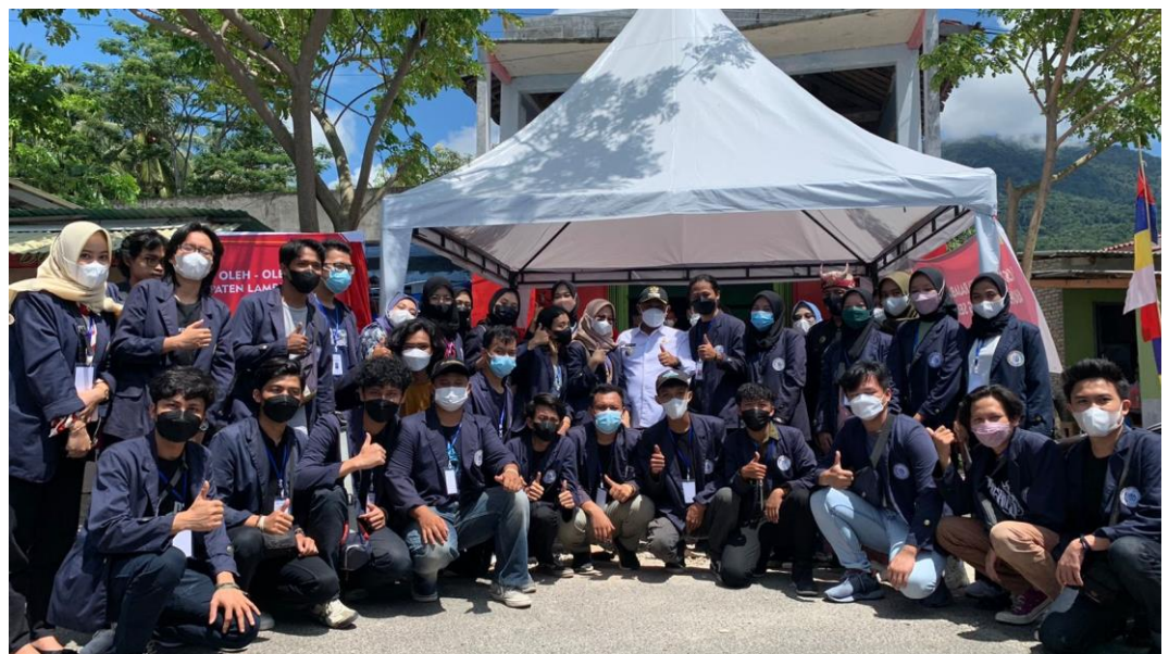
Gambar 2.3.7 acara peresmian dan bazar