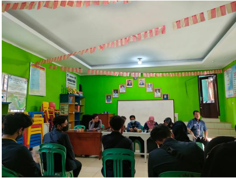
Pembukaan dan pelepasan peserta PKPM di Balai Desa Way Muli Timur