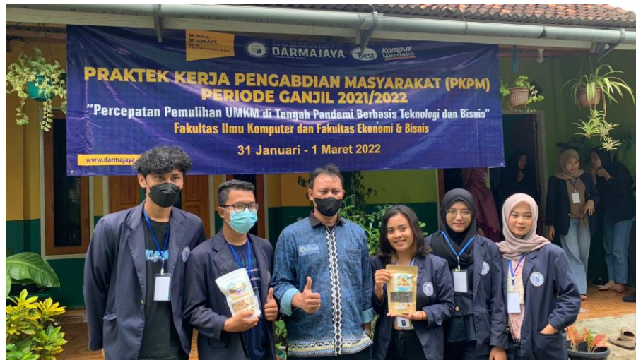
Kunjungan DPL (Dosen Pembimbing Lapangan) ke Desa Way Muli Timur