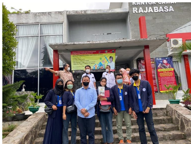
Presentasi hasil kerja selama PKPM di kantor Kecamatan Rajabasa