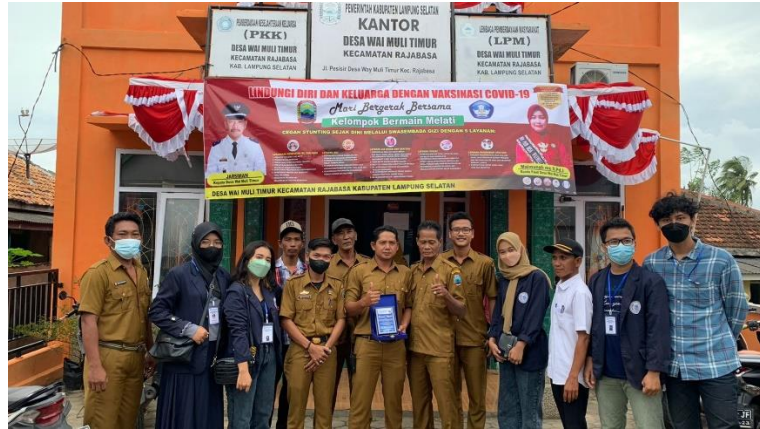
Pemberian cindramata serta berpamitan kepada aparat desa Way Muli Timur