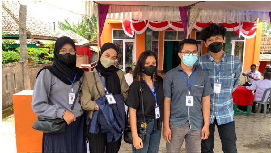
Menghadiri acara lomba desa Way Muli Timur

Menghadiri acara Musrenbang (Musyawarah Rencana Pembangunan) dan peresmian Pusat Kerajinan dan Oleh-oleh Kecamatan Rajabasa oleh Bapak Bupati Kabupaten Lampung Selatan