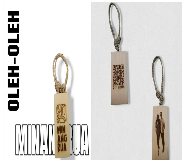
Gambar 2.3.1. Souvenir Minangrua dan Custom Souvenir

Souvenir yang di buat adalah souvenir gantungan kunci terbuat dari Kayu yang berkualitas super, dengan ketebalan kayu 3,5 – 4,0 MM, panjang kayu 5 CM, lebar kayu 3 CM. Gantungan souvenir menggunakan tali kulit pohon tanjung, proses pengukiran kayu menggunakan alat laser engraving. Dan untuk desain bisa Custom foto, logo, nama dll.