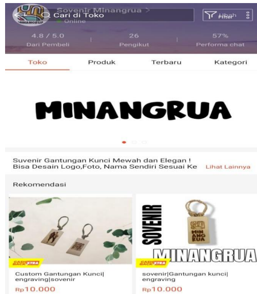
Gambar 2.3.2. Aplikasi Penjualan di Shopee

ilmu mengenai pemasaran dalam meningkatkan kepercayaan masyarakat, sehingga pada saat Mahasiswa PKPM IIB Darmajaya melakukan pelatihan mengenai pemasaran online melalui marketplace dan brosur bapak Rian Haikal,S.Pd, sangat tertarik dengan hal tersebut.