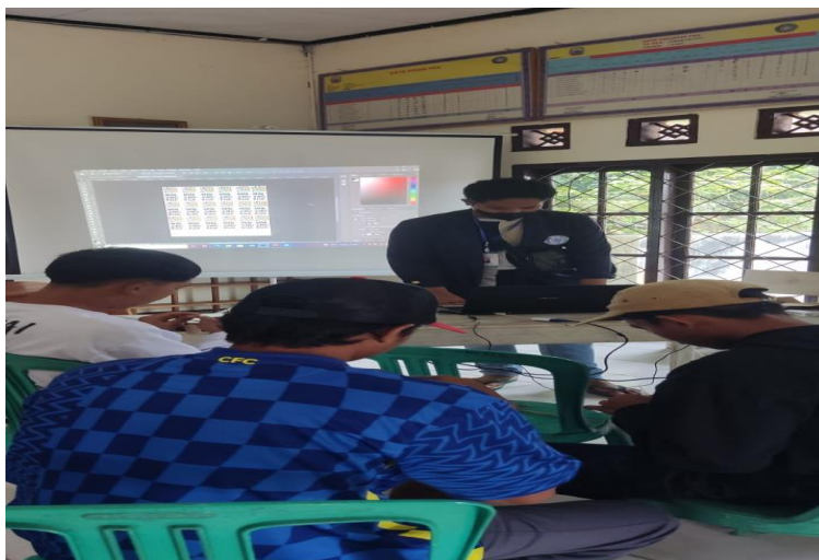
Gambar 2.3.2. Kegiatan Workshop di Kantor Desa Kelawi

Program pertama yang dilakukan pertama kali yaitu melakukan pembuatan akun penjualan di shopee, membuat nama toko shopee “Sovenir_minangrue” dan mengupload produk souvenir yang ingin dijual.