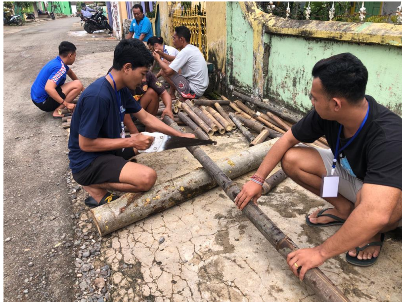
Gambar 6. Membantu warga desa untuk mengikuti kegiatan lomba desa

Membantu Warga Dusun Kenyayan untuk mempersiapkan kegiatan Lomba Desa yang di adakan pada tanggal 25 Februari 2022. Dapat dilihat pada Gambar.6