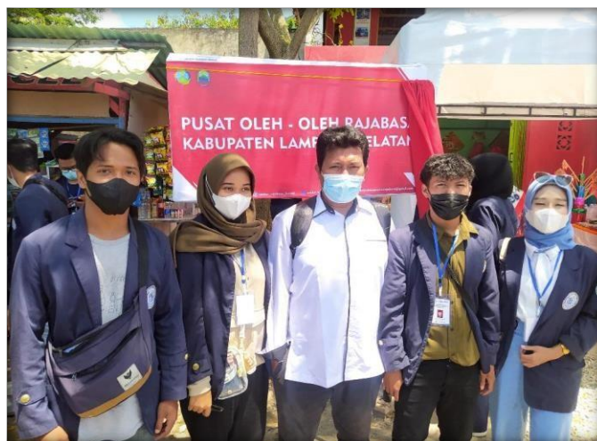
Gambar 2.8 Permohonan izin kepada pemilik UMKM

Gambar 2.8 berikut adalah permohonan izin kepada UMKM PermataShidqi.