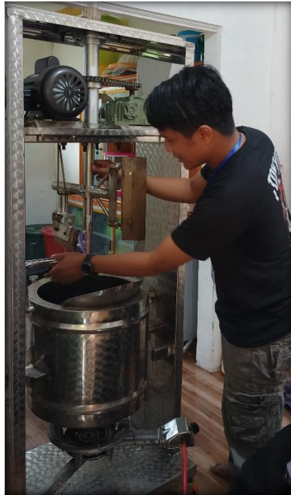
Gambar 2.10 pembuatan dodol dengan menggunakan alat mesin pembuat dodol

Gambar 2.11 berikut adalah pemasangan baner yang di lakukan di UMKM