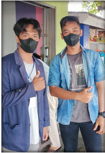
Gambar 2.17 Pembagian Masker kepada Warga Desa

Gambar 2.18 ini adalah proses penyerahan cinderamata kepada UMKM