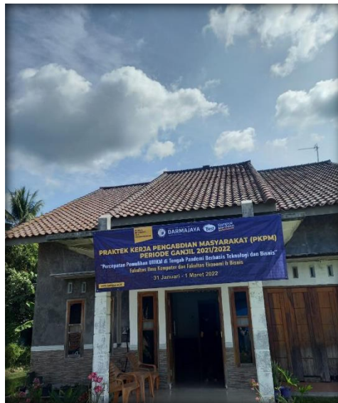
Gambar 2.11 Pemasangan baner