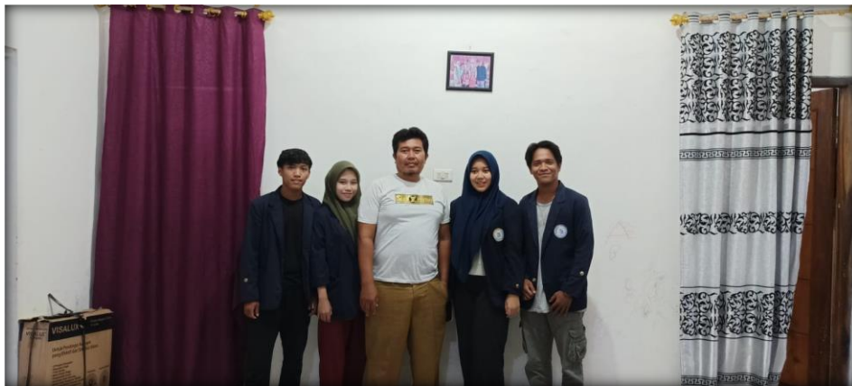
2.18 Penyerahan Cinderamata kepada UMKM

Gambar 2.18 ini adalah proses penyerahan cinderamata kepada UMKM