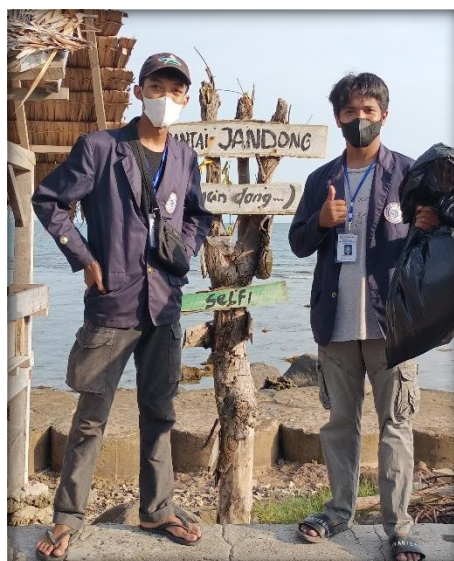
Gambar 2.13 Membersihkan pantai

Gambar 2.13 berikut adalah kegiatan membersihkan pantai Banding Resort pada sore hari yang terletak di desa Banding: