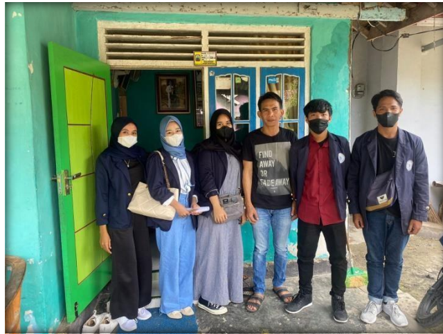
Gambar 2.7 Permohonan Izin kepada Kepala Desa Banding

Gambar 2.7 berikut adalah permohonan izin kepada kepala desa Banding: