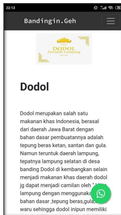
Gambar 2.3 Tampilan Halaman deskripsi dodol

Halaman ini berisi tentang penjelasan Dodol Juwadah itu sendiri.