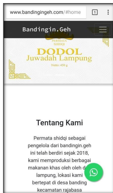
Gambar 2.1 Tampilan Awal Web

Pada tampilan awal web informasi ini berisi tentang deskripsi UMKM dan Dodol Juwadah.