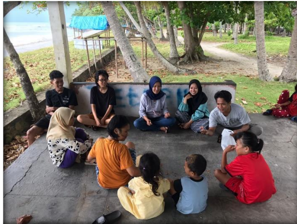
Gambar 2.14 Mengedukasi dan Mengajar anak-anak desa Banding

Gambar 2.14 berikut adalah kegiatan mengedukasi dan mengajar anak-anak desa Banding tentang pencegahan covid-19: