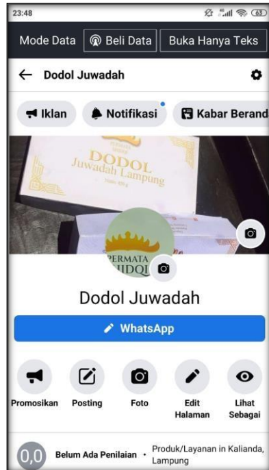
Gambar 2.5 Media Sosial halaman Facebook

Gambar 2.6 berikut ini menampilkan iklan yang membuat pelanggan tertarik untuk membeli produk Dodol Juwadah :