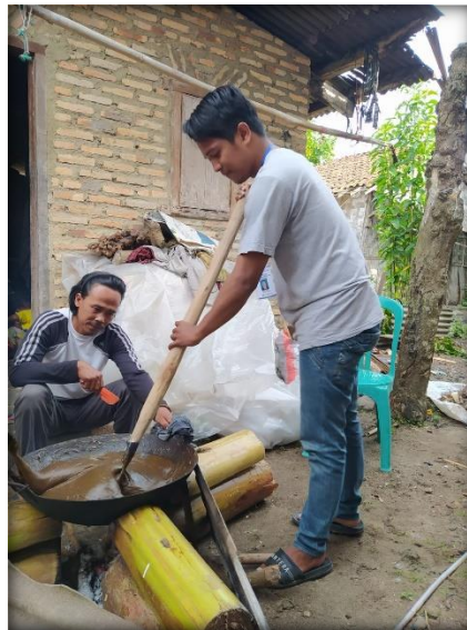
Gambar 2.16 Pembuatan Dodol Secara Manual

Gambar 2.16 berikut adalah proses pembuatan dodol secara manual dan sederhana yang membutuhkan waktu 3=4 jam yaitu dengan cara mengaduknya: