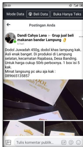
Gambar 2.6 Halaman Iklan

Gambar 2.6 berikut ini menampilkan iklan yang membuat pelanggan tertarik untuk membeli produk Dodol Juwadah :