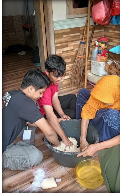
Gambar 2.9 Proses Produksi Minyak Kelapa

Gambar 2.9 ini merupakan salah satu proses pembuatan dodol yaitu dengan pembuatan minyak kelapa: