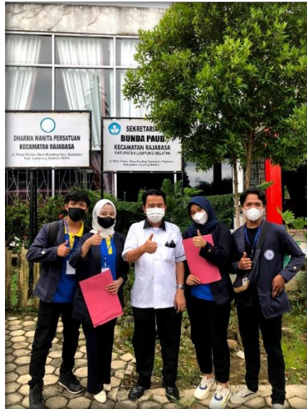
Gambar 2.19 Pelepasan Mahasiswa PKPM

Gambar 2.19 ini merupakan pelepasan mahasiswa PKPM yang di hadiri oleh Dosen Pembimbing Lapangan (DPL)