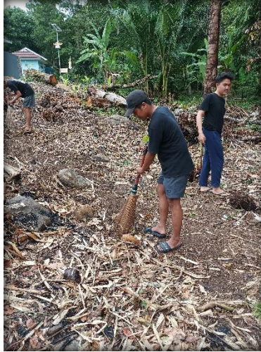
Gambar 2.15 Gotong royong di halaman kantor Kecamatan Rajabasa

Gambar 2.16 berikut adalah proses pembuatan dodol secara manual dan sederhana yang membutuhkan waktu 3=4 jam yaitu dengan cara mengaduknya: