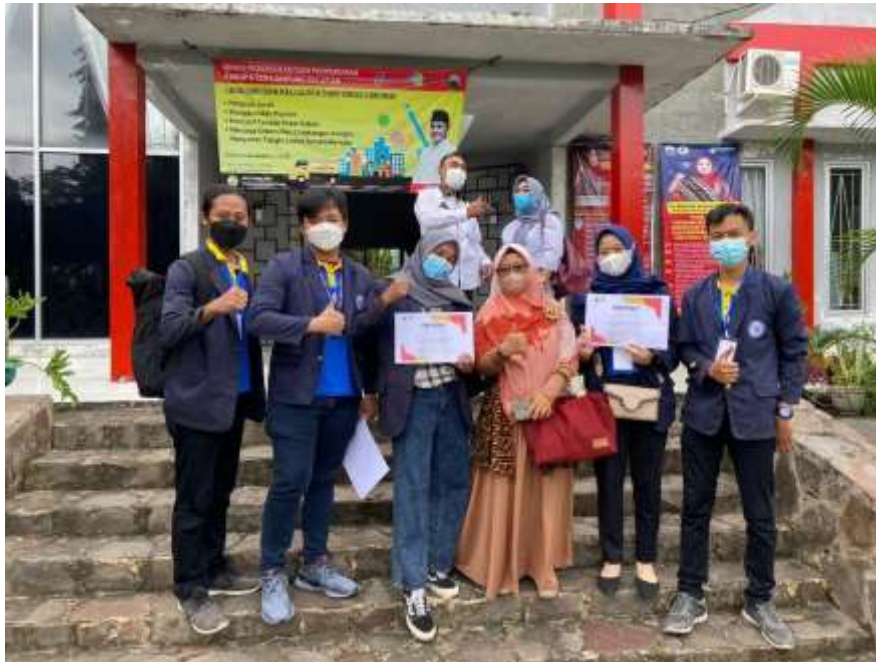
Gambar 1. Persentasi di Kecamatan Rajabasa

Adapun yang terlampir disini yaitu bukti aktivasi kegiatan dalam bentuk dokumentasi Guna untuk melengkapi Kegiatan Praktek Kerja Pengabdian Masyarakat (PKPM) :