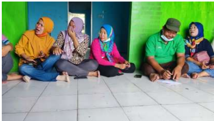
Gambar 2. Rapat Di pasar UMKM Bersama dengan para pemilik UMKM