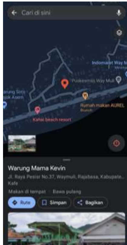
Gambar 5. Lokasi UMKM Bu Zahra