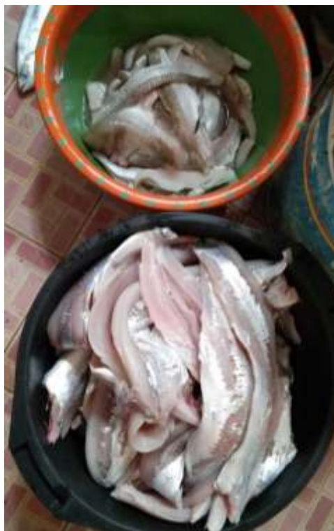
Gambar 6. Bahan Baku Pembuatan Bakso ikan