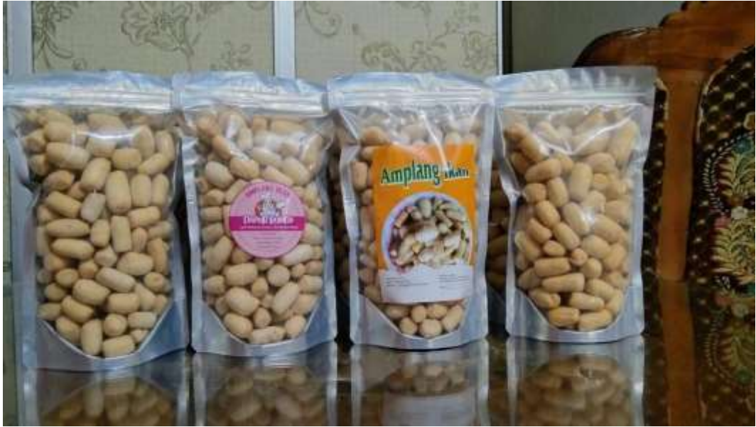
Gambar 7. Kerupuk Tulang Ikan Barakuda