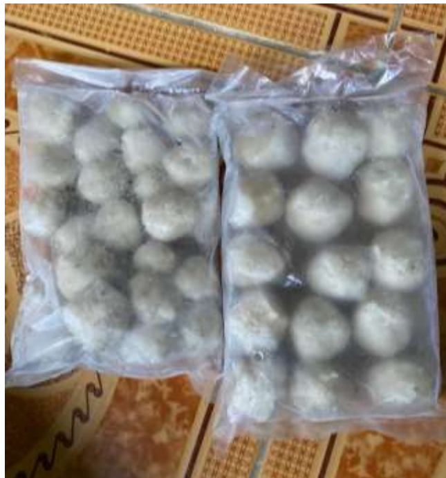
Gambar 8. Bakso Ikan Barakuda