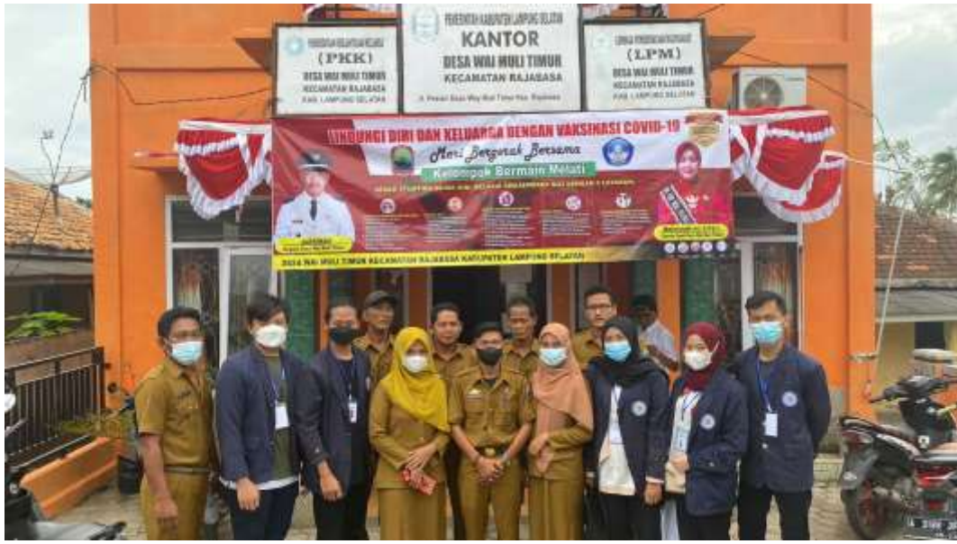
Gambar 3. Pelepasan kelompok PKPM di desa Waimuli Timur