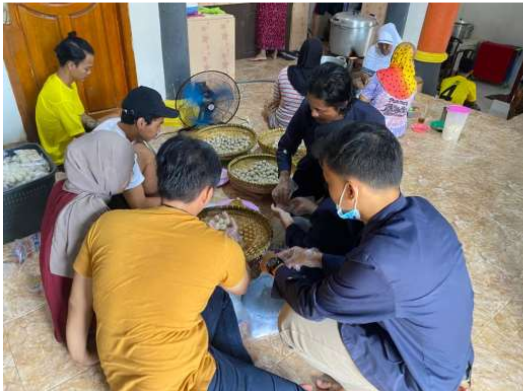
Gambar 4. Proses pengemasan