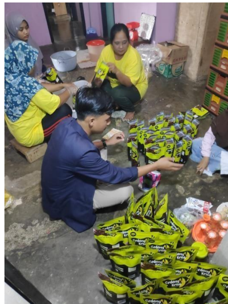
Gambar 2.1 : Membantu Pengelolaan Gedang Kriuk

Salah satu UMKM yang ada di Desa Kekiling ini adalah Gedang Kriuk. Gedang kriuk merupakan keripik pisang yang paling ekonomis bila dibandingkan dengan keripik pisang lain. Kelebihan yang dimiliki adalah kecepatan pertumbuhan/produksi keripik dalam waktu yang relatif cepat dan singkat atau sekitar 1 minggu produksi keripik sudah dapat dipasarkan atau dikonsumsi. Perkembangan keripik pisang mulai dari original, keju, moka, dan lain-lainnya. Pada siklus ini pemilik keripik pisang gedang kriuk memproduksi keripik pisang sebanyak 600-800 bungkus. Waktu kadaluarsa keripik pisang gedang kriuk ini adalah 6 bulan.