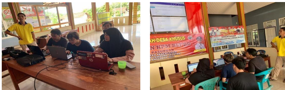
Gambar 2.4 : Kegiatan Pemasukan Data Warga Desa ke Website Smart Village

Kegiatan pemasukan data warga Desa Kekiling dilakukan di balai desa kekiling dengan dibantu oleh aparatur Desa Kekiling. Kegiatan ini dilakukandalam menyukseskan program smart village yang diberikan oleh pemerintah Kabupaten Lampung Selatan.