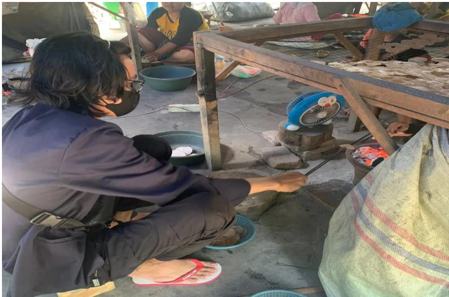
Gambar. Proses membakar kemplang