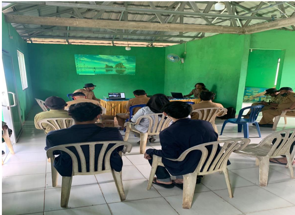
Gambar. Kegiatan di Balai Desa