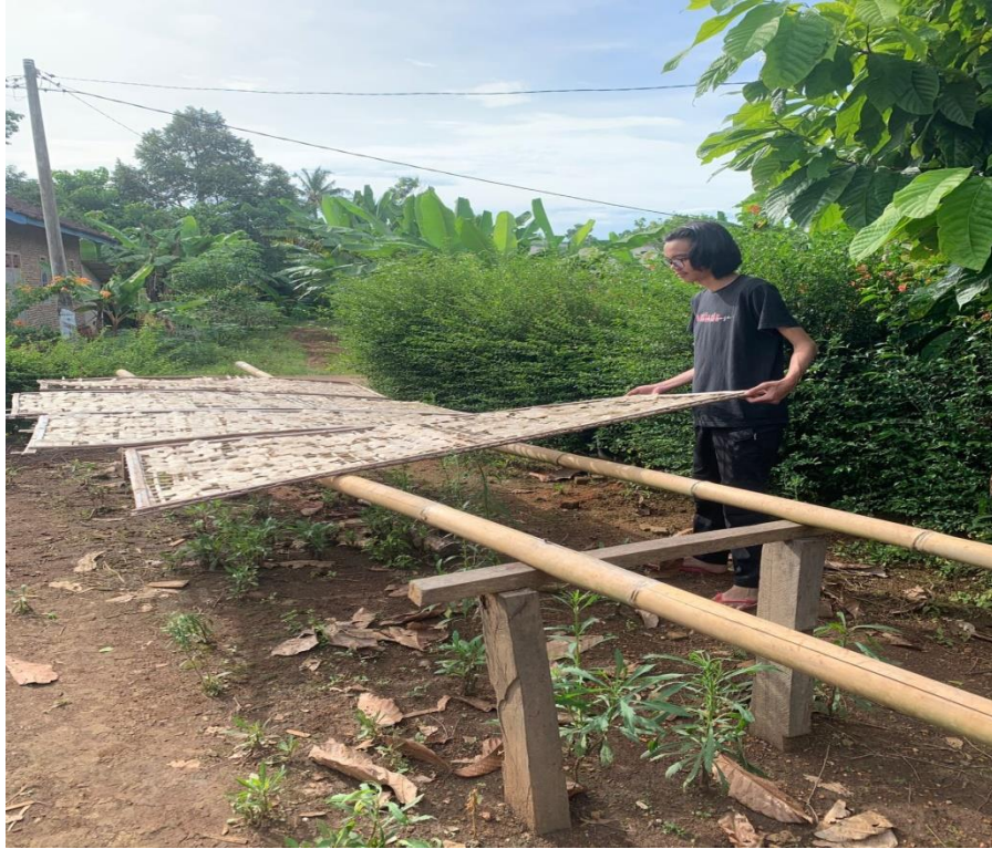
Gambar. Proses penjemuran kemplang