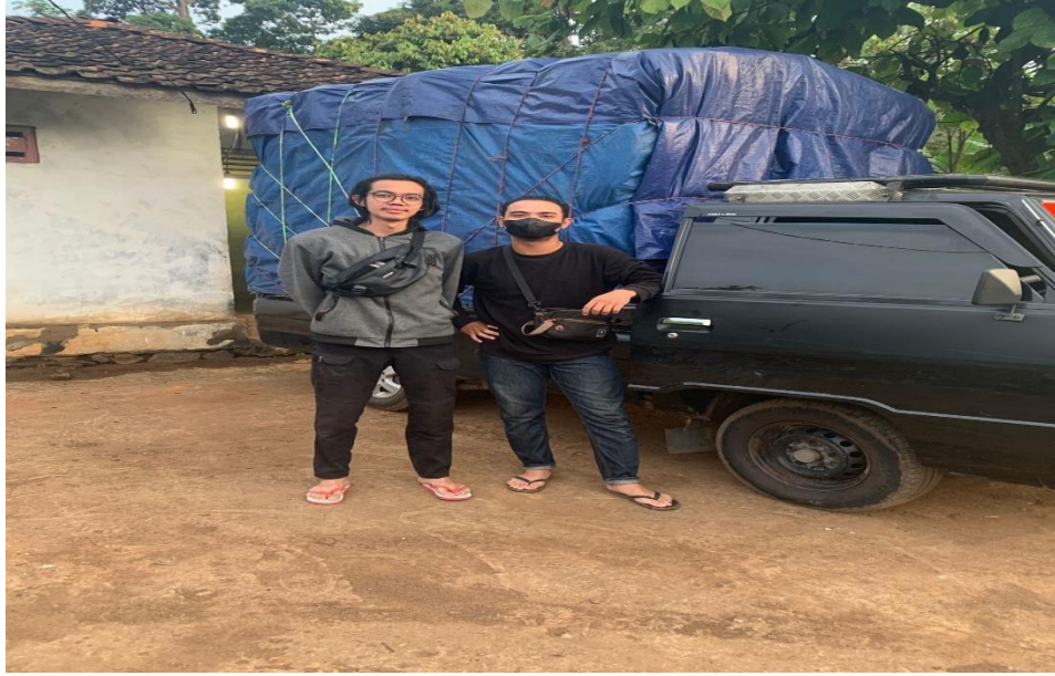
Gambar. Mengantar pesanan kemplang ke Serang Banten