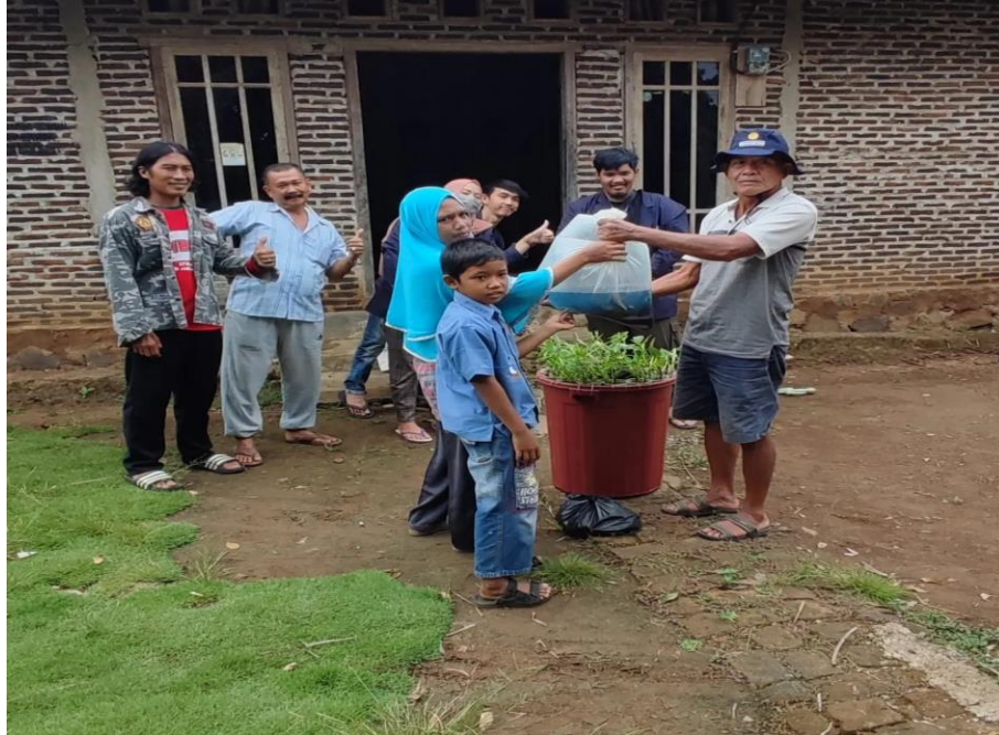
Gambar. Penyerahan budidaya ikan dalam ember