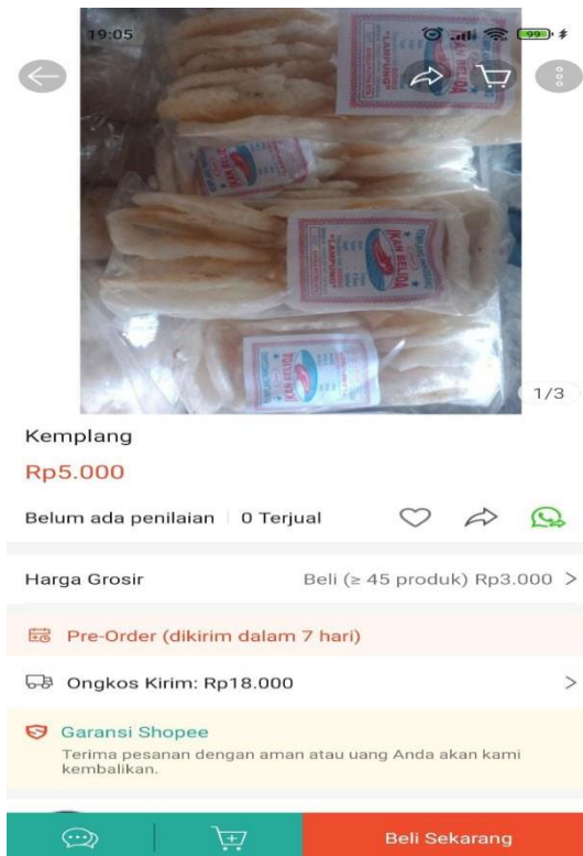
Gambar. Salah satu MarketPlace Ridho Kemplang