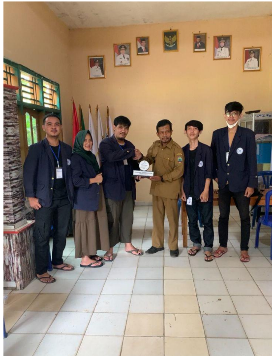
Gambar. Penyerahan kenang-kenangan ke di Balai Desa