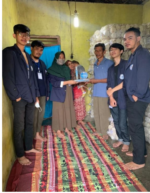
Gambar. Penyerahan kenang-kenangan ke di UMKM