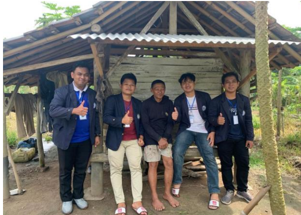
Gambar 4. Dengan petani daun kelor