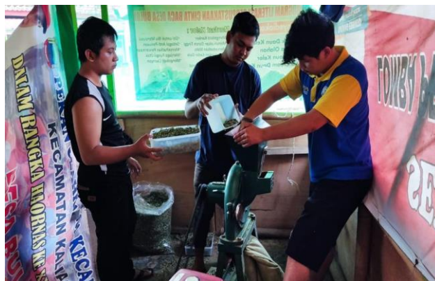
Gambar 6. Penggilingan daun kelor