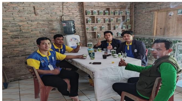
Gambar 3. Diskusi mengenai perencanaan Lamban kelor