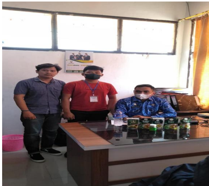
Gamabar 8. Upaya kerjasama dengan kabupaten lampung tengah di dinas Bappeda