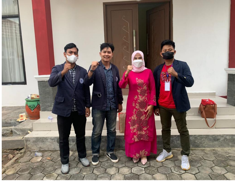
Gambar 9. Dengan ibu bupati lampung selatan membantu mengenal kerajinan Tradisional