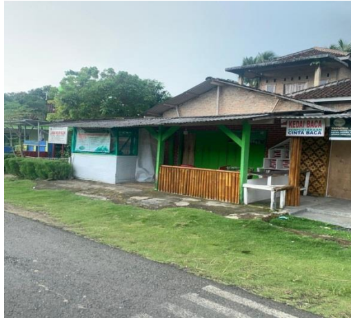
Gambar 1. Kondisi UMKM Lamban Kelor