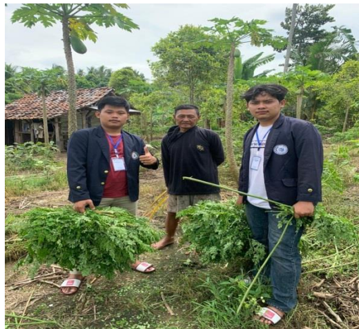
Gambar 5. Pemanenan daun kelor