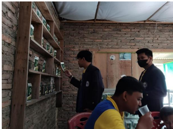
Gambar 2. Pengamatan olahan daun kelor