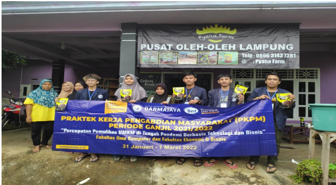
Gambar 1: Kunjungan UMKM