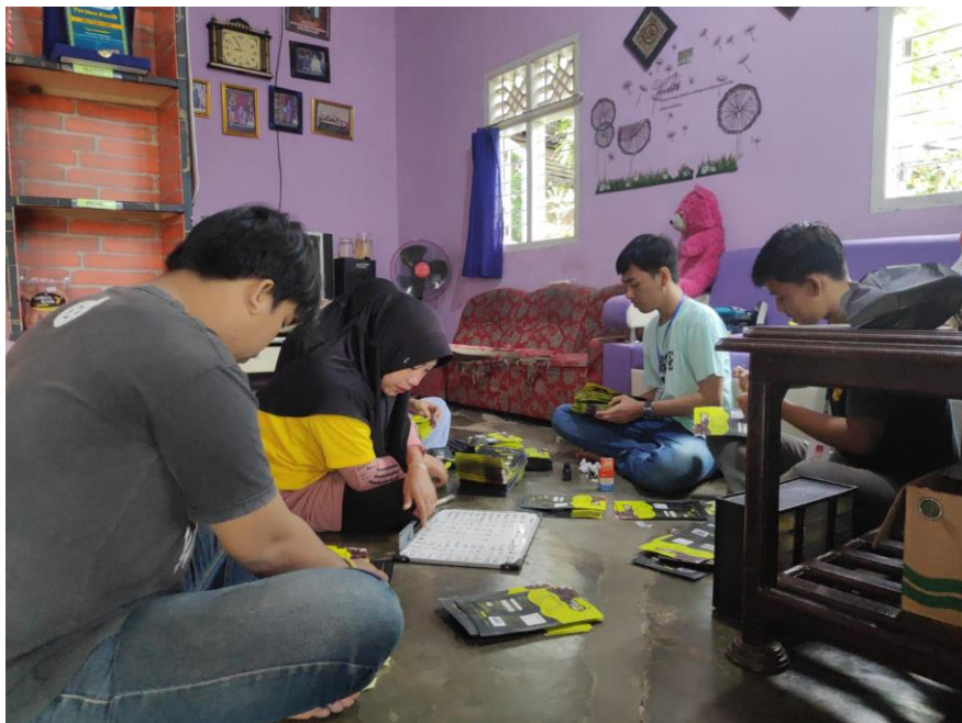
Gambar 2: Membicarakan Cara Pemasaran Produk Dengan Owner

Membicarakan tentang cara pemasaran produk dengan owner dilakukan di rumah sekaligus rumah produksi Gedang Kriuk, dari sini didapatkan satu pemikiran tentang melakukan pemasaran produk melalui shopee.