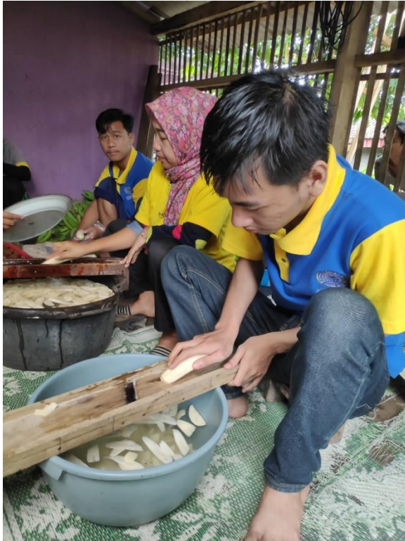
Gambar 3: Membantu Proses Pembuatan Gedang Kriuk

Kegiatan yang dilaksanakan pada salah satu UMKM yakni membantu proses pembuatan Gedang Kriuk dari awal proses hingga selesai dengan pembuatan masih secara manual agar tidak merubah cita rasa dan tampilannya dengan upaya pengembangan potensi dan meningkatkan daya saing UMKM.