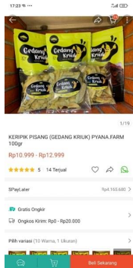
Gambar 4: Inovasi Dalam Penjualan Produk UMKM