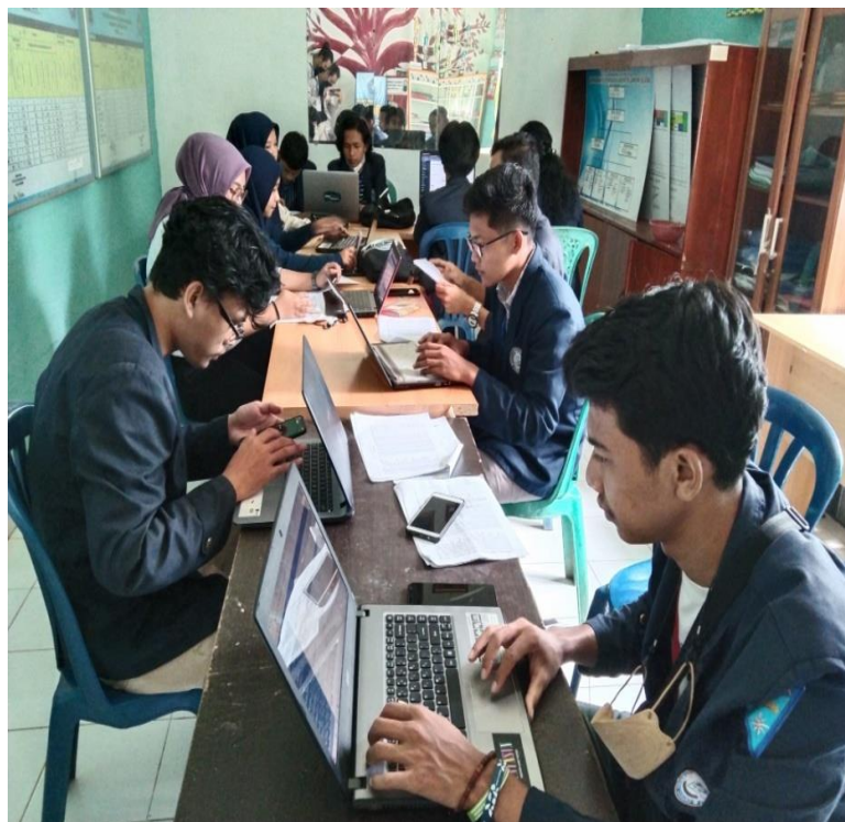
Gambar 10. Penginputan Data Vaksinasi