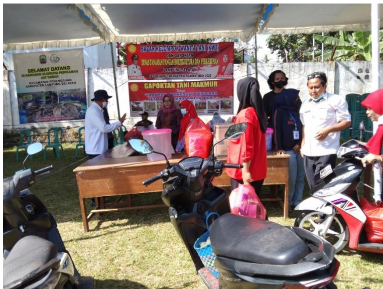
Gambar 9. Membantu Ibu-Ibu Kelompok Tani