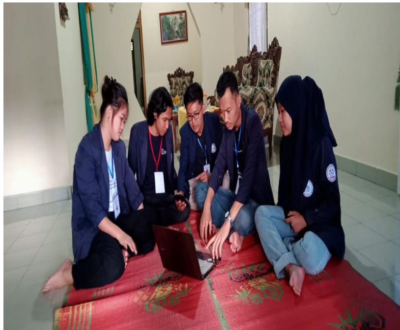
Gambar 4 Diskusi Program Kerja Kelompok