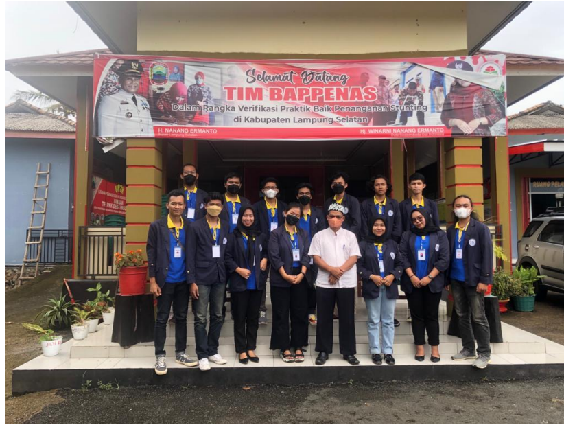
Gambar 13. Kegiatan Bersama Kepala Desa