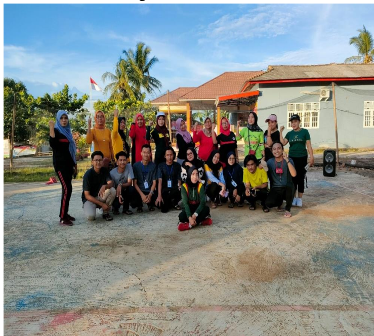
Gambar 6 Mengikuti senam KJS