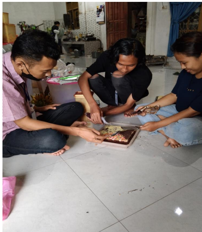
Gambar 12 Pemberian Topping Brownis