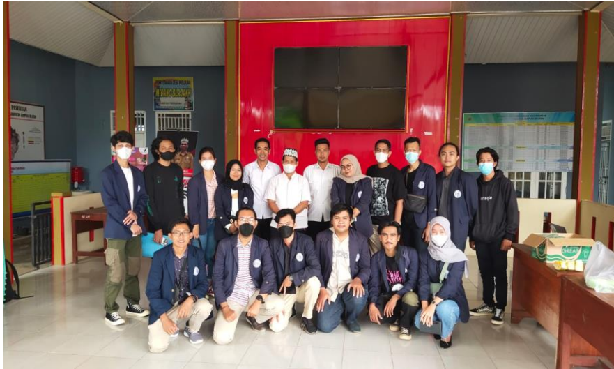
Gambar 1. Kunjungan Desa