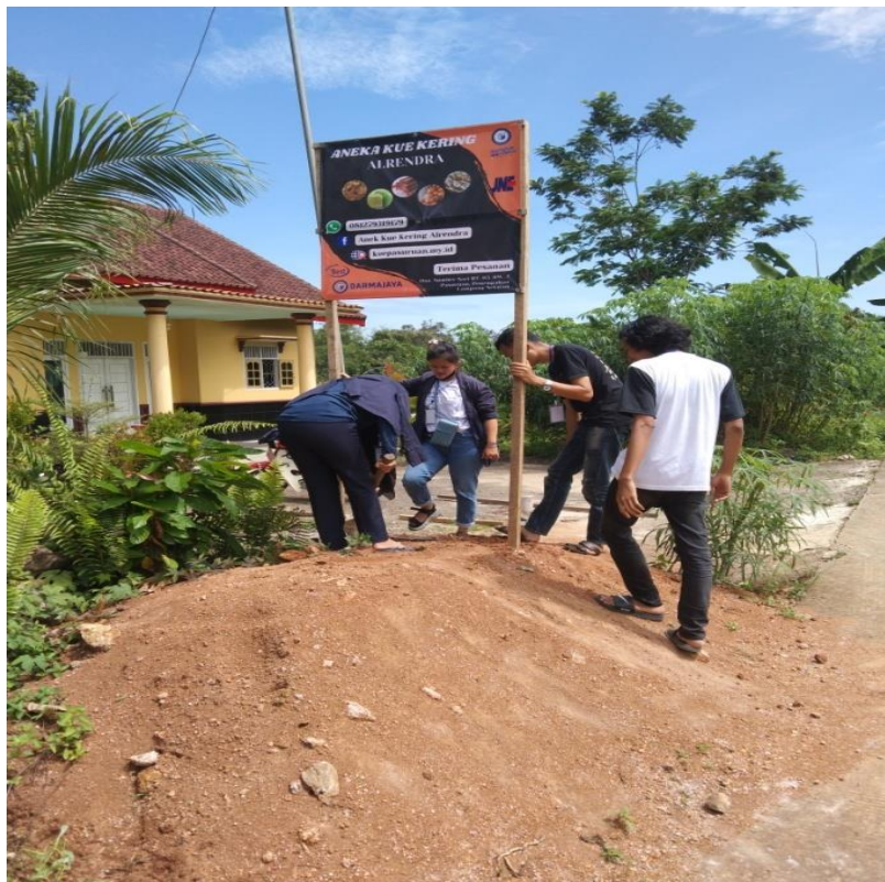
Gambar 8 Pemasangan banner UMKM