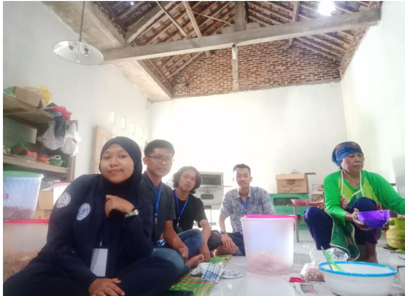
Gambar 7. Pembuatan Peyek