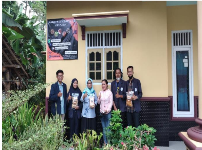
Gambar 11 Kunjungan Dpl ke UMKM