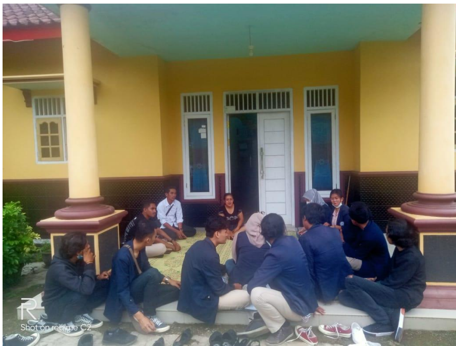
Gambar 2 Survey UMKM