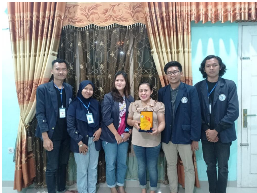
Gambar 14. Pemberian cenderamata ke UMKM