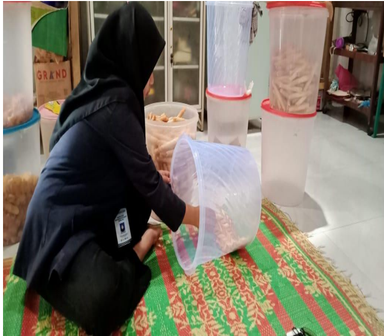
Gambar 5 Pengemasan Pemesanan Hantaran