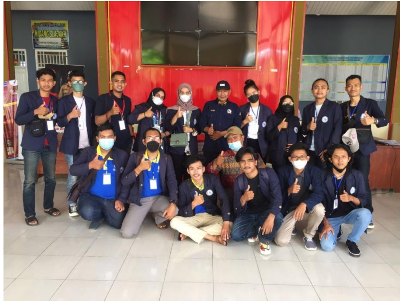
Gambar 3 Membantu Pembagian BLT