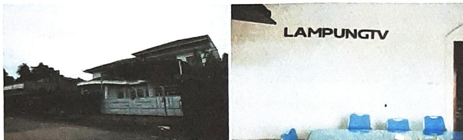
Gambar 1.1 kantor PT. Lampung TV

PT. Lampung TV berlokasi di Jl. Perwira, No.3, Rajabasa, Bandar Lampung.