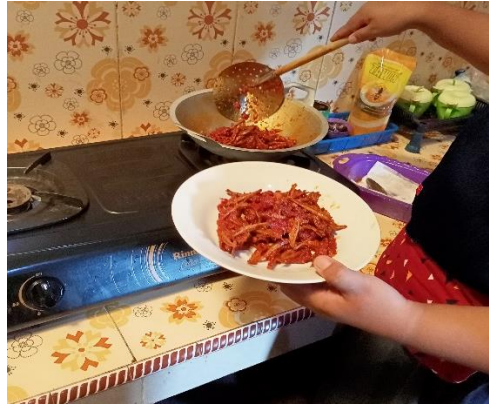
Gambar 2.3 Pembuatan Teri Balado