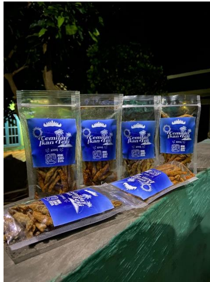
Gambar 2.4 Ikan Teri Balado dan Original Crispy.

Cara meningkatkan kualitas ikan teri basah menjadi olahan ikan teri dengan membuat rasa balado dan original crispy, dan menggunakan kemasan yang bagus dan rapih agar teri dapat bertahan lama disimpan di dalam kulkas.