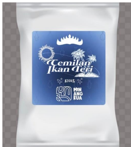
Gambar 2.9 Logo Produk Ikan Teri

Dengan adanya logo masyarakat dapat mengenal produk UMKM lebih mudah dan logo menjadi identitas dari Olahan Ikan Teri itu sendiri.