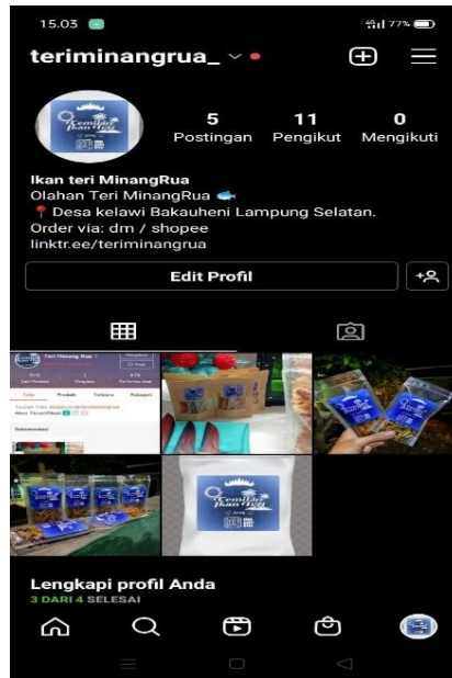
Gambar 2.7 Akun Instagram Teri Minangrua “teriminangrua_”

Pembuatan akun Instagram digunakan sebagai alat promosi dan informasi seputar UMK Olahan Ikan Teri. Sehingga masyarakat dapat melihat UMKM Olahan Ikan Teri melalui media sosial dan dapat memesan Olahan Ikan Teri melalui direct message Instagram atau memesan di link shopee yang ada di bio Instagram.