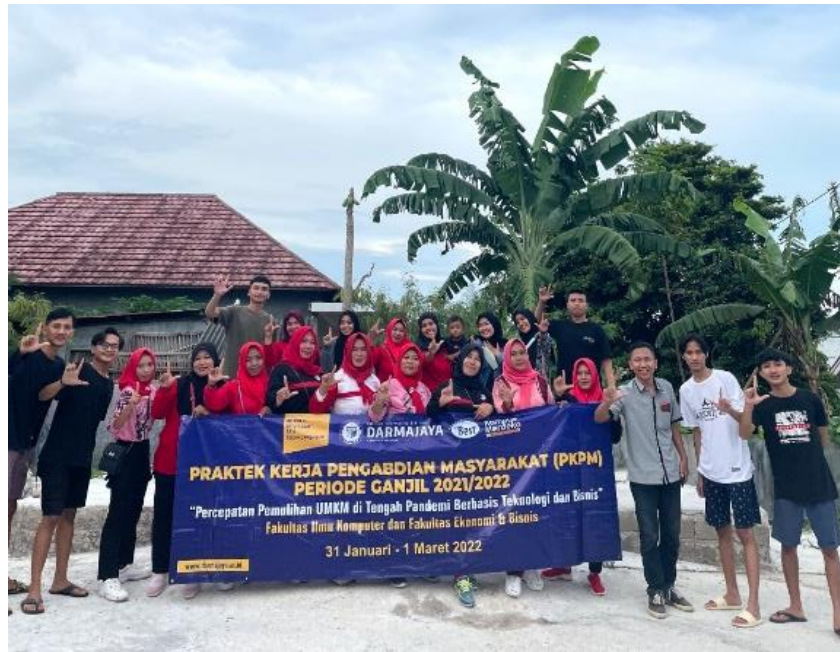
Gambar 2.10 Keikutsertaan senam bersama Ibu-Ibu

Dengan adanya keikutsertaan kegiatan senam bersama ibu-ibu masyarakat Desa Kelawi setempat sangat senang guna meningkatkan kebugaran jasmani dan Rohani.