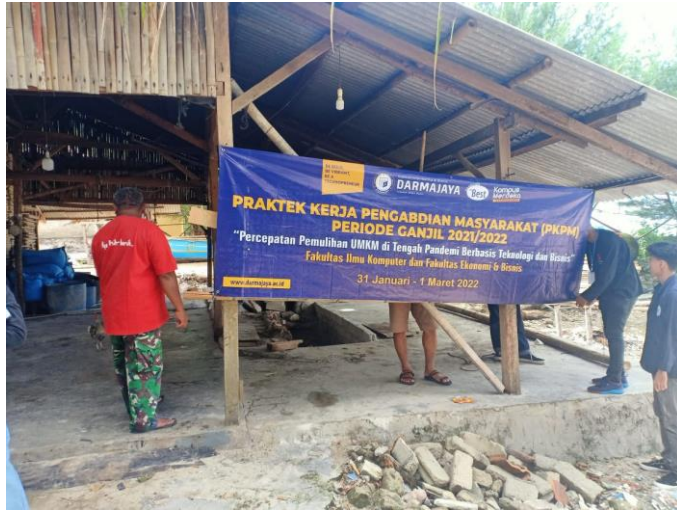
Gambar 2.2 Pemasangan Banner lokasi di UMKM

Pemasangan Banner merupakan hal wajib dalam melakukan PKPM karena menunjukkan identitas Mahasiswa dalam pelaksanaan kegiatan di tempat UMKM tersebut.