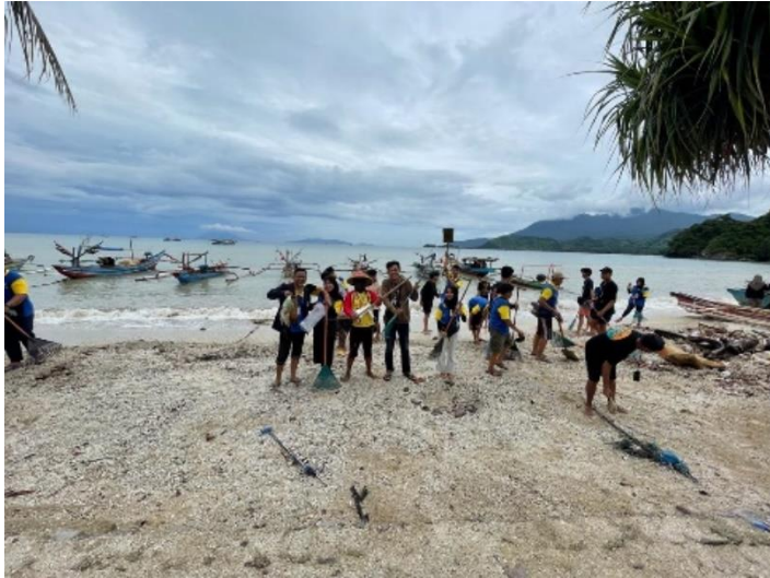
Gambar 2.11 Kegiatan Gotong royong di Pantai Minangruea