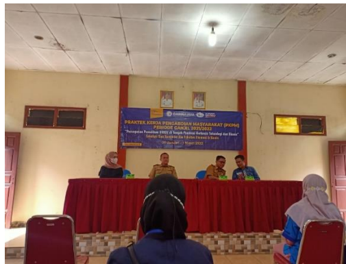
Gambar 2.1 Bersama Bapak Camat dan Dosen IIB Darmajaya

Pertemuan di Kantor Camat Bakauheni pada tanggal 31 Januari 2022 Merupakan pertemuan mahasiswa dengan Pak camat atas pelepasannya Mahasiswa Darmajaya yang ingin melaksanakan PKPM di Desa Kelawi Mulai dari tanggal 31 Januari – 1 Maret 2022 di terima dengan baik.