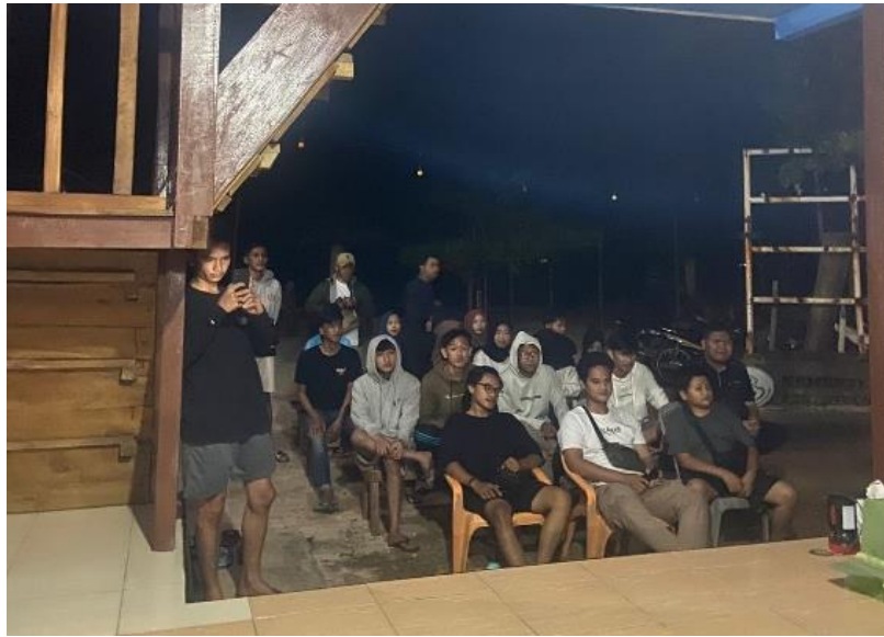
Gambar 2.16 Perpisahan Bapak Camat Organisasi Pokdarwis dengan Mahasiswa

Kegiatan perpisahan ini sekaligus penutupan PKPM Mahasiswa Darmajaya di UMKM setempat di Desa Kelawi dengan mengadakan acara makan bersama agar silaturahmi tidak putus.