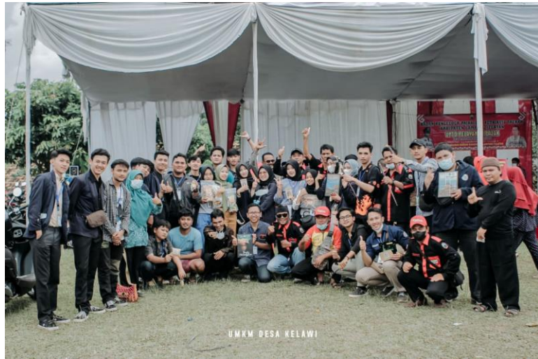
Gambar 2.14 Acara UMKM Musrenbangcam