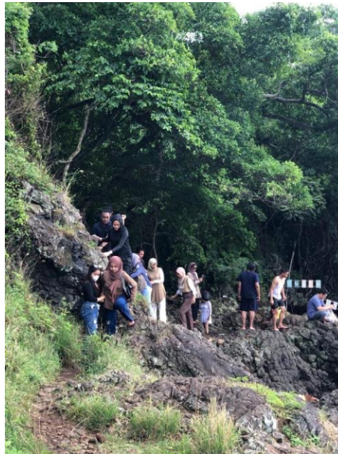
Gambar 2.15 Pendampingan Kegiatan Tourguide

Kegiatan ini dilakukan oleh Pokdarwis Pantai Minangruea dan Mahasiswa Darmajaya dalam memahami dan mengasih arahan agar Pantai Minangruea lebih dikenal secara luas.