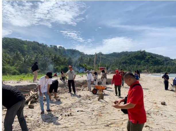
Gambar 2.13 Gotong royong bersama Bapak Camat

Mengikuti dan membantu kegiatan Gotong royong ini dilakukan oleh mahasiswa dan Bapak Camat. Agar pantai Minangrua selalu indah dan bersih dari sampah-sampah berserakan.