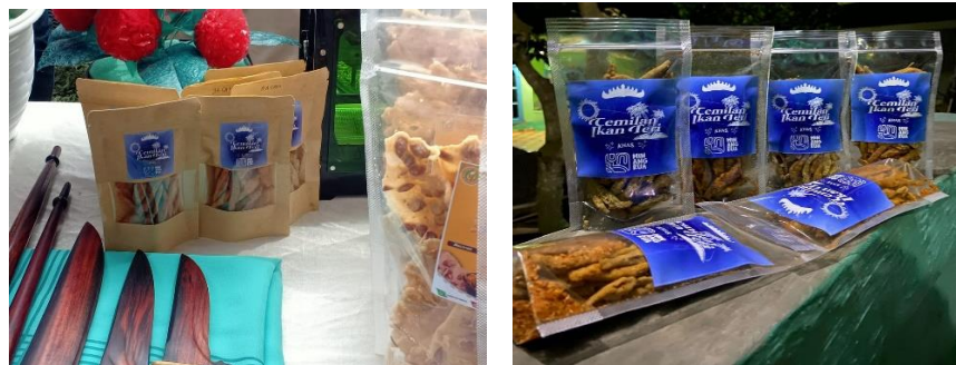
Gambar 2.6 Varian Rasa Balado dan Original Crispy

Menginovasikan Olahan Ikan Teri dengan menambahkan varian rasa yaitu Balado dan Original Crispy. Dengan menambahkan rasa varian Olahan Ikan Teri menjadi memiliki nilai jual yang tinggi dan menambah rasa pemasaran konsumen untuk mencicipi rasa yang berbeda-beda.