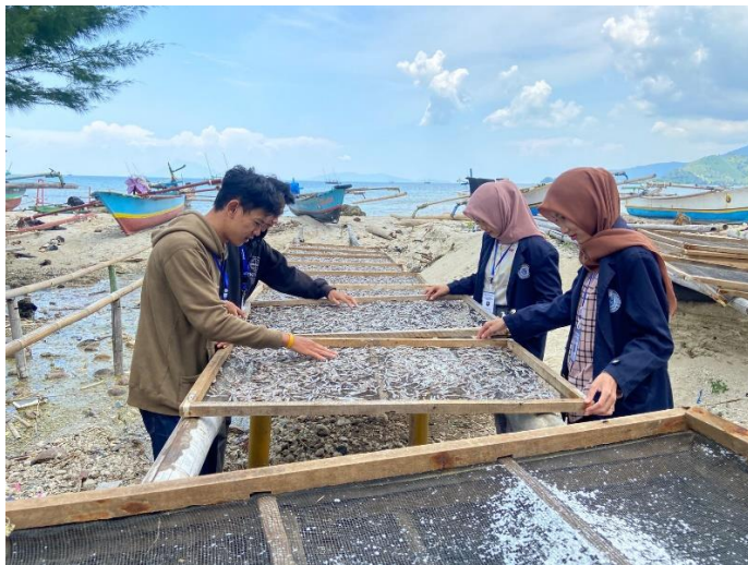
Gambar 2.12 Penjemuran Ikan teri di Pantai Minangruea

Membantu proses penjemuran di Pantai Minangruea. Dengan membantu prosesan ikan teri ini , membuat ikan teri dari yang mentah menjadi Olahan ikan teri.