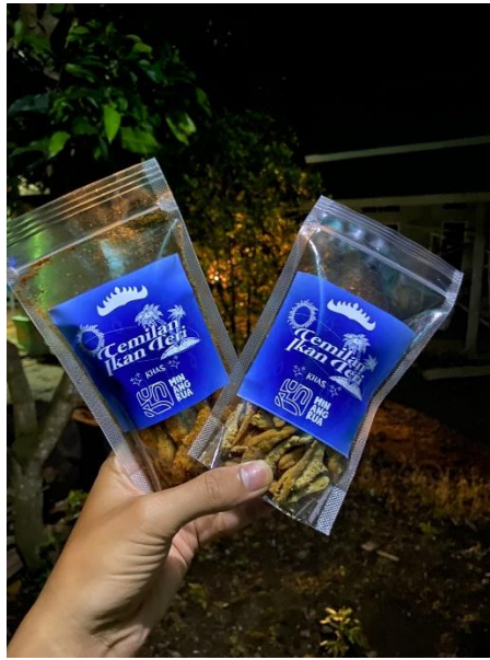
Gambar 2.5 Ikan Teri Balado dan Original Crispy