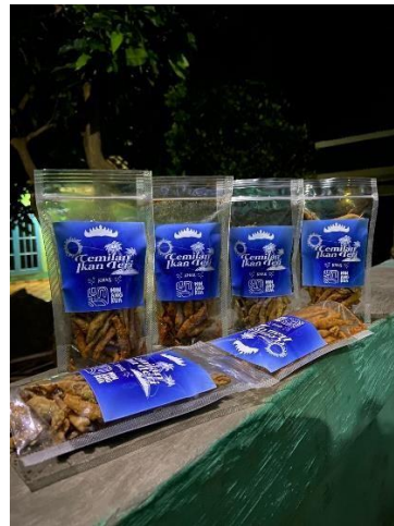
Gambar 2.7 Pembuatan logo pada UMKM olahan ikan teri