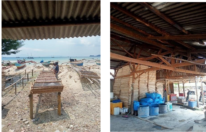
gambar 2.13 penjemuran olahan ikan teri basah