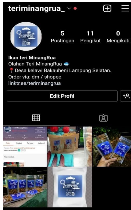
Gambar 2.1 Pembuatan Akun Media sosial Instagram