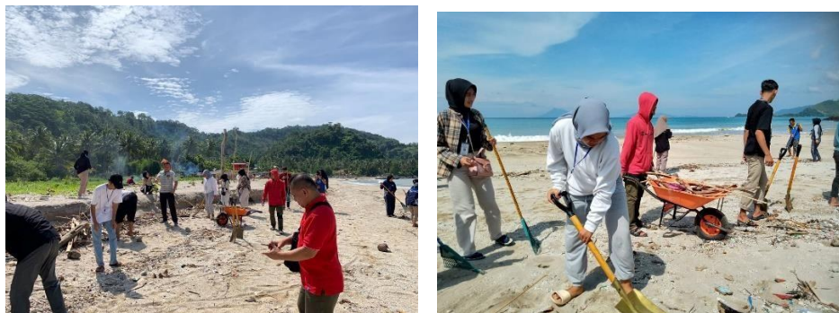
Gambar 2.10 Gotong royong bersama Bapak Camat