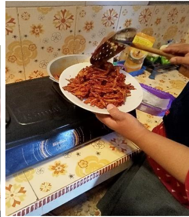
Gambar 2.4 Membantu proses pembuatan teri balado