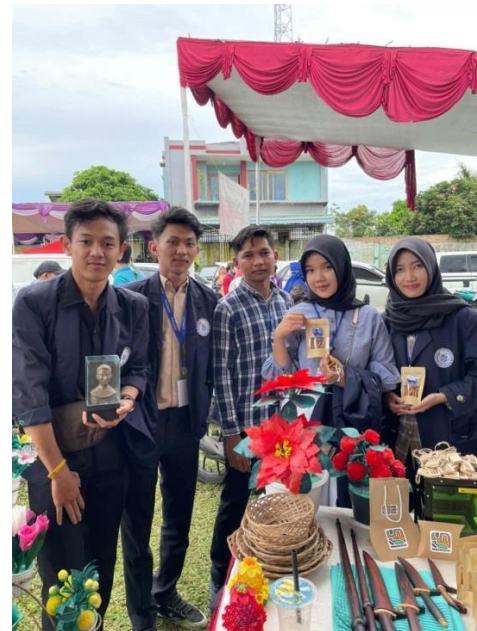
Gambar 2.11 Acara Musrenbangcam di kantor camat bakauheni