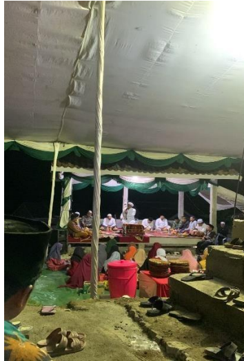
Gambar 2.15 Acara Isra mira'j desa kelawi