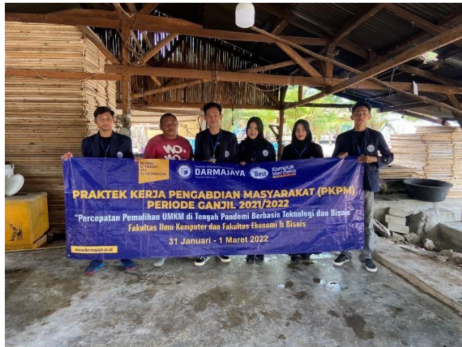
Gambar 2.3 pemasangan banner di lokasi UMKM