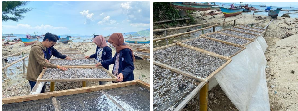
Gambar 2.9 Proses penjemuran Ikan teri