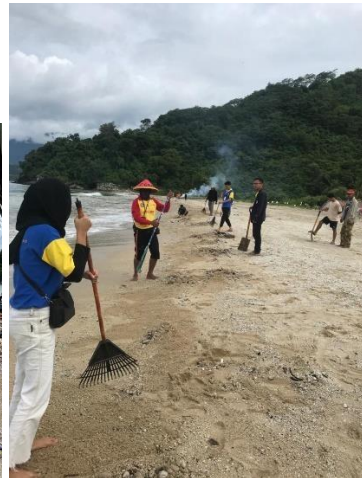
Gambar 2.5 Membantu gotong royong di pantai minangrua