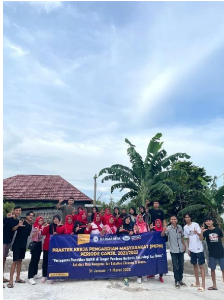
Gambar 2.6 Senam bersama ibu-ibu Desa Kelawi