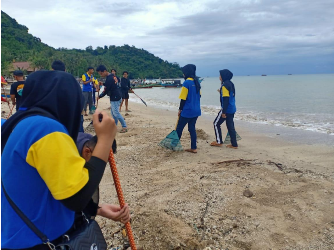
Kegiatan Gotong Royong bersama Kepala Pengelola dan Warga sekitar di Pantai Minang Rua