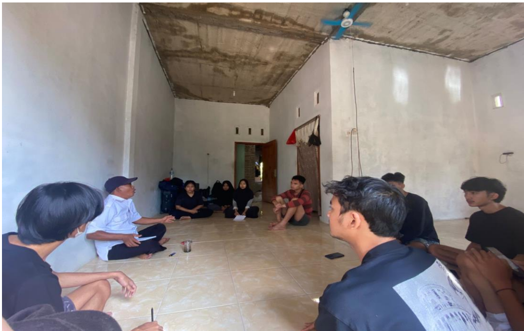
Berkumpul pengenalan dengan aparat Desa Kelawi, Bakauheni