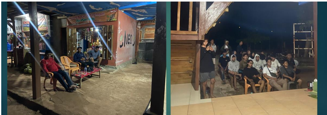
Acara Pelepasan Mahasiswa PKPM 2022 IIB Darmajaya di Pantai Minang Rua