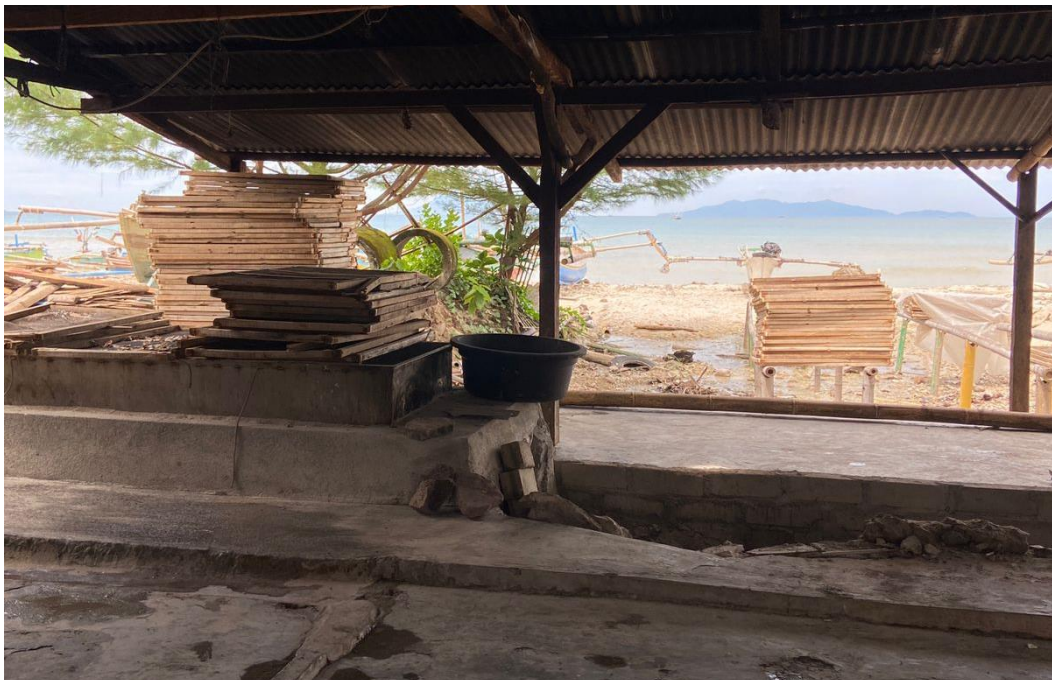
Tempat Perebusan dan Penjemuran Ikan Teri