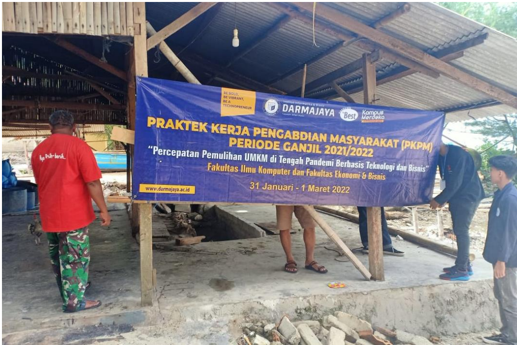
Pemasangan Banner Praktek Kerja Pengabdian Masyarakat (PKPM)