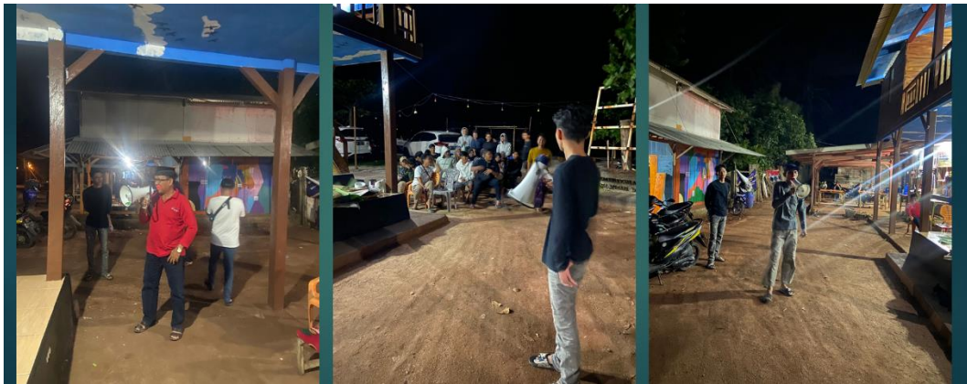
Acara Pelepasan Mahasiswa PKPM 2022 IIB Darmajaya di Pantai Minang Rua