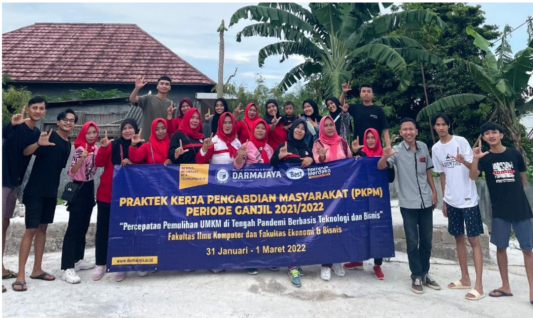
Senam Bersama Ibu – ibu