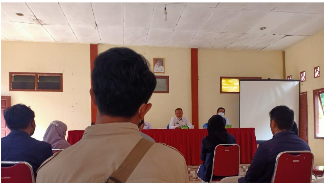
Pelepasan Mahasiswa PKPM IIB Darmajaya 2022 Di Kantor Kecamatan Bakauheni