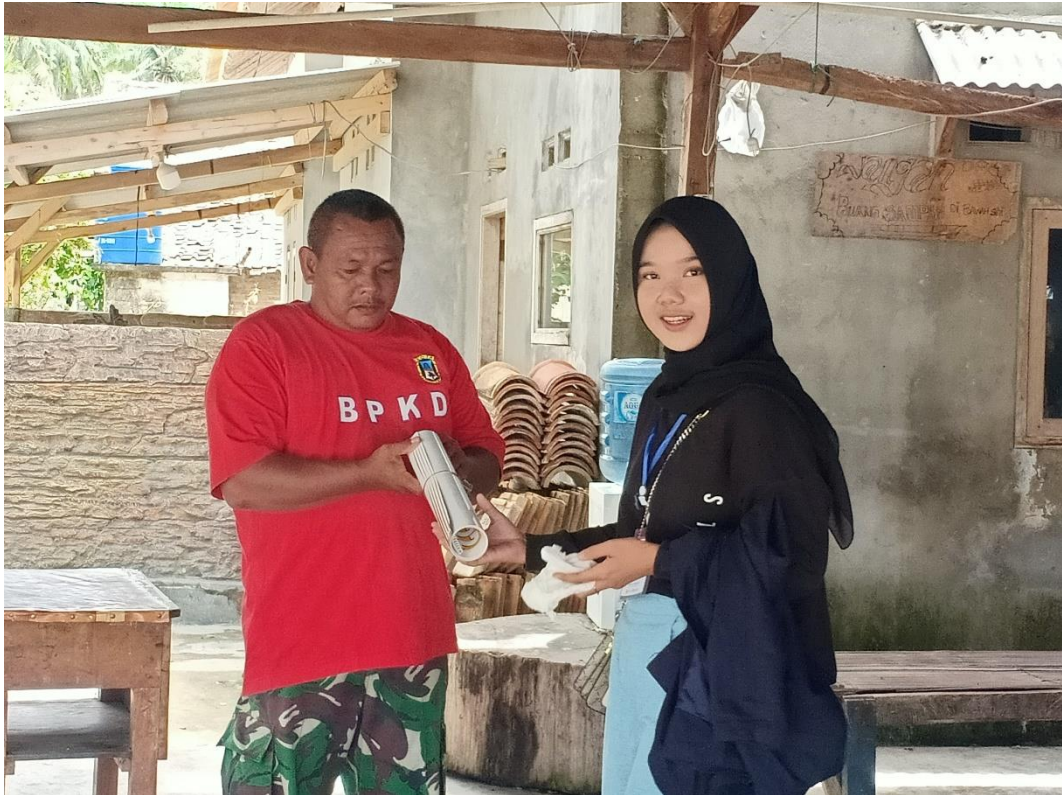
Pemberian kalender kepada pihak UMKM Olahan Ikan Teri