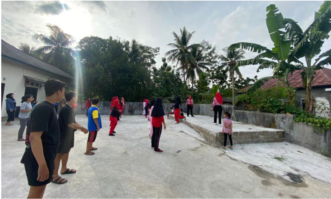
Senam Bersama Ibu – ibu