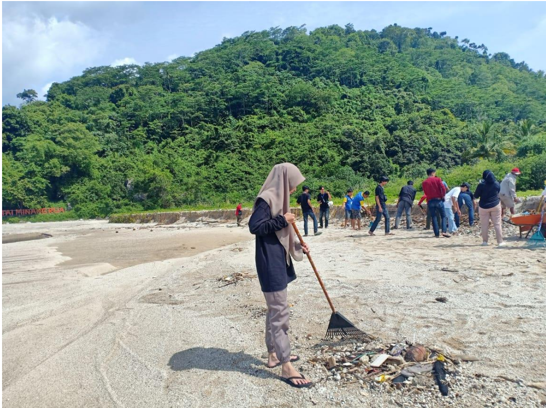
Kegiatan Gotong Royong bersama Bapak Camat di Pantai Minang Rua