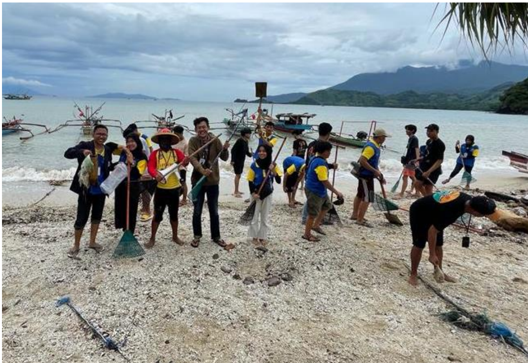
Kegiatan Gotong Royong Di Pantai Minang Rua