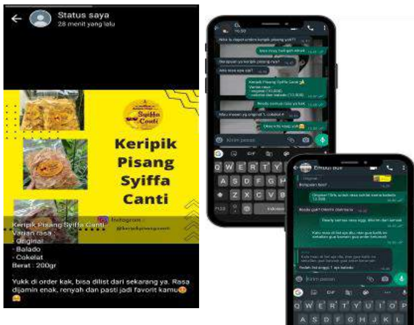
Gambar 2. Whatsapp