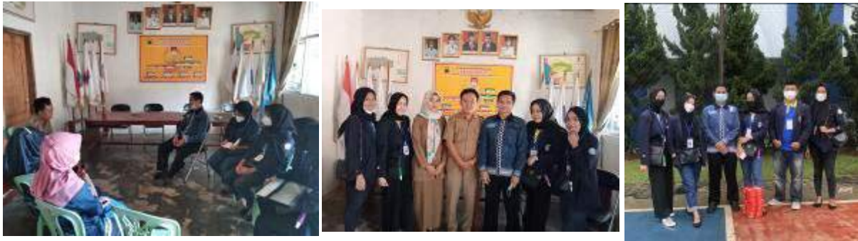
Gambar 1. Pelepasan PKPM